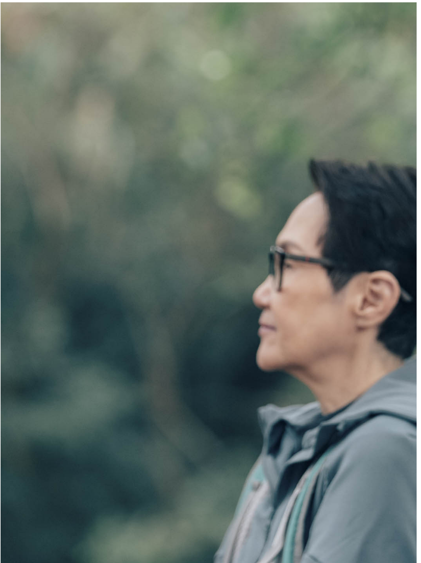
《从今以后》剧照。

要切入讨论《从》的戏，一定要细心分析大哥一家所代表的典型家庭，对比Pat姐姐与Angie姨所代表的香港典型年长女同志家庭。电影没有着力描写女同志的爱欲或角色定型，以至电影不会落入一种陈腔滥调的同志猎奇想像，导演甚至落力将情侣二人尽力平常化，日常生活，社交正常，一对一单偶，一生一世的承诺等等，是无可挑剔的同志模范。大哥一家则是刻板又残忍的写实，戏内每逢Victor出场，我就感觉他异常挤眉弄眼，好像想掩饰自己的虚伪，无能又要充撑的狼狈境况。导演写Pat姐姐与哥哥一家的感情大多都是建立在金钱援助之上，仿佛Pat姐姐是穷的，他们就不会接纳她成家庭一员，更枉论还要接纳她的同性伴侣。