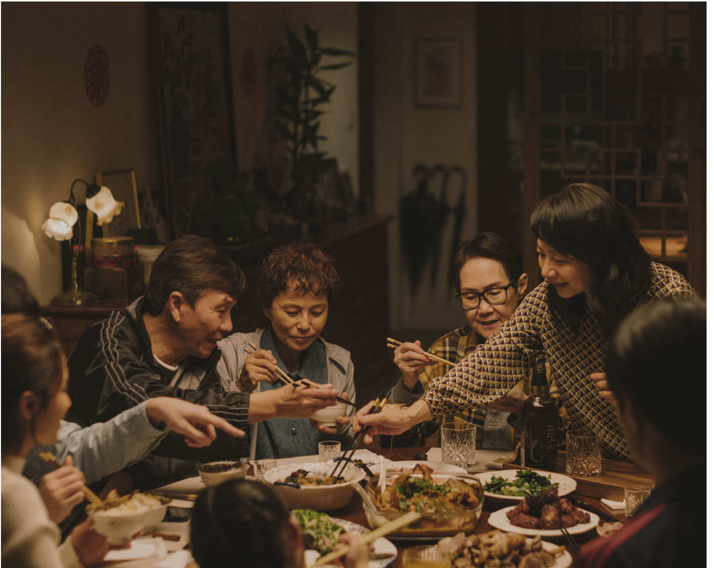
《从今以后》剧照。

《从今以后》之前的香港女同志电影表现令人一言难尽，身为香港女同都不想被它们代表。