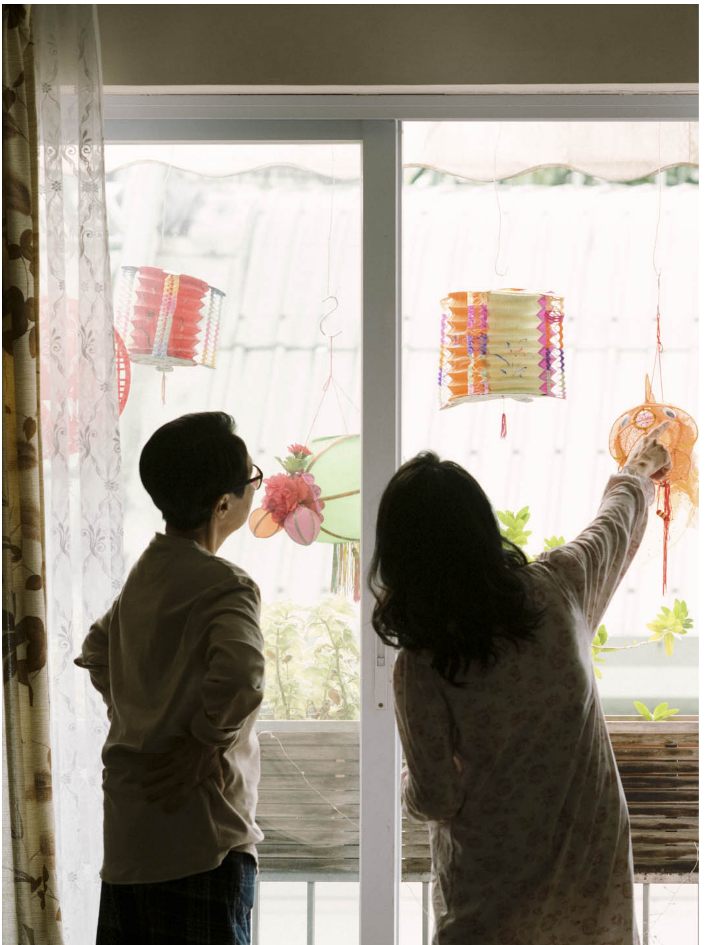
《从今以后》剧照。

对于同志来说，这电影根本是恐怖片，是每日上演的真人真事，恐怖程度不亚于近日热话的《驯鹿宝贝》，更恐怖的是现实还要血淋淋和呕心上万倍。大哥于戏中高潮大义凛然的抛下一句：“我们胡家不欠你什么。”是将主流的意见都说出来了：政府、社会、传统不欠同志什么。简单总结，我会将这些论调一概形容为：你们都是胡家的。不是所有基层和异性恋都没骨气会谋人家产的，因此不是因为大哥一家是收入微薄的异性恋就等于是衰人，而是打从骨子里他们的家庭价值观是这样，是得了便宜还卖乖，家人死后就装都不用装了。不过我无意制造二元对立，放在电影中的平权敌人是食人的礼教，是古老装潢的骨灰龕场，是无视女人的风水丧殡仪式，是名为一家之主、传宗接代的壮阳药，茅头清楚不过。