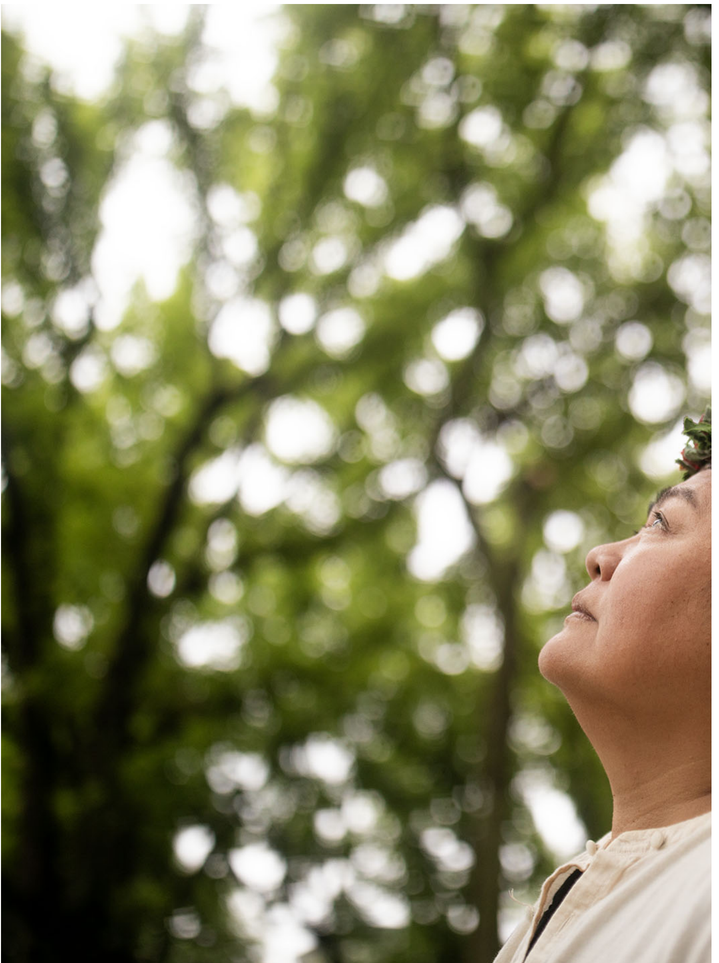
台湾原住民族歌手巴奈。