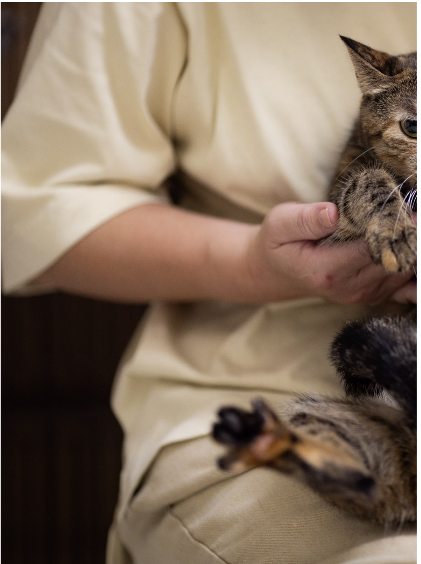
2024年5月2日，花莲，天王星大楼内的猫妹妹。