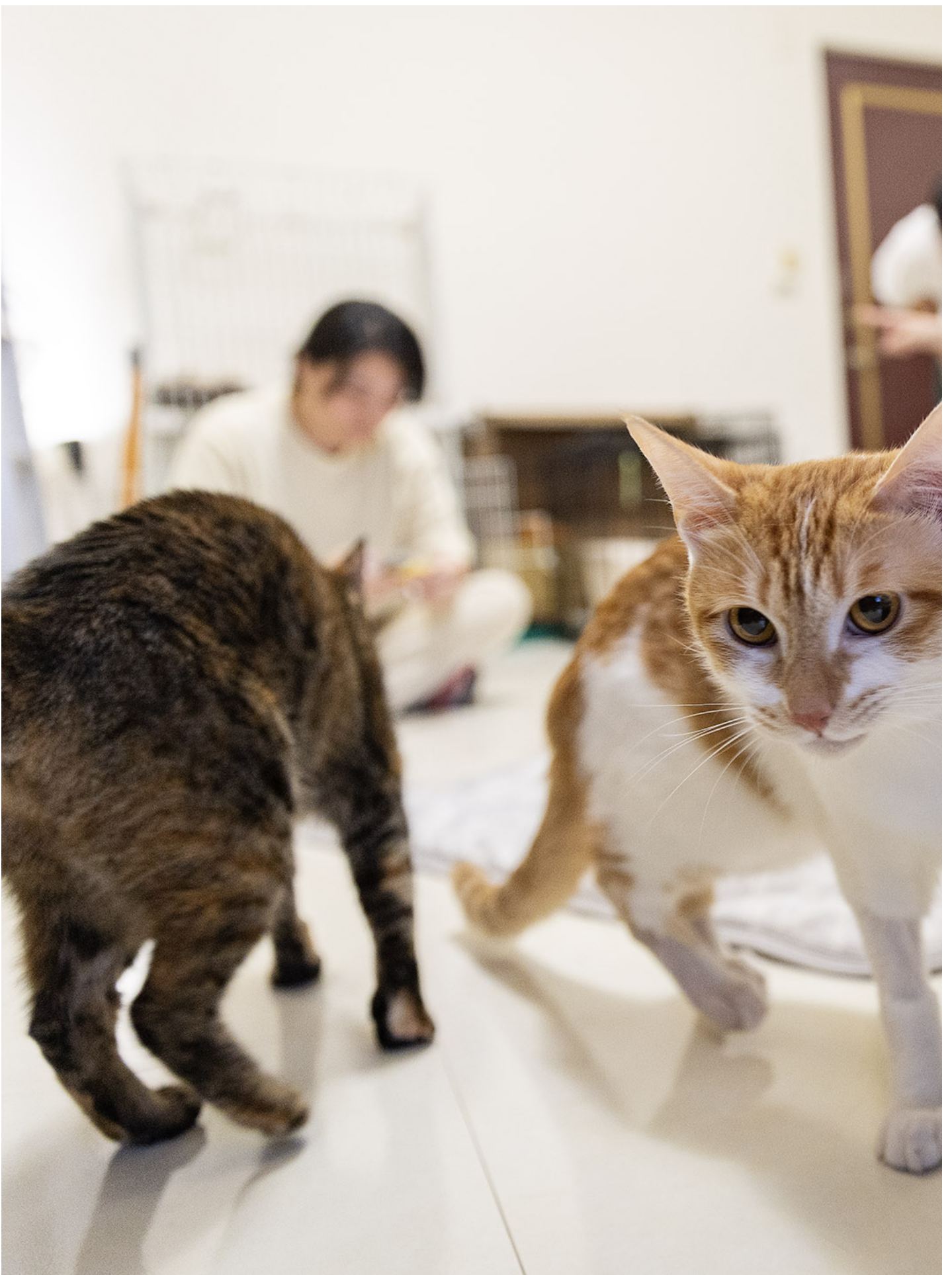
2024年5月2日，花莲，天王星大楼内的猫橘子。