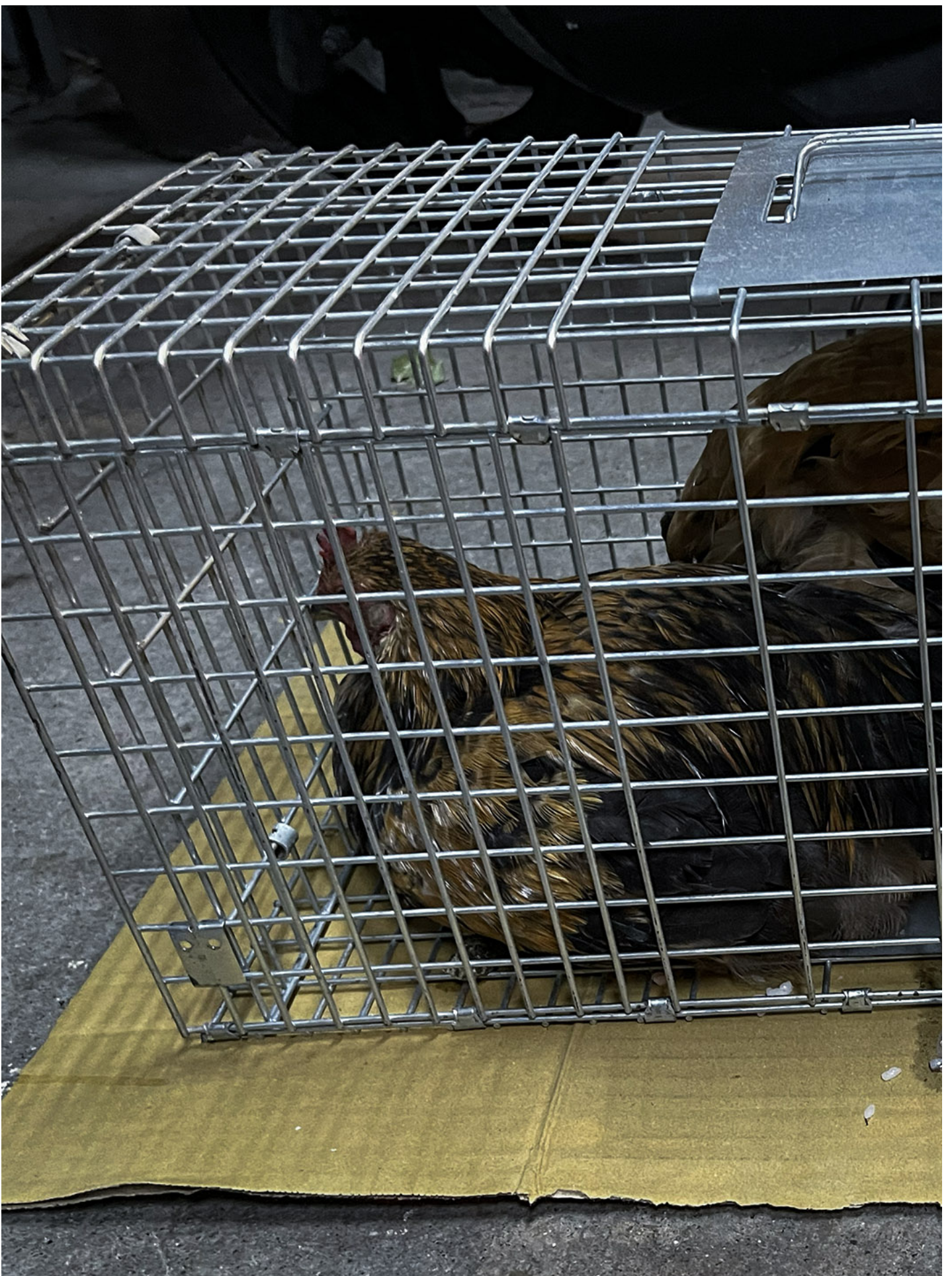
花莲天王星大楼上获救的鸡。

另一方面，关心鸡安危的声音，更容易感受到反对救援者的恶意：“救下来也是加菜”、“你平常不吃鸡肉吗？”对他们来说，这是消遣“救鸡派”的玩笑。也有许多网友在救猫行动中问到“鸡呢？”或许他们并非真正关心鸡的生命，只是想借此讽刺救猫者的道德标准不一致。