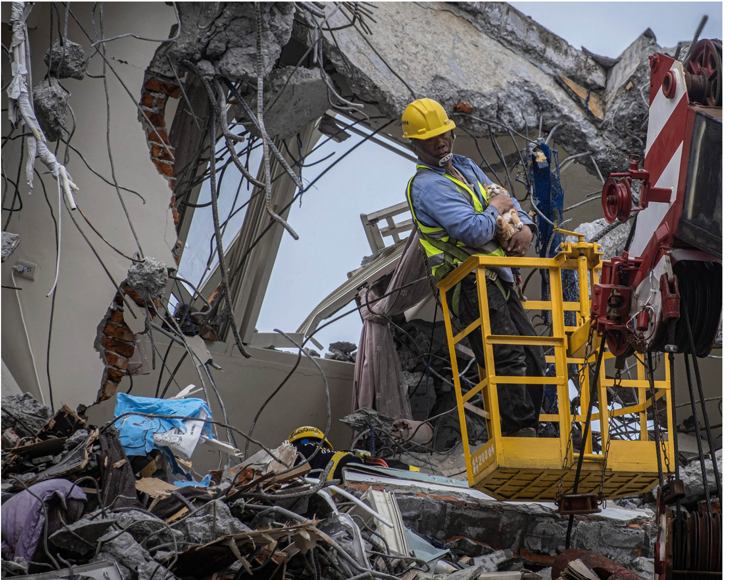
2024年4月13日，花莲，工程人员在天王星大楼上救出一只猫。

4月3日一早还不到八点，住在花莲市区一处大楼八楼的洋洋被一阵剧烈的摇晃震醒。在她还在朦胧中时，悬挂在套房墙上的热水器“碰！”的一声掉落，水管因而断裂，喷溅洒出的水很快地蓄积成摊。