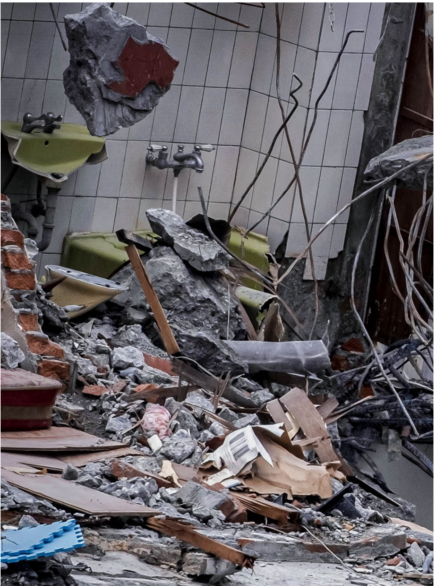
2024年4月13日，花莲，一只猫在天王星大楼上。