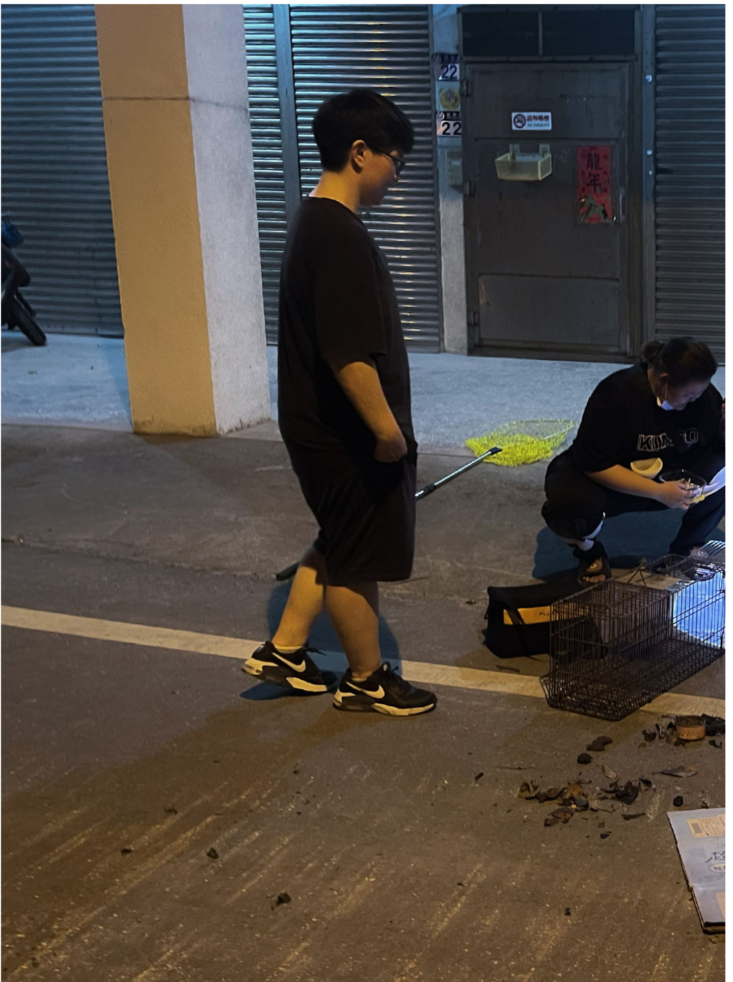
花莲天王星大楼，一只叫欧膩的猫跑进下水道，猫志工帮忙找猫。