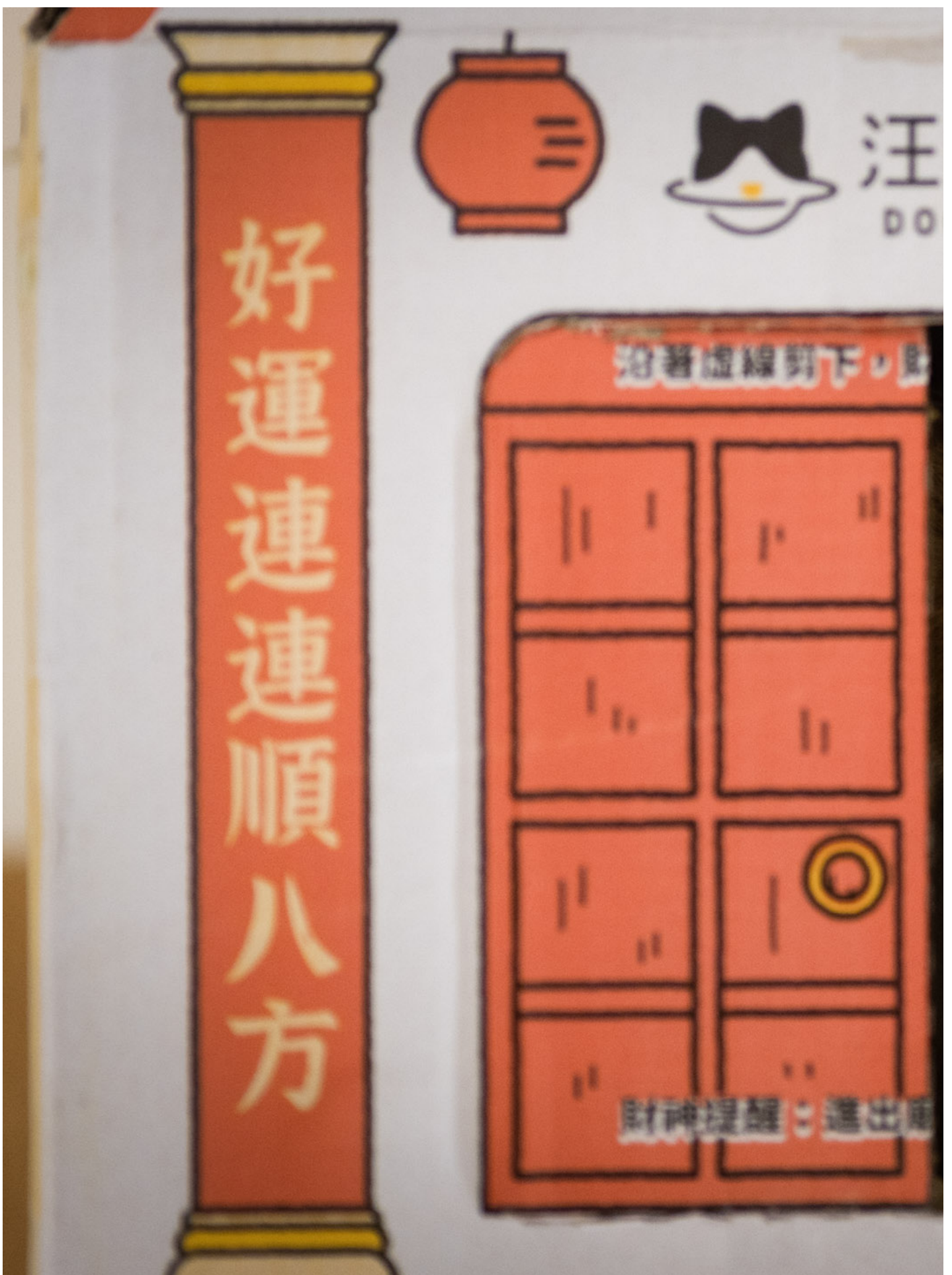
2024年5月2日，花莲，天王星大楼内的猫橘子。