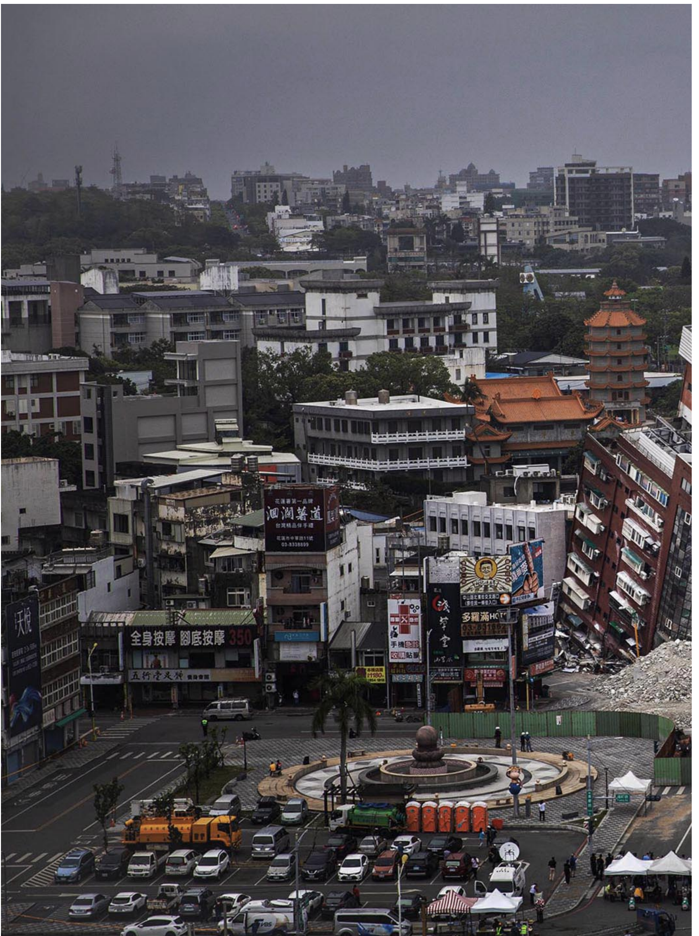
2024年4月5日，花莲，因地震而倒塌的天王星大楼。

4月9日，拆除工作进行到第五天，施工单位拆除到八楼时，七楼铁窗外，赫然出现了一只橘白猫以扭曲的姿态卡在窗内。地震后一周，在已成断垣残壁的建筑中，一只如此鲜明的生命，就这样悬空在大楼外墙，让人无法忽视。