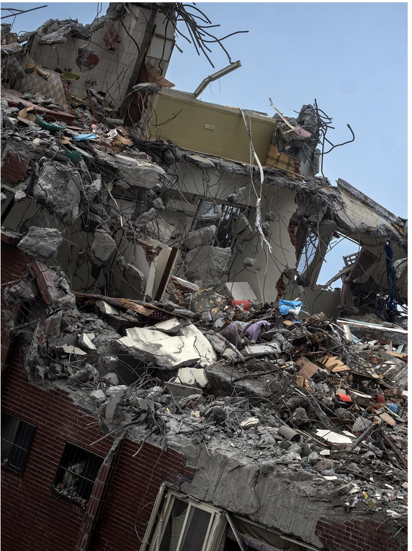
2024年4月13日，花莲，工程人员在天王星大楼上尝试带走倒塌房子内的猫。

从那时开始，每当怪手师傅或其他工程人员发现疑似出现猫的踪影时，他们就会透过主管小林通知志工小兆，请几位猫志工到现场准备，以让猫随时现身时，能有懂猫的人在旁提供建议。