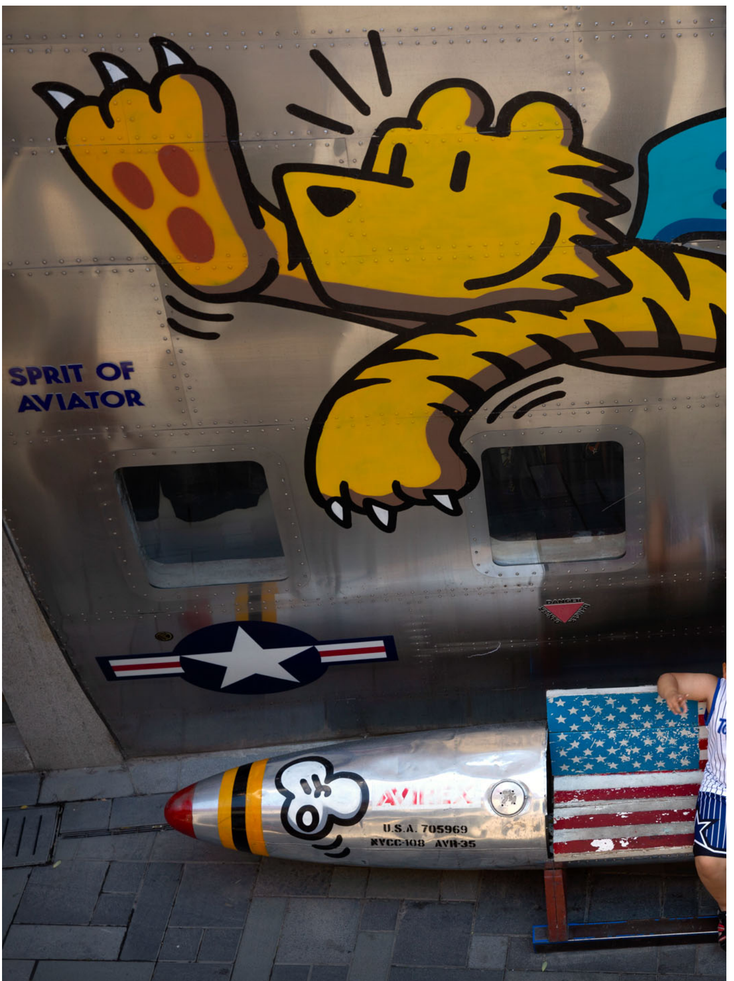
2019年6月29日，中国北京，一名男孩坐在导弹形状的长凳上，长凳上涂有美国国旗。

近年来，作为华人和不同国家左翼学者/运动人士聊天时，笔者时常有这样一种体会：中东、东南亚、拉丁美洲的左翼人士，往往呈现出相当“亲中”的姿态，即他们会为中国政府的许多政策辩护。值得注意的是，这种辩护在语法上有一个曲折的二段论，那就是当聊到中国的边疆民族问题、内部的人权问题、党/政府施政的问题和未来风险时，这些国际人士往往会先认真肯定问题的存在：“这些事情我都知道”，然而又会给出一个会被讥讽为“whataboutism”的转折——“但难道你要指望美国吗？美国政府难道做得不是更差吗？”他们的此番辩护在语法上不同于中国政府。又不像很多华人期待的那样，把抨击中国的错误做法当作主要工作。