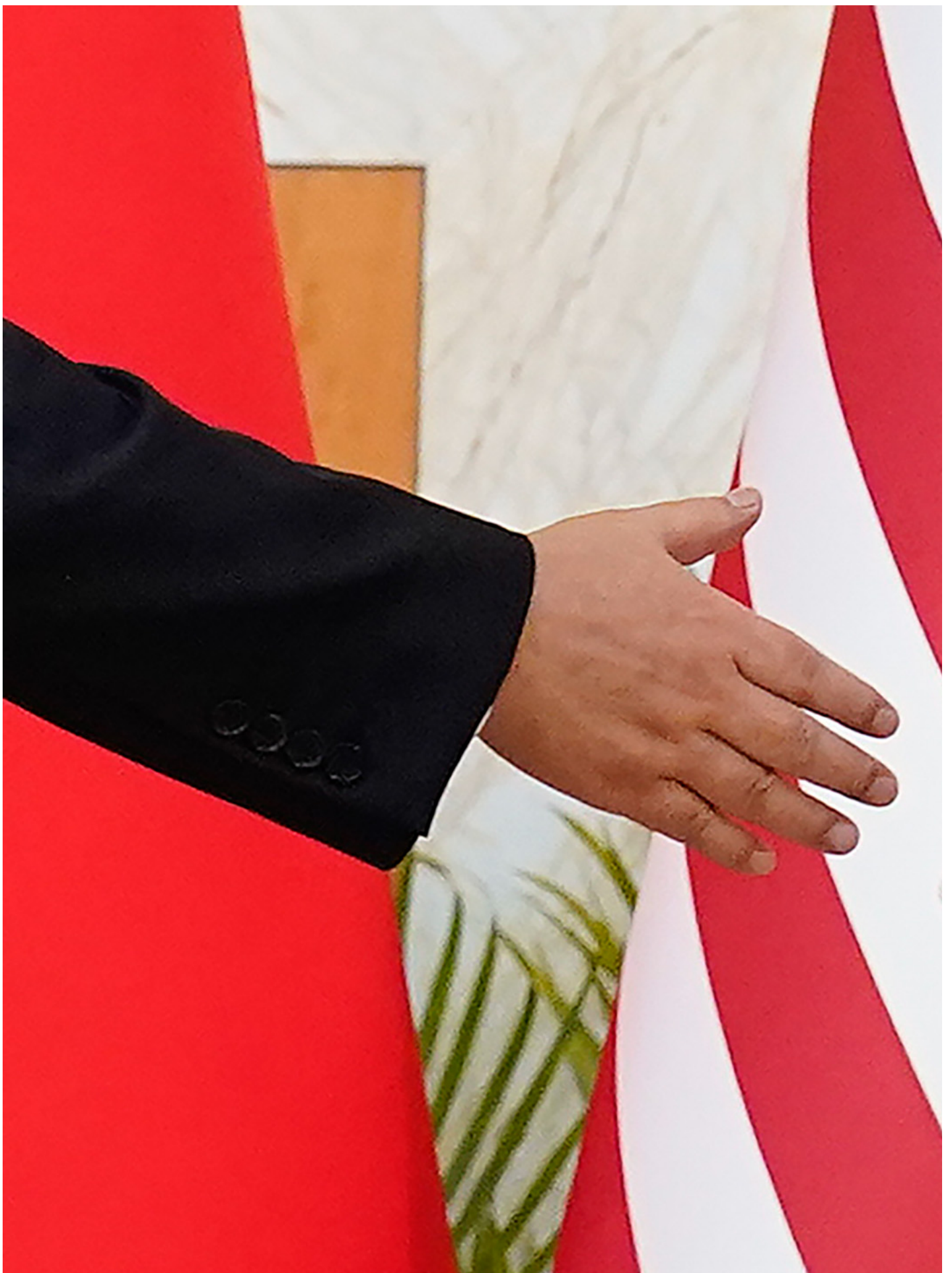
2022年11月14日，美国总统拜登（右）和中国国家主席习近平（左）在会面前握手。