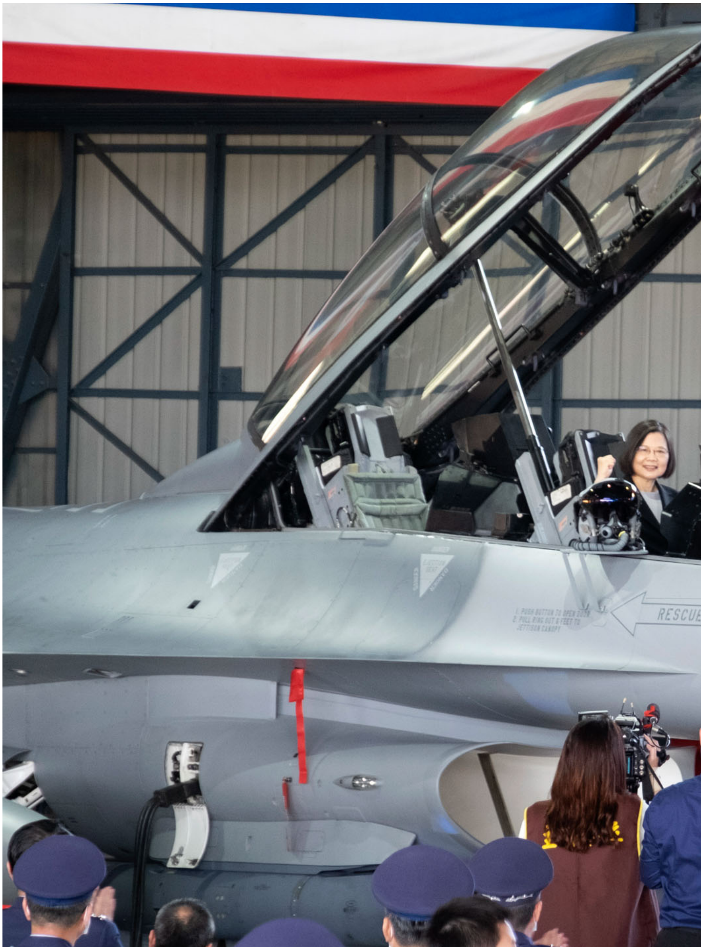
2021年11月18日，台湾，台湾总统蔡英文在空军基地，坐上美国研发的F-16V 战斗机。

帝国的民族国家的政治主权和经济主权问题，又会和全球资本主义的存续怎样互动？笔者认为，我们有必要重视这种对未来的分析。甚至可以说，不光是“华人左翼”，全球左翼的困境和尴尬，也和进行中的这种变化有所关联。