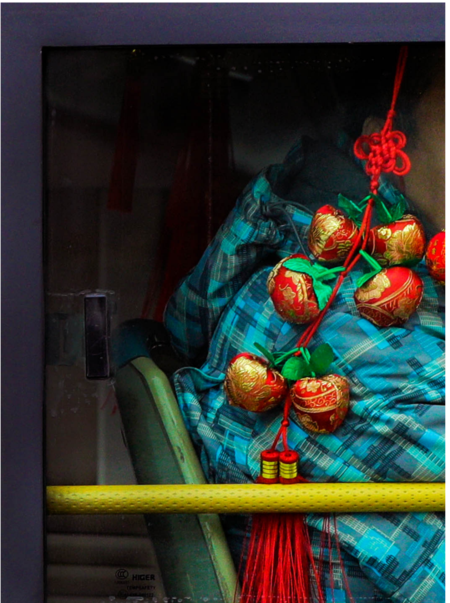
2019年1月7日，中国北京，一名男子正在从公车窗外往外看。

但社运模式在21世纪“历史终结已经终结”的状态下还能否继续扮演重要角色？我们目前没有定论，但看起来，后冷战时代社运左翼的存在危机，已经纷至沓来：在各种地缘政治危机面前，民族国家的边界在不断强化，重视国家机器的主权能力的论述在很多地方成为主流，视社会运动为“递刀子”或“削弱国家”的声音时而有之。而有核国家参与的大规模战争等新局面，已经让社会运动所能够达成的目标显得越来越渺小。