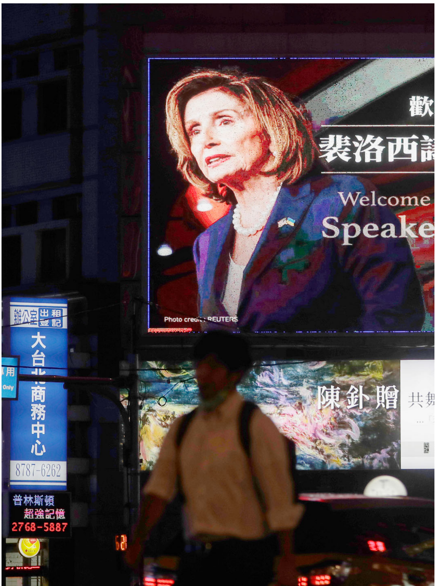
2022年8月2日，台湾，市民经过欢迎美国众议院议长佩洛西的广告牌。

事实上，如果对比恩克鲁玛和尼雷尔对“国家独立”的理解，台湾相对于全球帝国的经济主权能力几乎是少有他者可比。连蔡英文也试图提出，中国大陆对台湾晶片和高科技产业的依赖已经远超台湾传统产业对中国的依赖。事到如今，台湾的经济状况和国际体系中的地位，已经使得“单向依赖”和“过度镶嵌”的理论显得有些不合时宜。