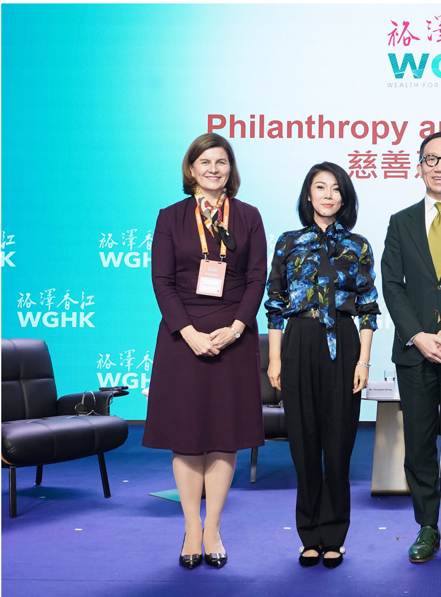
自称是“迪拜王子”的阿里 (Sheikh Ali Al Maktoum) (右二) 获港府邀请担任“裕泽香江”高峰论坛的演讲嘉宾。

阿里原定于3月28日下午在中环举行记者会及启动礼，宣布在港设立家族办公室。不过，阿里的助手在3月27日晚上发表题为《皇室香港办公室暂缓 (Royal Family's HK office in respite)》的声明，宣告翌日记者会取消，理由是“迪拜有紧急事务需要酋长 (指阿里) 的关注”。办公室又于周一4月1日再发声明，强调会按计划在香港设立家族办公室，原定的启动礼会顺延至5月举行，届时阿里会再访香港。