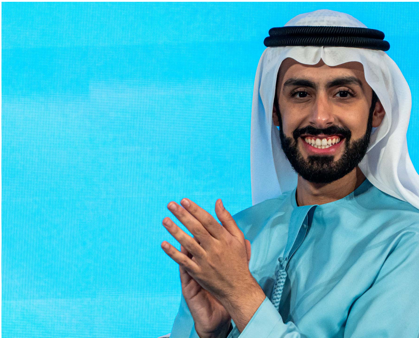
2024年3月25日，香港，自称是“迪拜王子”的阿里（Sheikh Ali Al Maktoum）在高峰会上演讲。