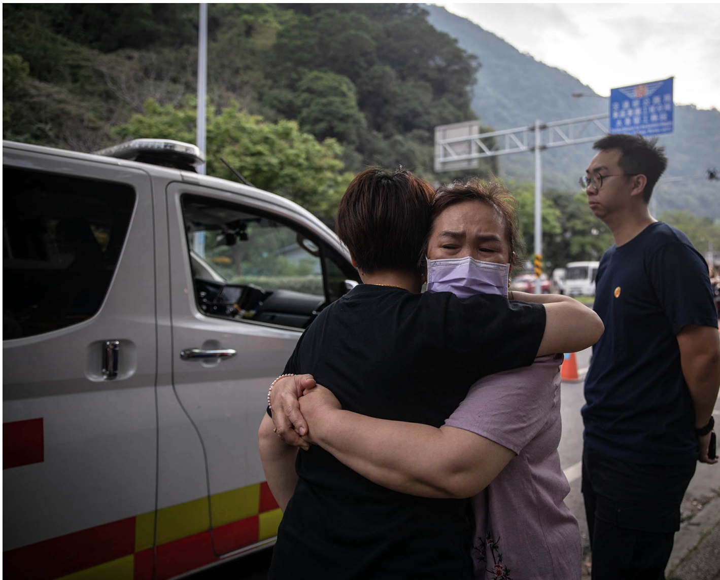
2024年4月5日，花莲，困在山上的人获救后与亲友相拥。