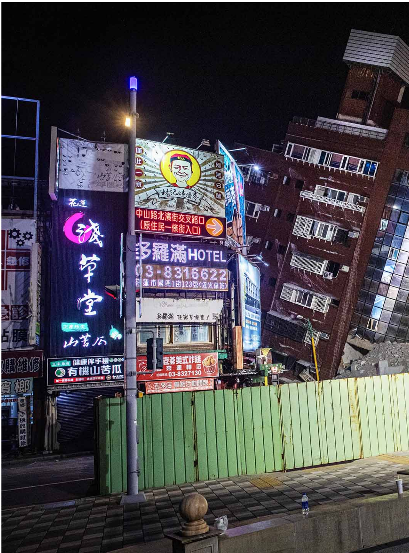
2024年4月4日，花蓮，因地震而倒塌的天王星大樓。

大樓位處花蓮市中心，對面即為花蓮“東大門”夜市，前方廣場設有著名地標“石來運轉”。“石來運轉”原來花蓮車站舊址。1982年，舊花蓮車站正式廢止後，舊車站一帶商圈也隨之沒落。天王星大樓建於1986年，十年後，時任花蓮市長蔡啟塔為重現舊火車站榮光，於此處設立該石雕。