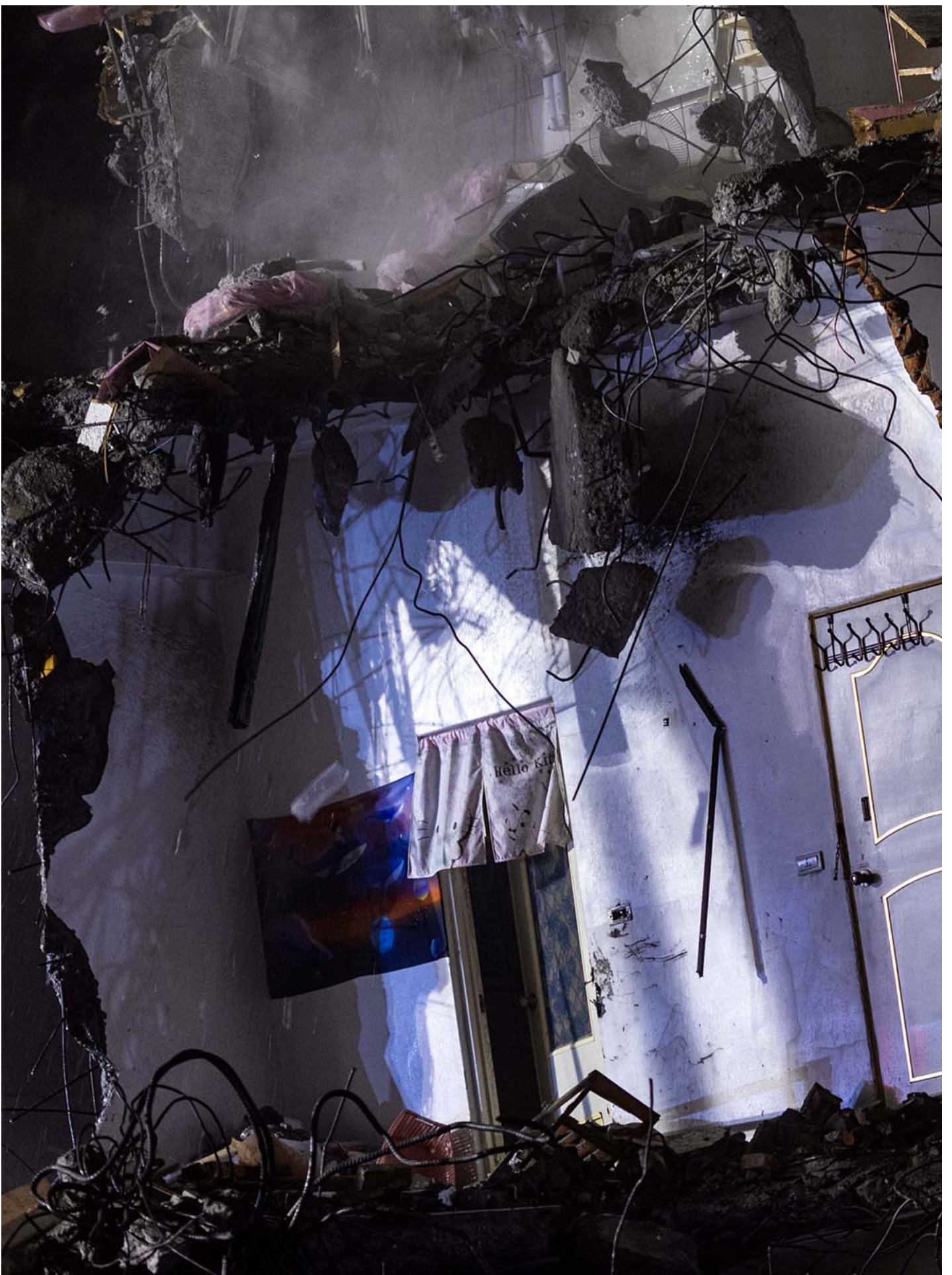
2024年4月3日，一幢受损的大厦遭拆除。

祭拜活动后，拆除作业在十点展开。一部粉红色涂装的机具缓缓驶入现场，漆有 Hello Kitty 图案的机具先是朝九楼位置的玻璃帷幕凿下，大量的碎玻璃飞溅而出，且随著玻璃帷幕的卸除，大量的室内物品从倾斜的大楼流泻倒下，像是从破洞喷洒而出的雪片，哗啦啦地掉在紧急运往现场稳住基座的砂石土堆上。