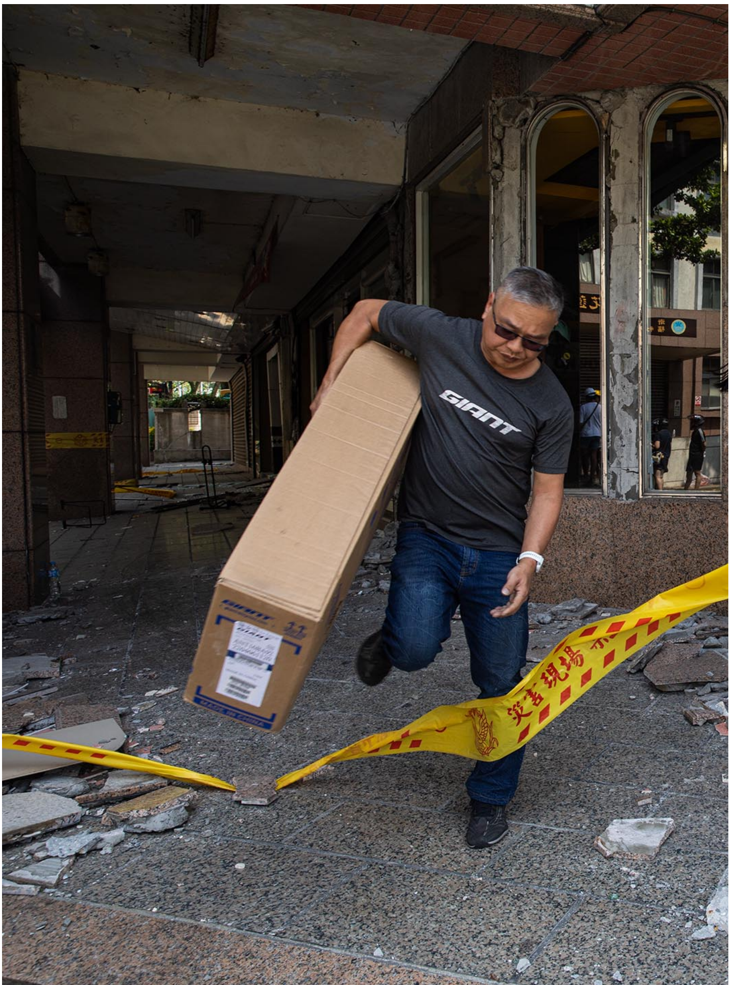
2023年4月5日，花莲，一幢因地震而受损的大楼，居民上楼取回物品。

女子解释说，房子倒掉后，住户一直想回去大楼取回贵重物品，但县府碍于大楼倾斜角度过于危险，何况先前已有一位教师因回去救猫而不幸失去性命，“大楼变刑案现场，我也可以理解政府的规定”，但是她也说，自己女儿的未来都还在那栋楼里，“里头有我女儿的未来”、“要存给女儿留学的钱都还在里面啊”。