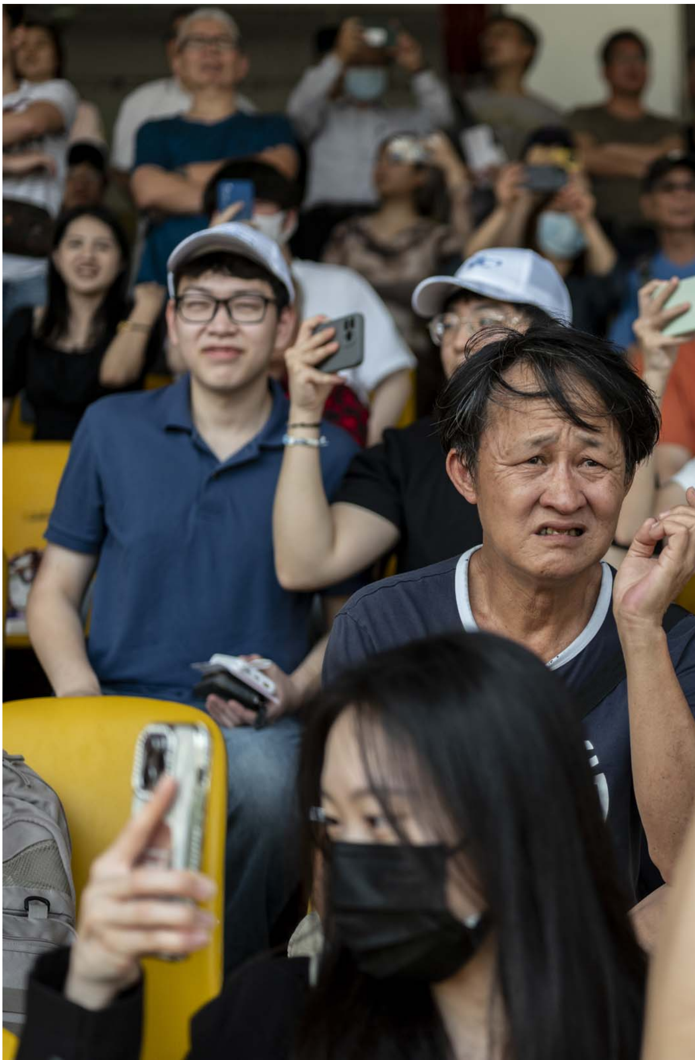
2024年3月30日，澳门赛马会最后一个的赛马日，观众席上有不少年轻人入场。

2018年，马会曾与澳门政府续约专营合同至2042年8月31日，当中规定马会需在2023年年底前注资15亿澳门元，并重修马房和建造马匹主题公园、骑术学校和酒店等。但几年过去，大部分工程未能如期进行。财政局指如马会未能兑现承诺，澳门政府可中止或解除赛马专营批给合同。