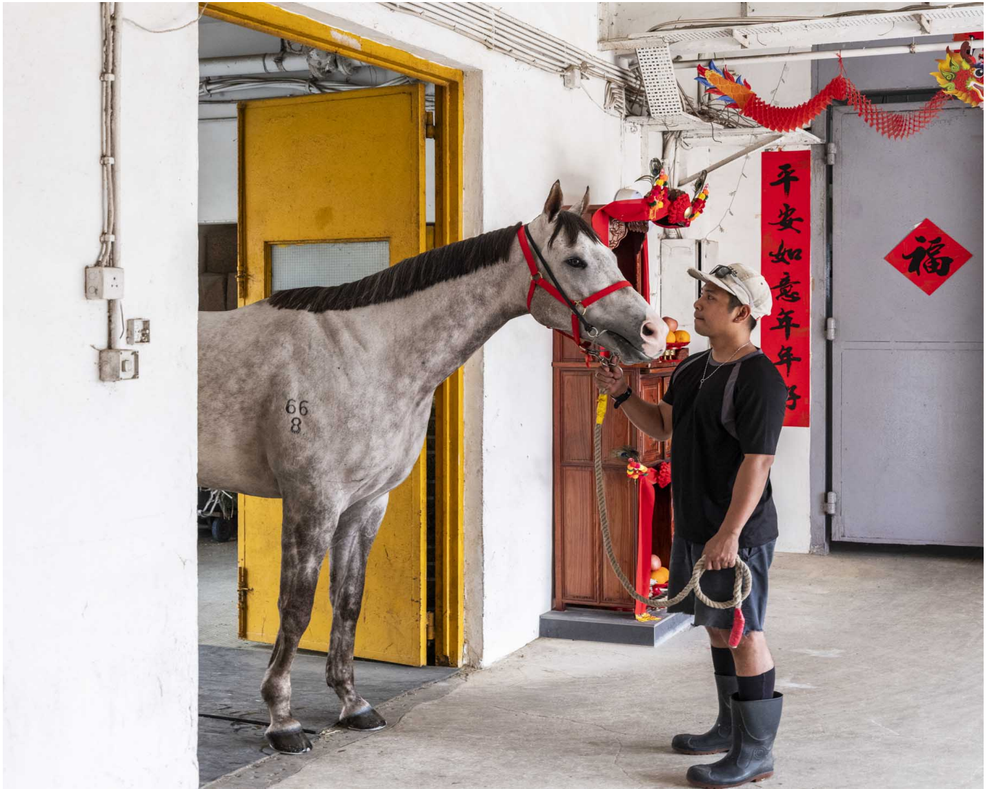
澳门最后赛马日的前一天，马房内马伕牵著一只马。