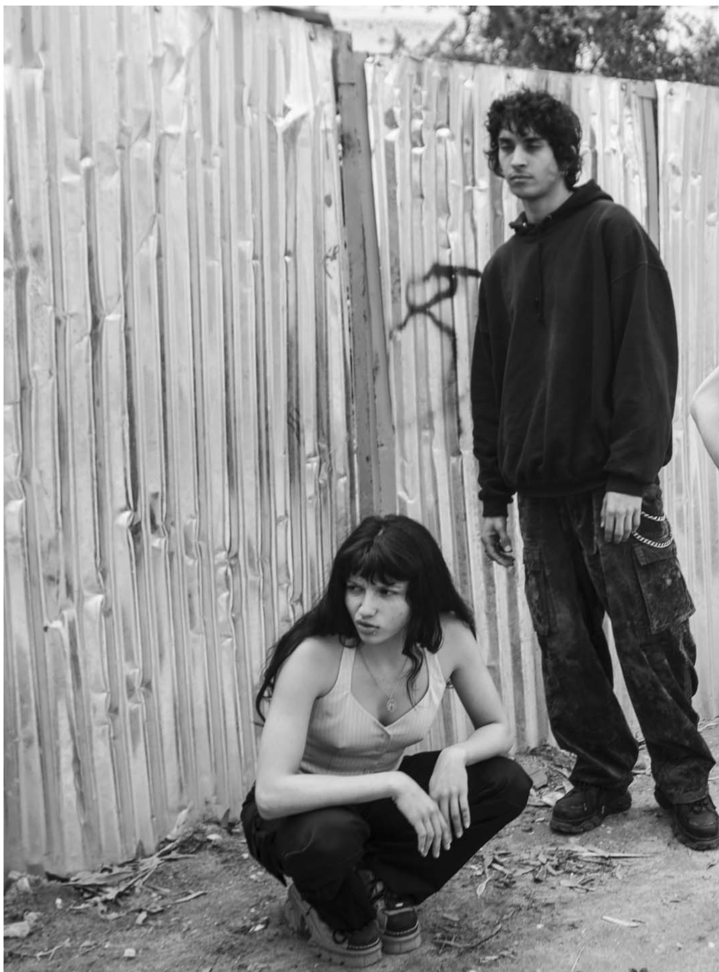
2023年4月14日，突尼西亚，突尼斯市。高中生在西迪布赛义德海滩，庆祝校年完结。由于容易搭乘铁路抵达，这片沙滩是不同社会阶级的青年人聚会的热门地点。

在2011年突尼西亚的革命，引发了“阿拉伯之春”，为追求民主、社会正义、言论自由的突尼西亚青年人注希望。然而，接下来10年，政治动荡、持续的经济问题和政会不欲，对青年人的影响尤其大。突尼西亚超过40%人口，年纪介乎15-34之间。24岁以下的青年失业率达到40%。这个计划拍摄年青人的生活，希望引发更多讨论，令他们带来更好将来。