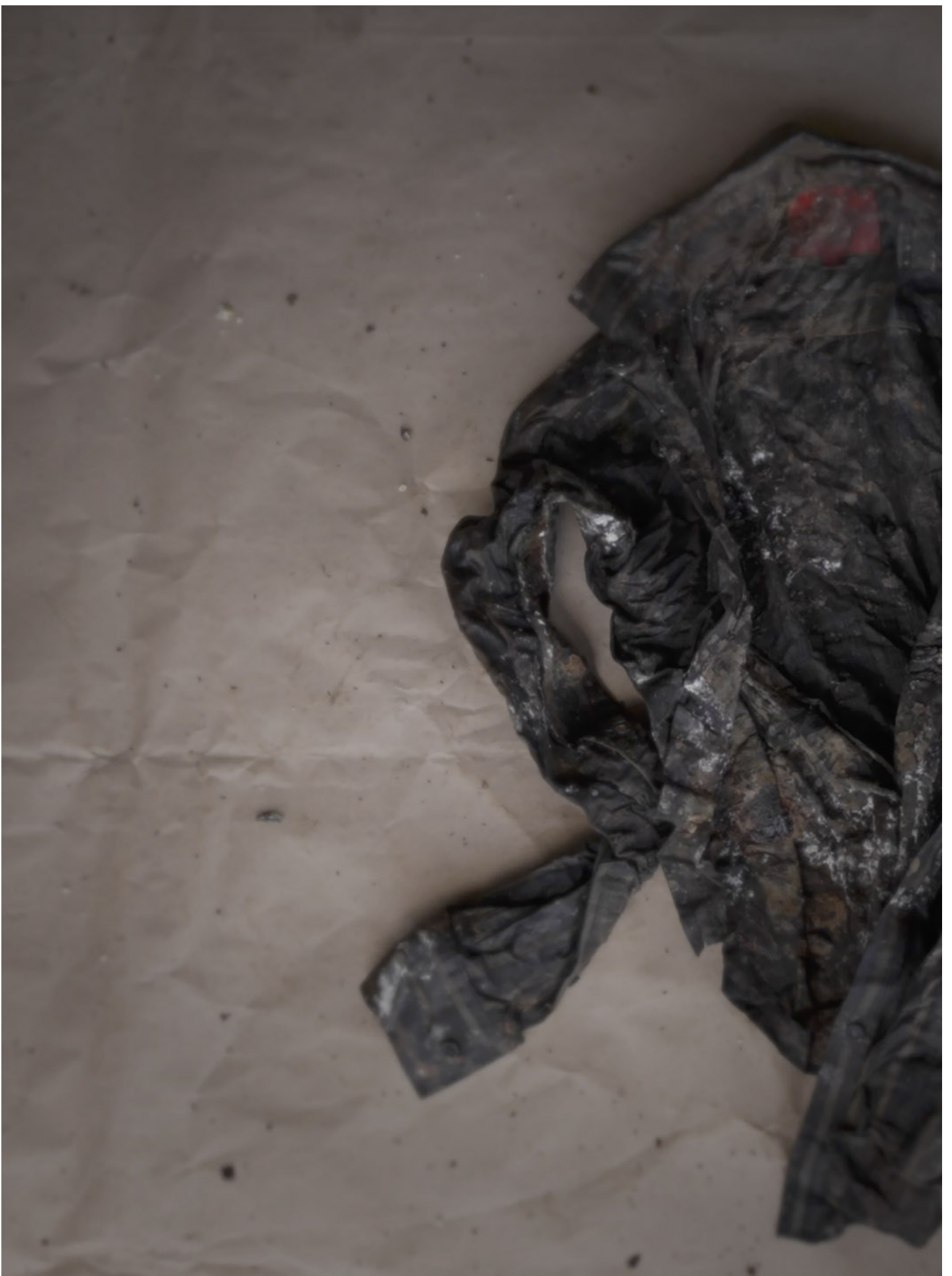
《漂流》截图