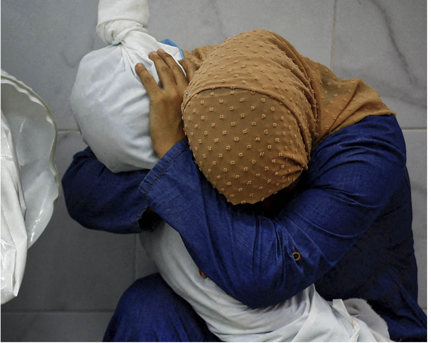
2024年度世界新闻摄影比赛（World Press Photo）亚洲组单张照片冠军，Mohammed Salem 《巴勒斯坦妇女拥抱着女尸首》。

我们要向报道以哈战争，特别在加沙的摄影师致敬，他们承受巨大的风险、创伤和个人损失。