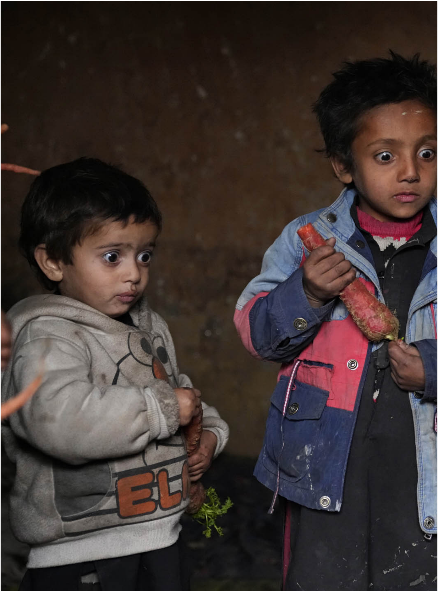
2023年2月2日，阿富汗喀布尔，流离失所的人而设的难民营里，几位孩子双眼盯著母亲乞讨得来的苹果，紧紧不放。

自2021年8月，塔利班对阿富汗掌权后，饱受战争蹂躏、濒临崩溃的经济，持续受到国际援助撤离的影响。4年的旱灾和2次大地震加剧了这场危机。联合国估计有97%阿富汗人活在贫穷线以下，社会服务几乎不存在，因为战争、国家驱逐、而流离失所的人，超过600万人。评审认为，这个计划很有力量，以人为本，能诉说出危机之中的现实情况。