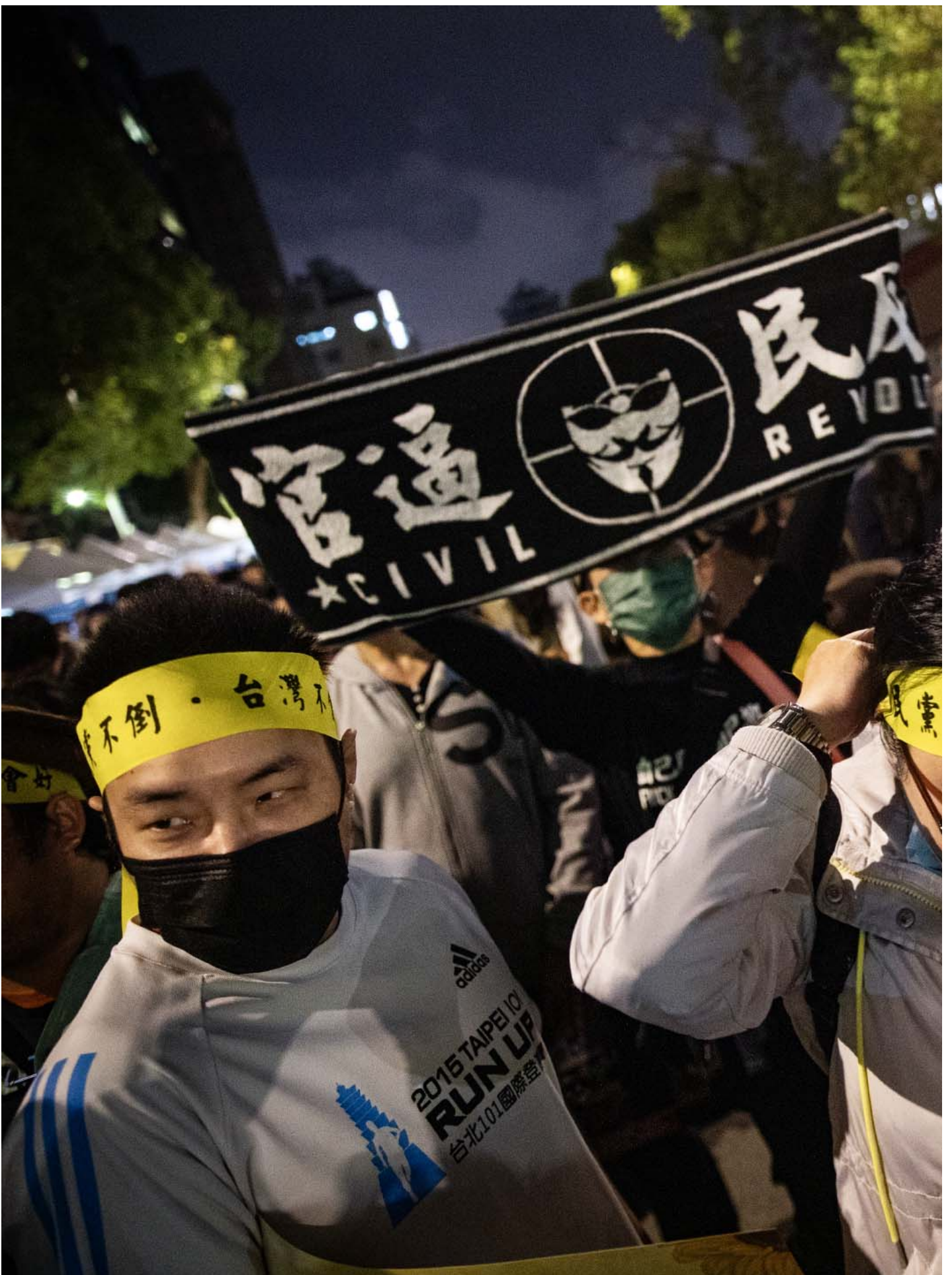
2024年3月18日，台北，太阳花学运10周年晚会。

晚会诉求为“反对重启服贸货贸”、“拒绝中国政经胁迫”、“政党公民政纲对话”。经民连在现场发表两份声明，其中一份对五月即将接任总统的赖清德与目前的新国会喊话，要求拒绝重启与中国的服贸、货贸谈判；同时要求国会应该做出共同决议，要求中国政府放弃强加在与台湾协商的“一个中国原则”政治前提。