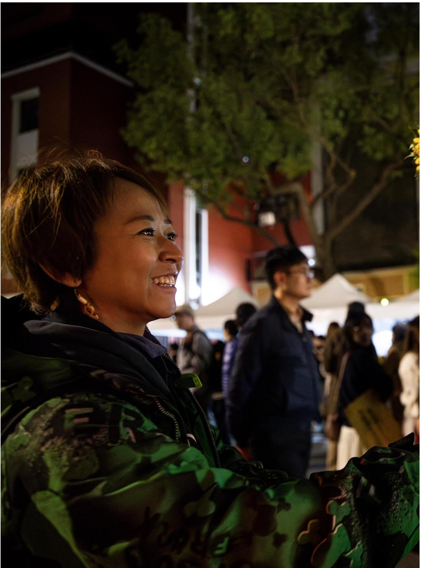
2024年3月18日，台北，太阳花学运10周年晚会。

63岁的李老師是台灣教授協會的成員，她受訪時介紹，當年議場被群眾攻破後，她與其他成員手拉著手守在立法院外不讓警察進入。現時她已從教職退休，再度來到現場，只身舉著太陽花以及“國民黨不倒，台灣不會好”的黃色布條直到晚會結束。