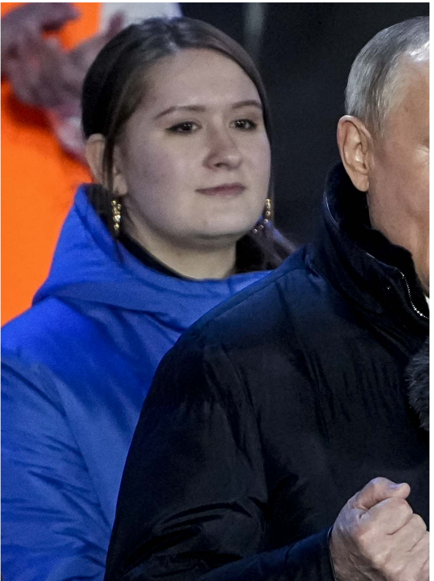
2024年3月18日，俄罗斯莫斯科，俄罗斯总统普京出席庆祝总统选举中获胜，以及吞并克里米亚十周年的音乐会。

大流行期间以防疫为由推出的电子投票和三日投票制这次被继续沿用，或成了选举操纵、舞弊的利器。前者具有可疑的不透明性，且在2021年的国家杜马（下议院）选举中，就已帮助 数位 亲政权候选人翻盘获胜。《欧洲新报》还 发现 ，本次推行电子投票的27个地区多数都是当局得票率长期低迷的地区。而三日投票制则方便了亲政权的企事业单位动员乃至强迫员工在工作日（选举第一天为周五）集体投票。（延伸阅读： 《纽带的重建：俄罗斯流亡独立媒体如何在致命打击后生存与复苏》 ）