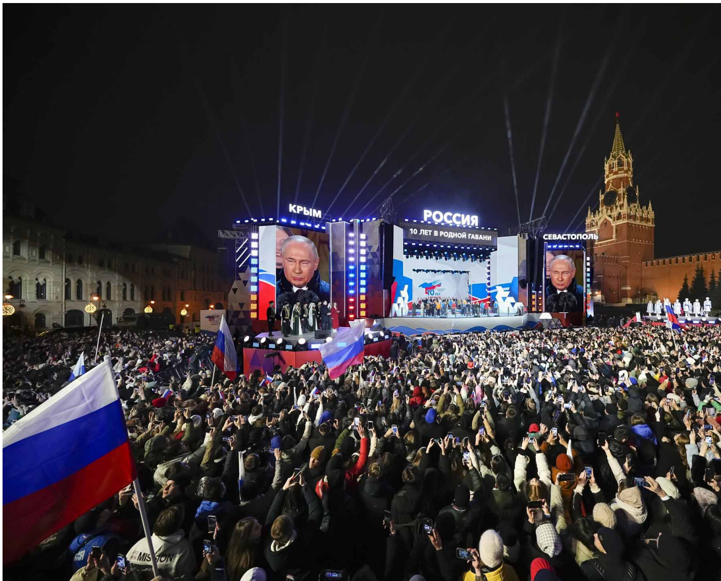
2024年3月18日，俄罗斯莫斯科，俄罗斯总统普京出席庆祝总统选举中获胜，以及吞并克里米亚十周年的音乐会。