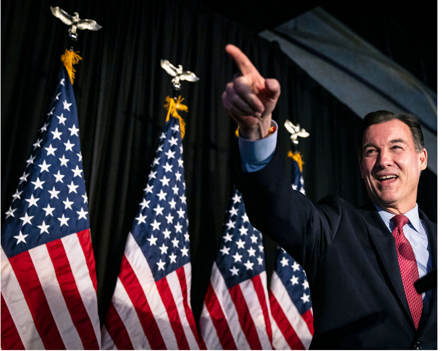
2024年2月13日，纽约第三国会选区的民主党候选人、前众议员苏奥齐（Tom Suozzi）发表讲话。