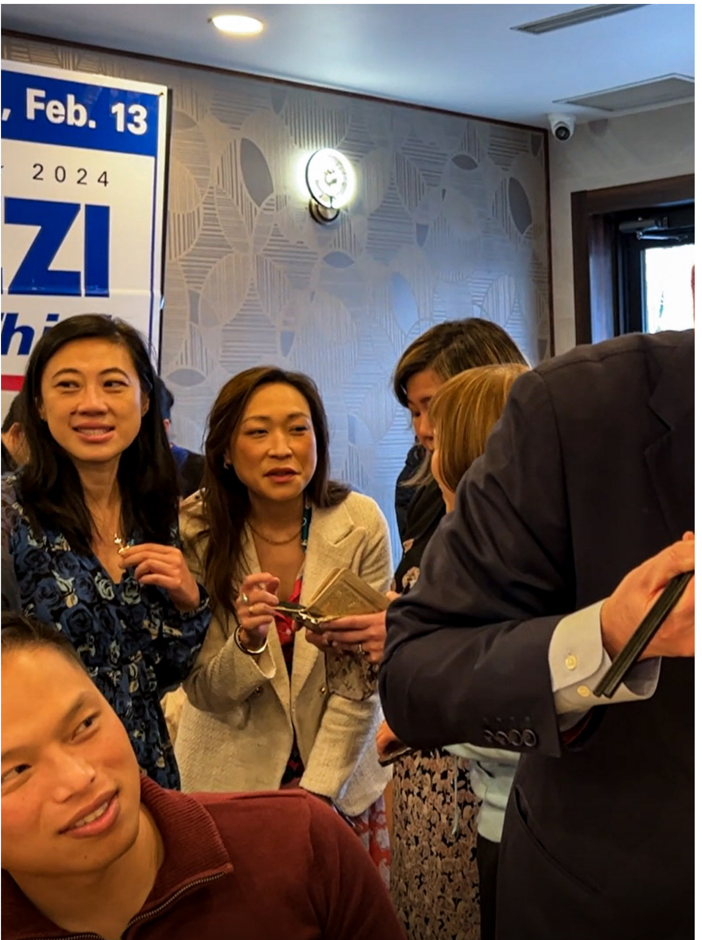
苏奥齐在点心店品尝虾饺，会见华人选民。图：读者提供

让苏奥齐特地来中餐馆拉票的，是一场异常重要、受到全美国的关注、也被誉为“大选晴雨表”的特殊国会选举。纽约第三国会选区，大部分地段都处郊区，为“摇摆选区”，因此，它既切实反映了普通民众如何看待南部边境危机、公共治安、以哈战争等当下攸关美国政治的问题，成为了一次两党民意测验的风向标，也对于两党在今年的总统大选及国会选举中应采取何种手段，有著相当的参考意义。