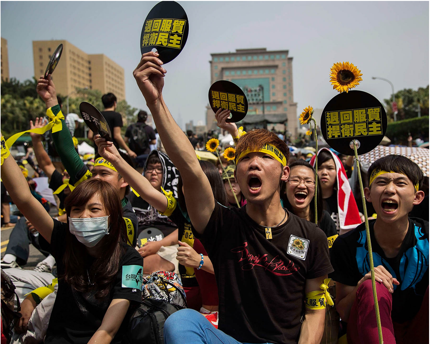
2014年3月30日，台北，占领立法院的学生举行集会，示威者高喊口号。

如今在距离太阳花既不远也不近的十周年，记忆这场运动最好的方式，也许已不再仅是谈论它的历史定位与成就。