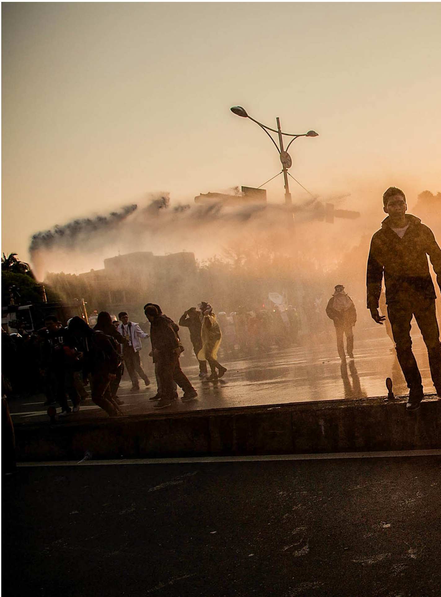
2014年3月24日，台北，防暴警察在行政院外与学生示威者发生冲突时使用水炮。

为此，我们必须仔细梳理一番，太阳花精神之“台湾认同”、“民主宪政”、“社经改革”这三大旨趣，是在怎样的具体脉络下汇流成一体、又因怎样的时局变化而面临离散与异化。透过这样的梳理，或许也能较为清楚地看见，这十年历史吊诡的端倪早在当初就已隐然埋下。