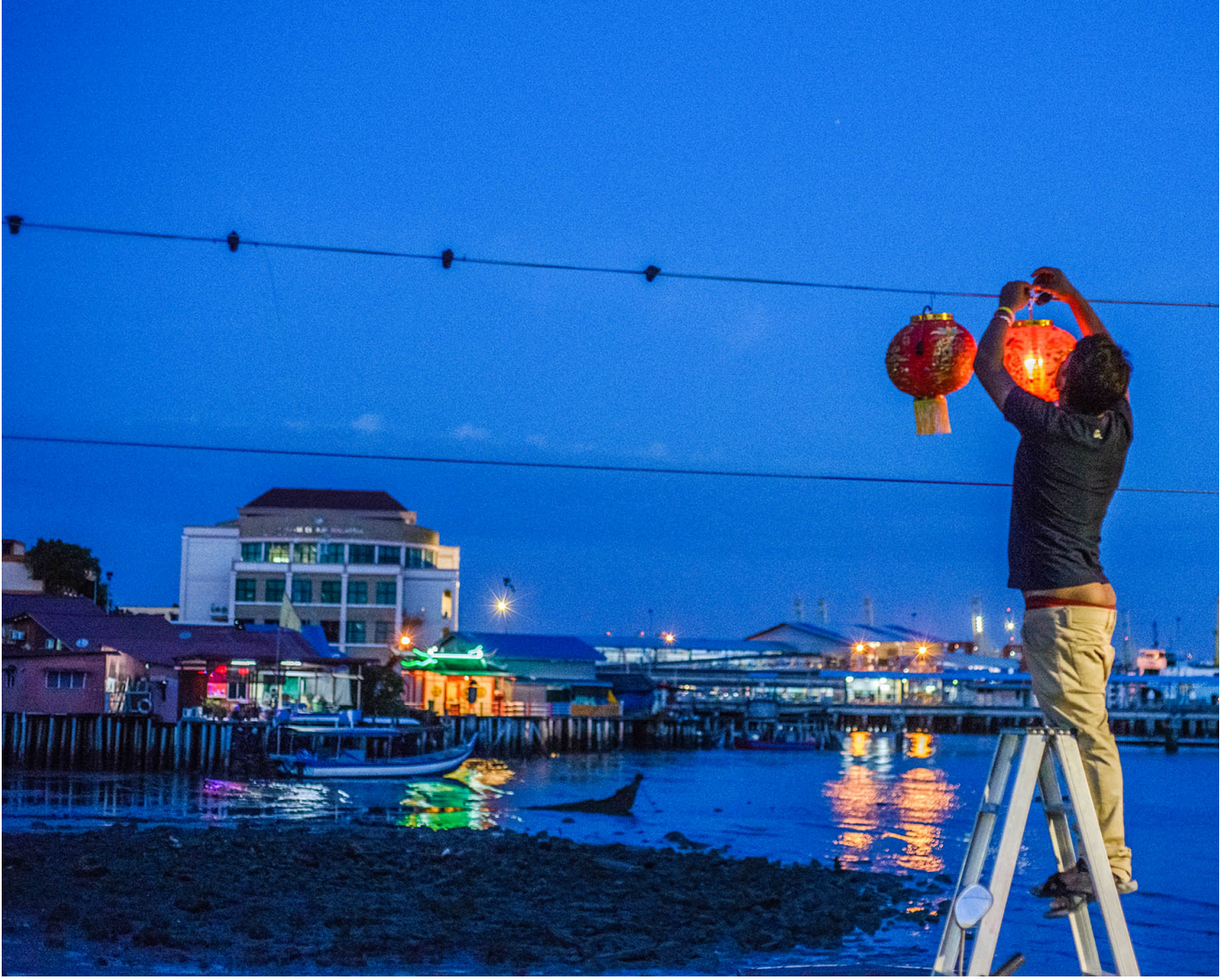
2019年1月23日，马来西亚槟城一个村庄。