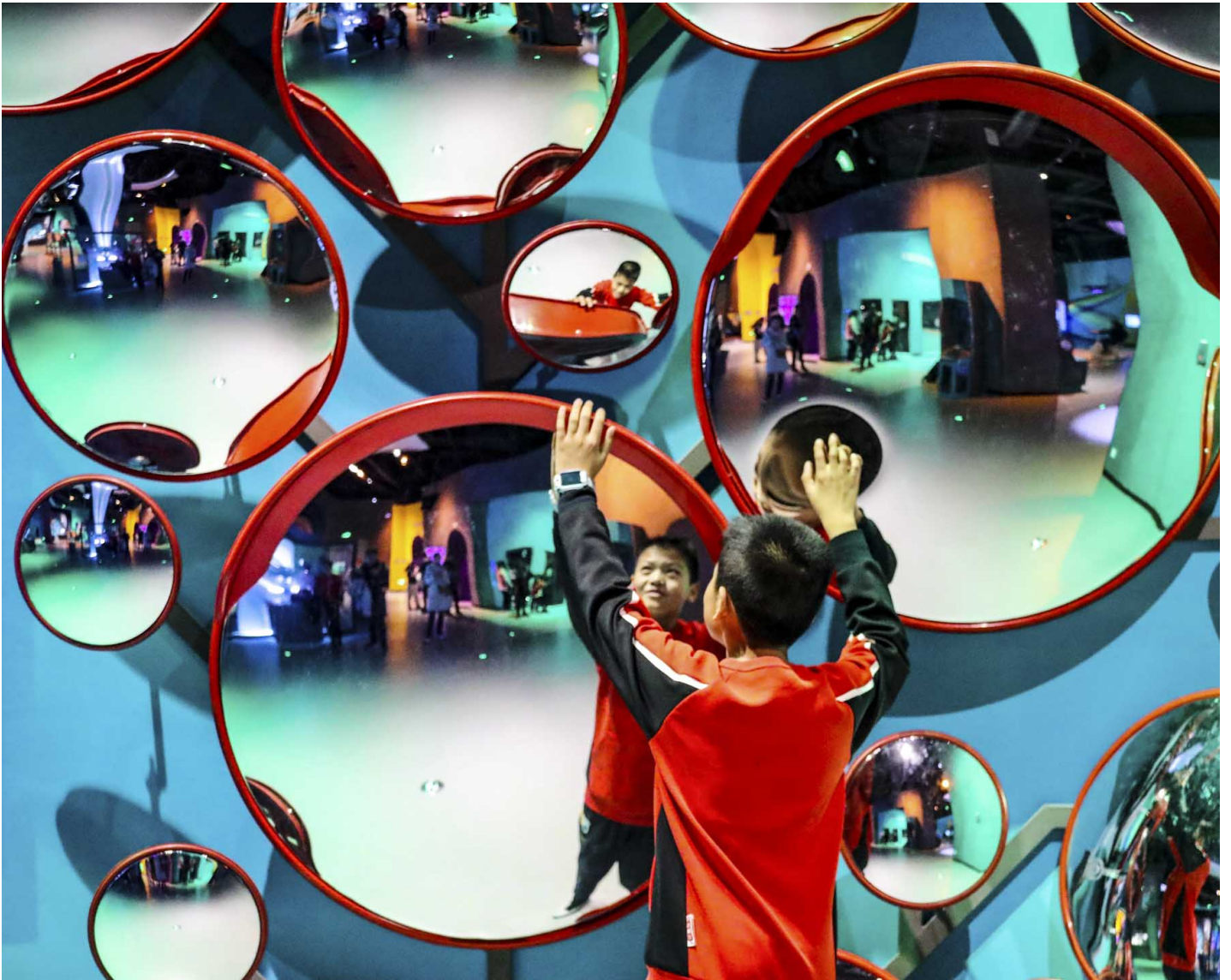
2024年2月14日，中国山东青岛，一个孩子在青岛西海岸科技馆探索“镜子的秘密”。