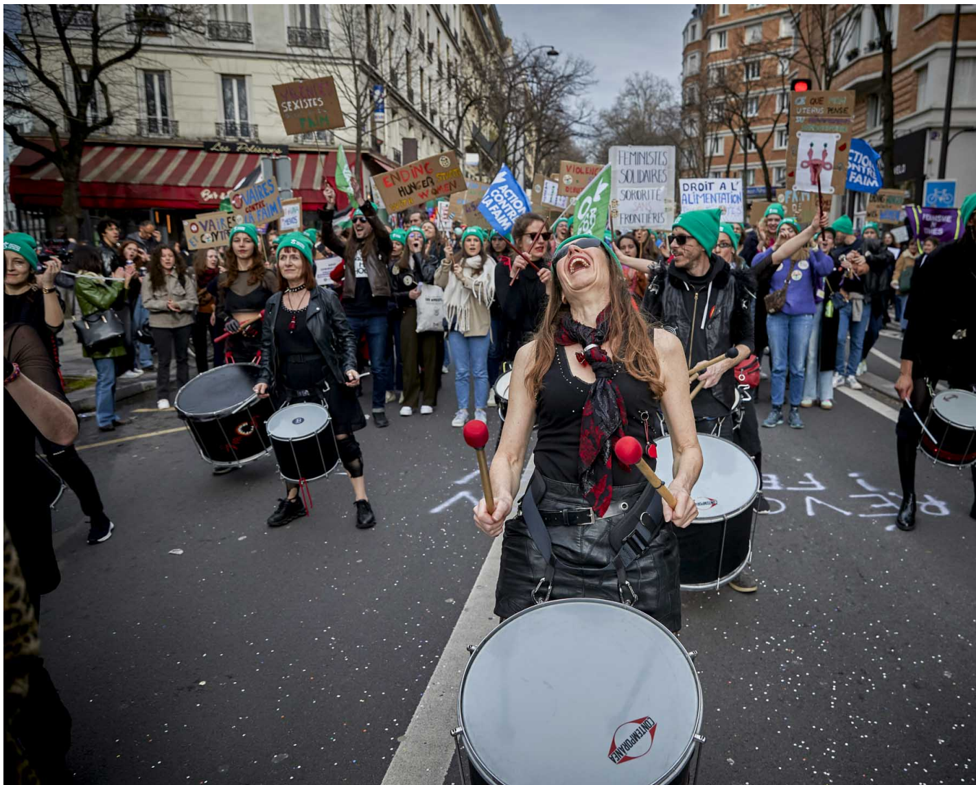
2024年3月8日，法国巴黎，数千人在巴黎市中心游行纪念国际妇女节，呼吁加强性别平等，呼吁女性堕胎权。