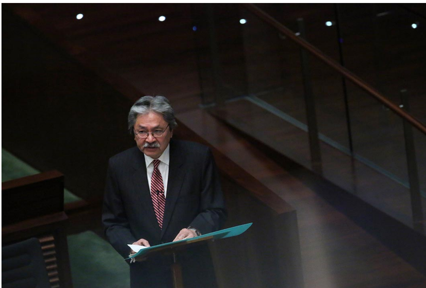
2016年2月24日，香港财政司司长曾俊华宣读财政预算案。

曾俊华指，历任财政司长任内都想尽增加政府收入的方法，但全部都不容易实行。他又指，香港只是一个地方特区，如果与其他国家相比不太适合。他认为如果发债，是用作大型基建投资项目，等待落成后有长期经济回报，则做法并无问题。但若连年发债，用以支付日常开支，导致「债上债」（债上加债），将令库房空虚，影响香港信用评级，各项公共服务“大缩水”，其后果将由下一代承受。