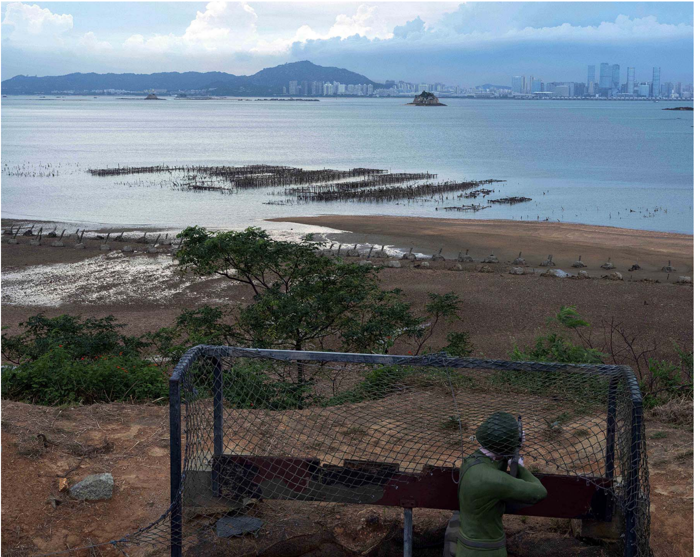
2023年8月25日，金门烈屿，对岸为厦门市。