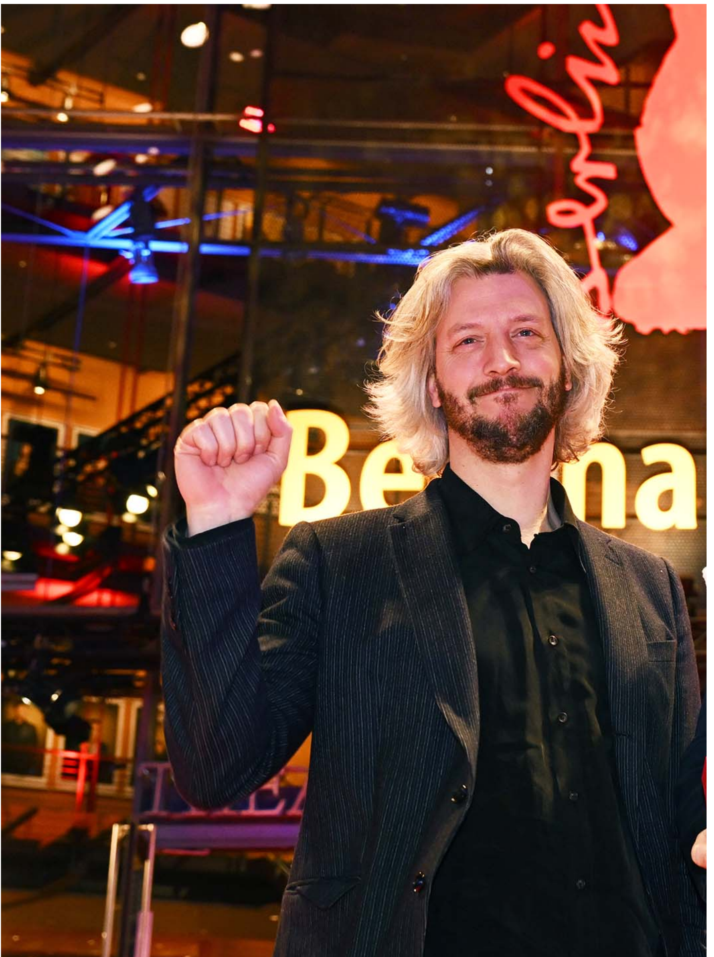
2024年2月24日，德国柏林影展，导演班·罗素（Ben Russell）（右），戴著象征支持巴勒斯坦的围巾（kufiya）走红毯。

而由巴勒斯坦和以色列等四位导演共同拍摄的《No Other Land》，获得柏林影展最佳纪录片与全景单元（Panorama）观众票选奖最佳纪录片。影片记录了巴勒斯坦裔的导演巴塞尔·阿德拉（Basel Adra）在约旦河西岸的家园 Masafer Yatta，经年累月遭受以色列军队破坏而导致人民居无定所、经历不人道对待的定居式殖民过程。