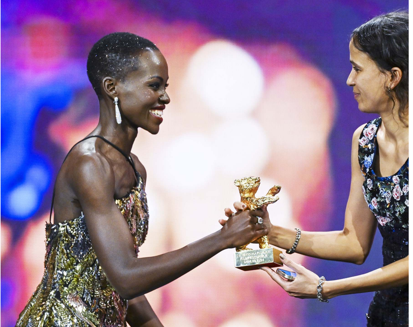
2024年2月24日，德国柏林影展，法籍塞内加尔裔女导演玛蒂·迪欧普（Mati Diop）（右），从评审团主席露琵塔·尼咏欧（Lupita Nyong'o）（左）夺金熊奖。