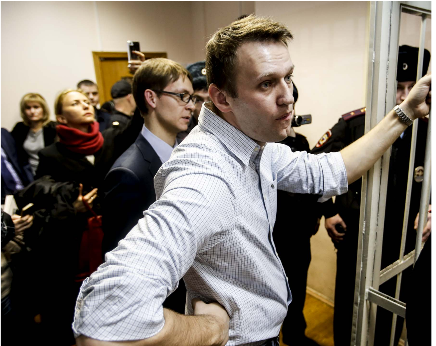
2014年12月30日，俄羅斯反對派領袖納瓦尼 (Alexei Navalny) 站在俄羅斯莫斯科的一家法院。因犯詐欺罪，被判處有期徒刑三年半。

納瓦利內一生最大的成就，就是重新激發俄羅斯民眾對政治的熱情，撼動「犬儒多數」對俄羅斯社會的統攝。