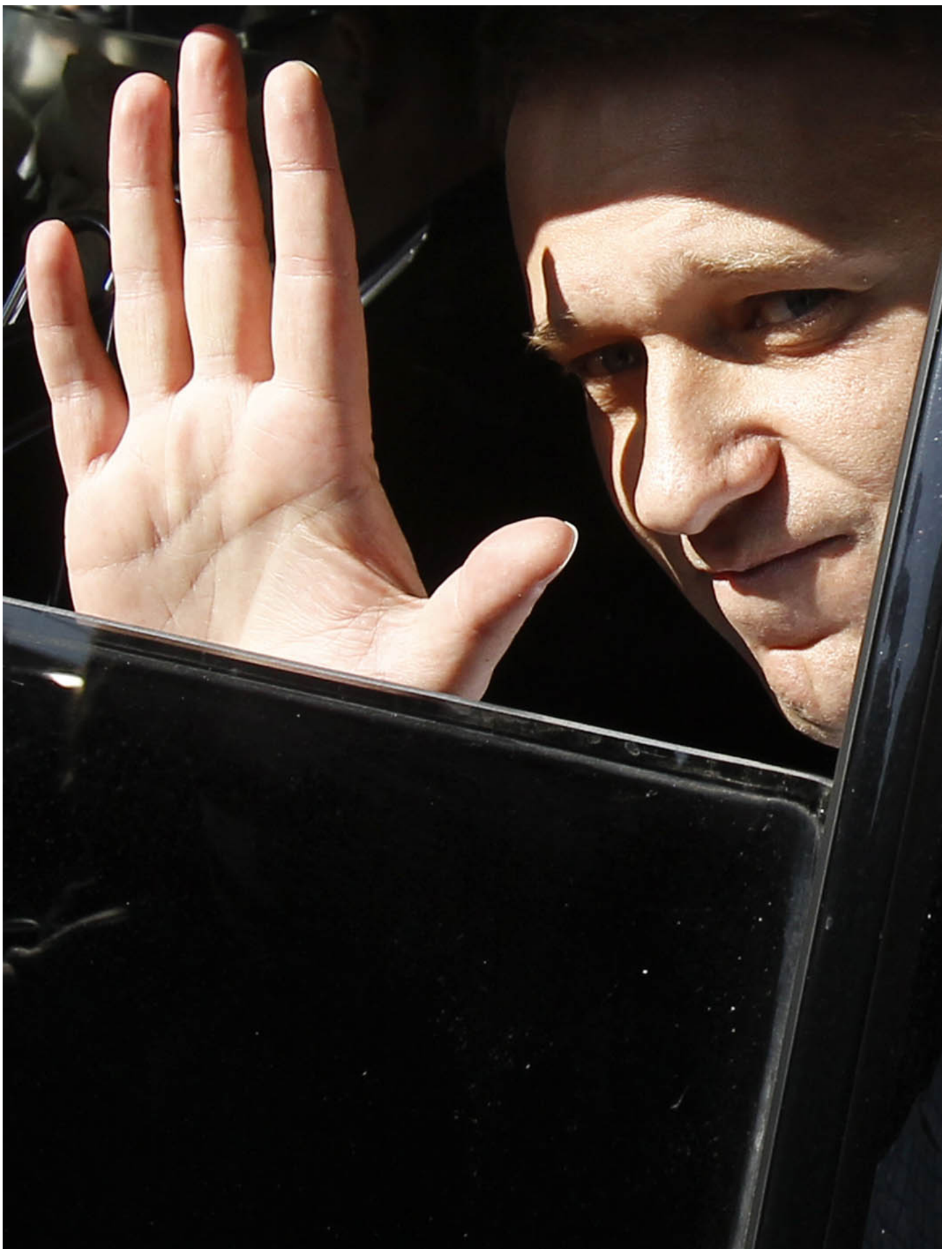
2012年5月24日，俄羅斯反對派領袖納瓦尼(Alexei Navalny) 從莫斯科警察局獲釋後，在車內向支持者致意。

2011年12月5日，納瓦利內舉行了第一次抗議選舉舞弊的集會，登場發表了他載入史冊的演講。他的講話慷慨激昂，甚至可以說極具煽動性。他不斷使用「不遺忘，不原諒」、「我為人人，人人為我」、「普京是賊」等口號與民眾互動，他憤怒地喊道：「他們說我們是網絡倉鼠，是的，我就是網絡倉鼠，而我要咬斷所有那些畜生的喉嚨！」這樣的演講對於以老知識分子為主的俄羅斯傳統自由派而言可謂聞所未聞，甚至在沒有公共政治傳統的俄羅斯也屬新鮮事。許多不適應納氏風格的自由派稱之為「元首式的演講」，但正是他改變了傳統意義上的俄羅斯抗議集會的面貌——兩三百個知識分子在莫斯科市中心輕呼一些不痛不癢的關於民主、自由重要性的口號，與其說是抗議，更像是在哀嘆、抱怨自己的理想不為愚民理解。而納瓦利內的橫空出世恰好打破了老自由派的自戀和哀傷形象。