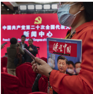
媒體「公關化」：經營困境下十年轉型，政府成最大買單者