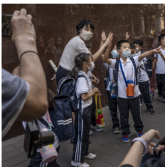
從園丁到保姆：權力關係逆轉，小學老師在投訴和考評中夾縫求生