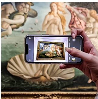
裸體即政治：論香港懲教署禁書事件