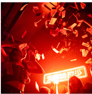
早熟的、千瘡百孔的、被物化的小女孩們 | 女性主義的具體生活