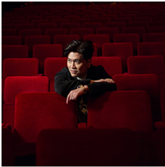
《飯戲攻心 2》導演陳詠燊：如何在香港悲觀時代拍一部賀歲片