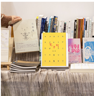
台北國際書展2024：香港獨立出版群像闊別五年再渡海；大獎名單三分一港人作品