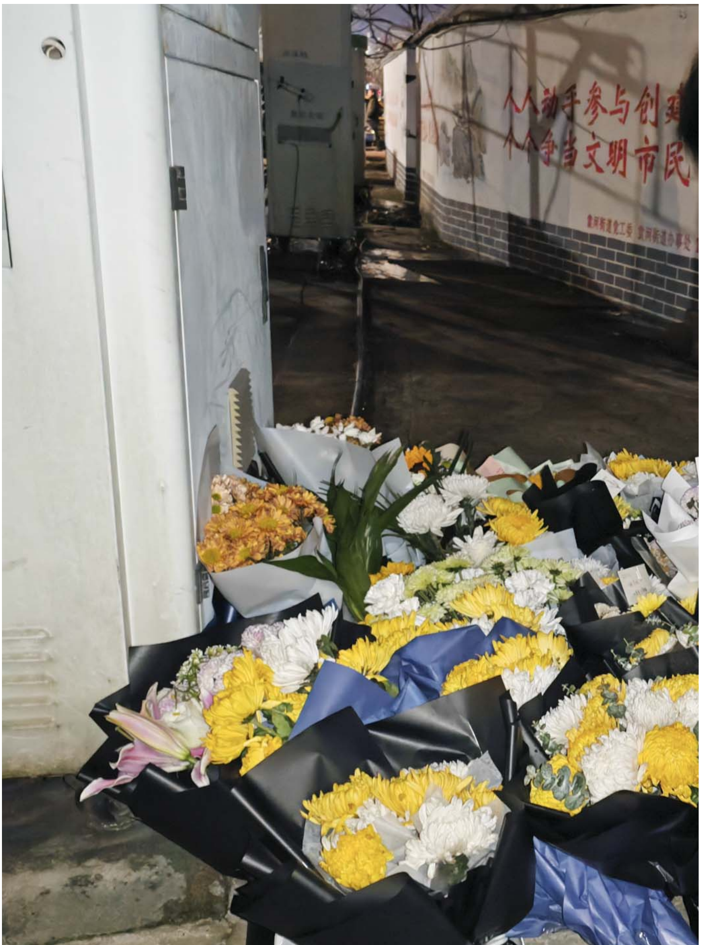
2024年1月25日，中国江西新余市一场大火导致39人死亡后，一名男子在火灾现场附近鞠躬哀悼罹难者。

在上述事故中，南京火灾事故无疑引起关注。据通报，2月23日凌晨4时39分，江苏南京市消防救援支队指挥中心接到报警：雨花台区明尚西苑6栋发生火灾。经初步分析，火灾为6栋建筑地面架空层停放电动自行车处起火引发，具体原因正在进一步调查。