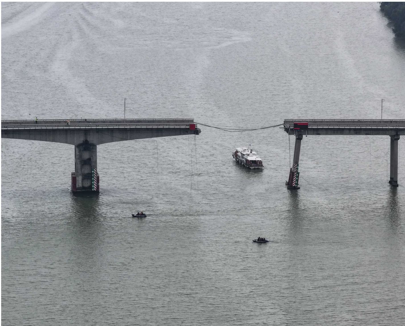
2024年2月22日，中国广州南沙，救援人员在沥心沙大桥断层现场工作。