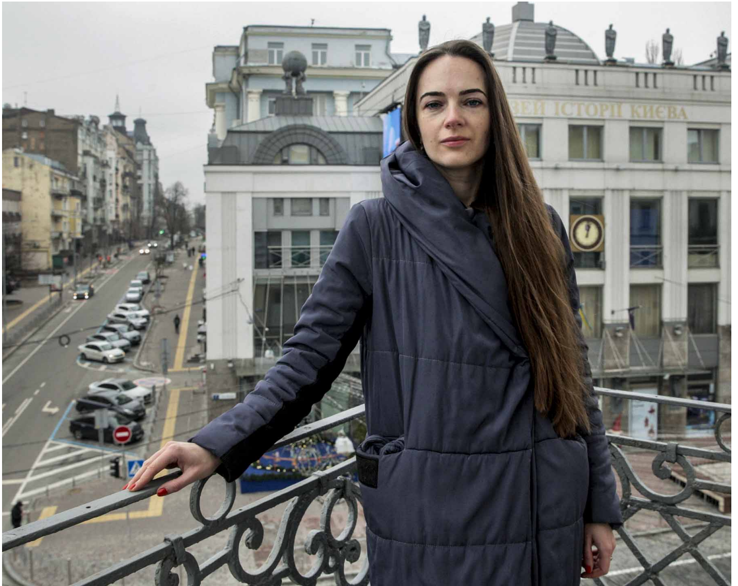
2022年12月26日，乌克兰基辅，诺贝尔和平奖得主马特维丘克。