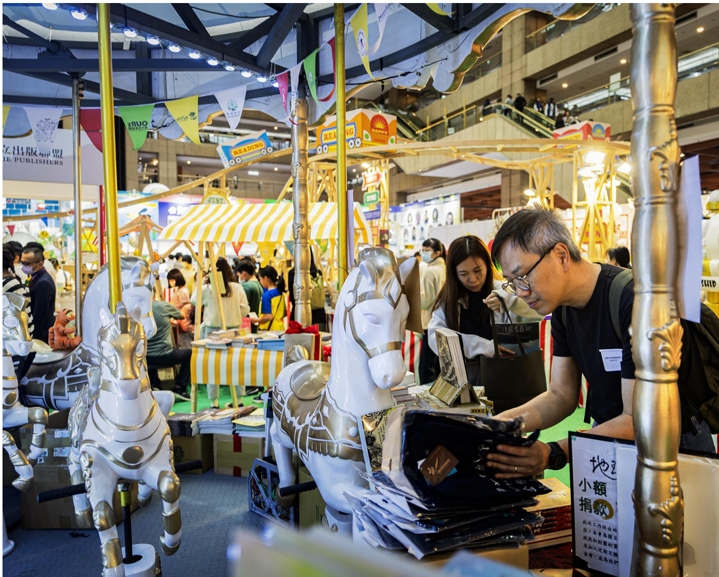
2024年2月21日，第17届台北国际书展。