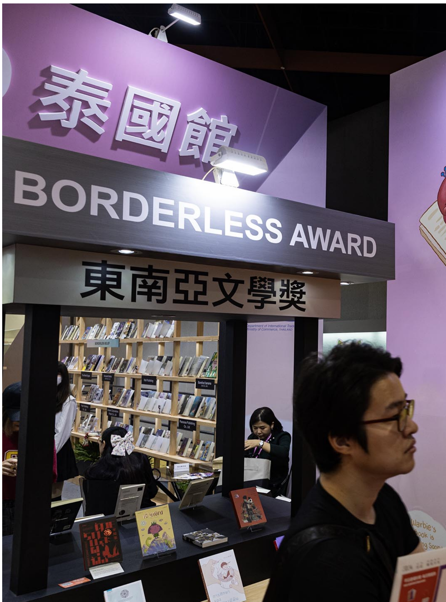
2024年2月21日，第17届台北国际书展。