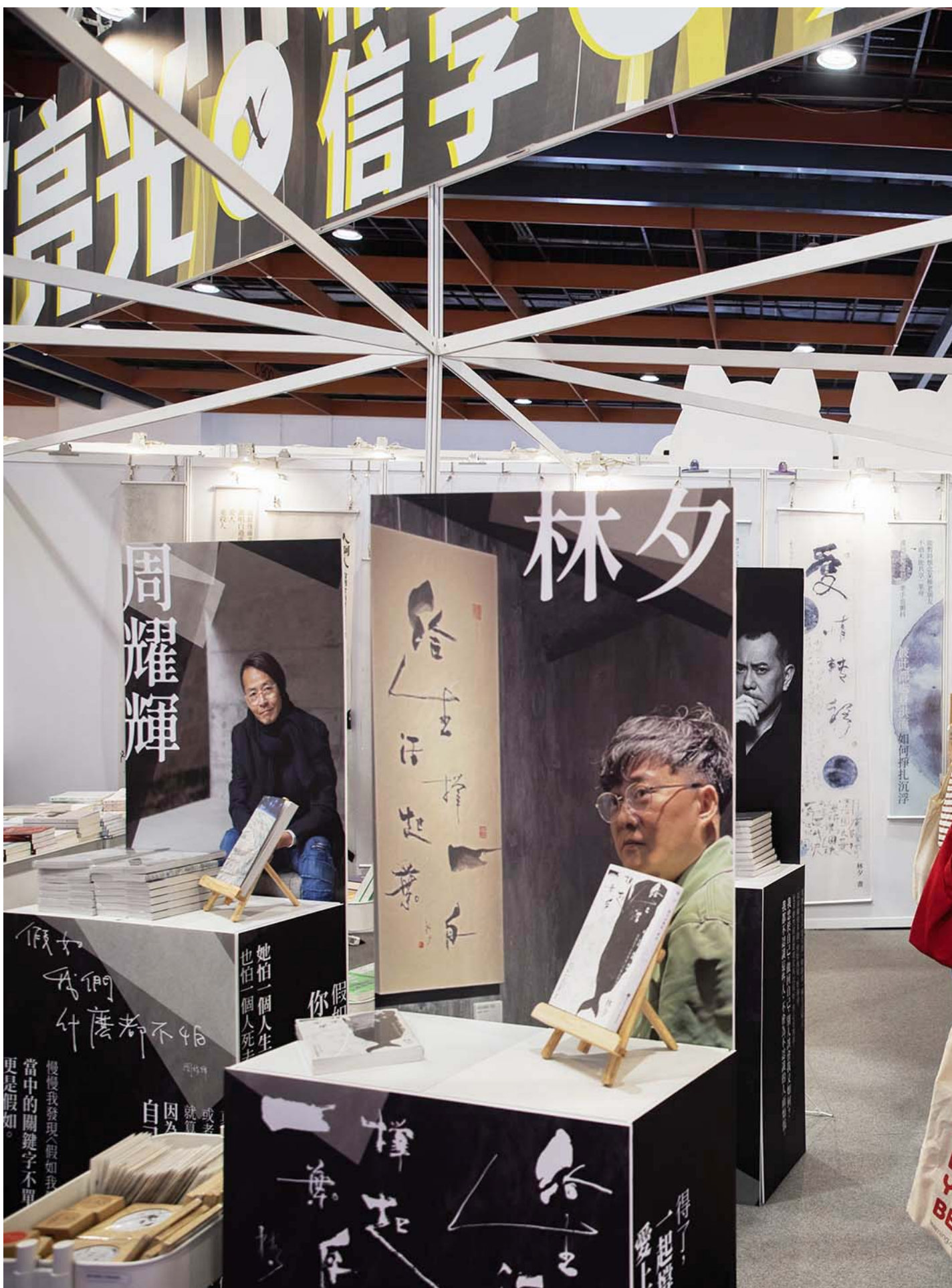
2024年2月22日，第17届台北国际书展。