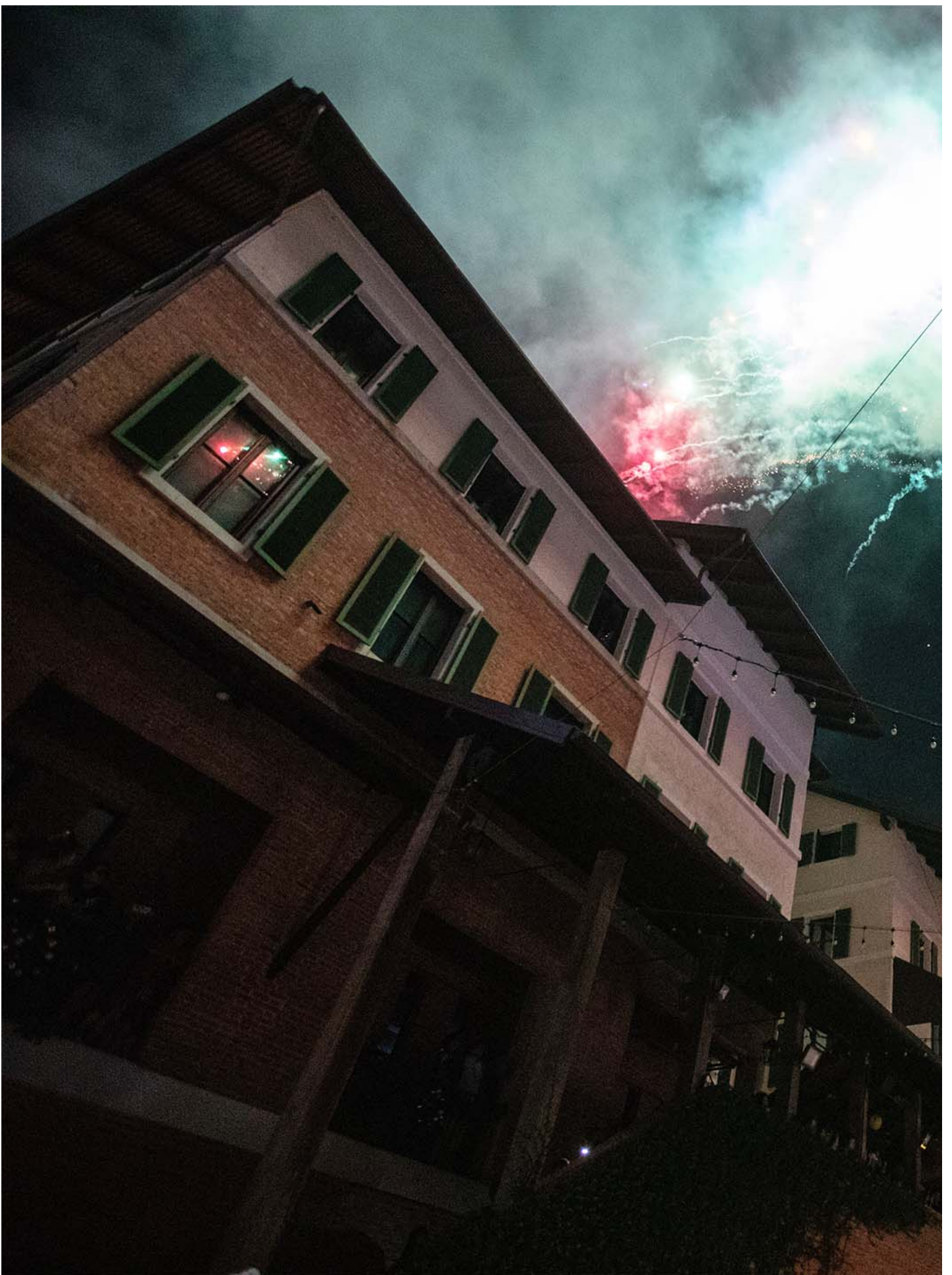
2024年1月1日，泰国清迈，宁曼区钟楼上燃放烟火，庆祝2024年新年。