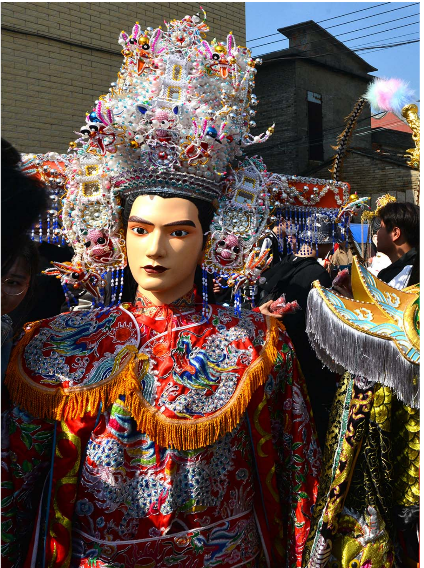
2024年2月15日，福建省福州，当地人抬着神像在街上游行，祈求风调雨顺国泰民安，图为“赵世子”神祇。

而“赵世子”在近日也引发了一场风波：在近日的“世子出巡”的游神现场，一位男性网红 cosplay 成“赵世子”的样子，和“世子”同游并直播，引起网上“赵世子”拥趸的不满。