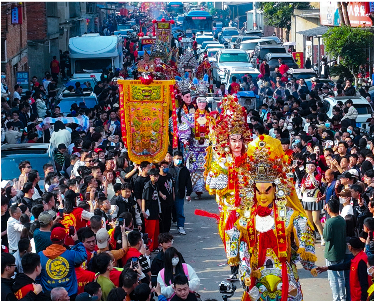
2024年2月15日，福建省福州，当地人抬著神像在街上游行，祈求风调雨顺国泰民安。

福州等地的近年来受年轻人追捧的“游神复兴”或许受到了台湾宫庙文化和产业的“反哺”影响。