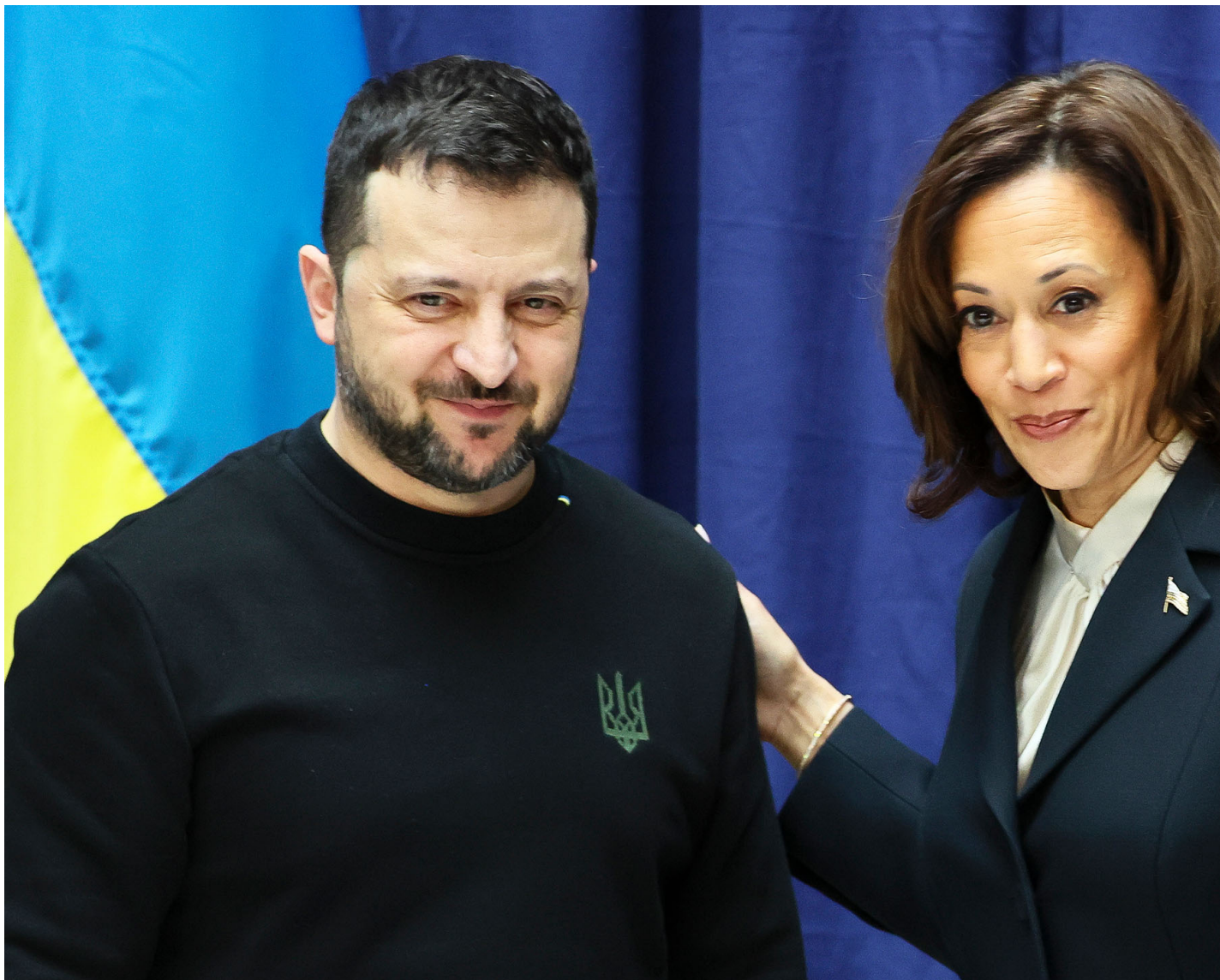
2024年2月17日，德国慕尼黑安全会议上，乌克兰总统泽连斯基（左）与美国副总统哈里斯（右）出席记者会合照。

本届慕安会的主题是“双输？”——指世界各国政府越来越关注自身的相对收益和损失，从而陷入零和博弈的恶性循环。