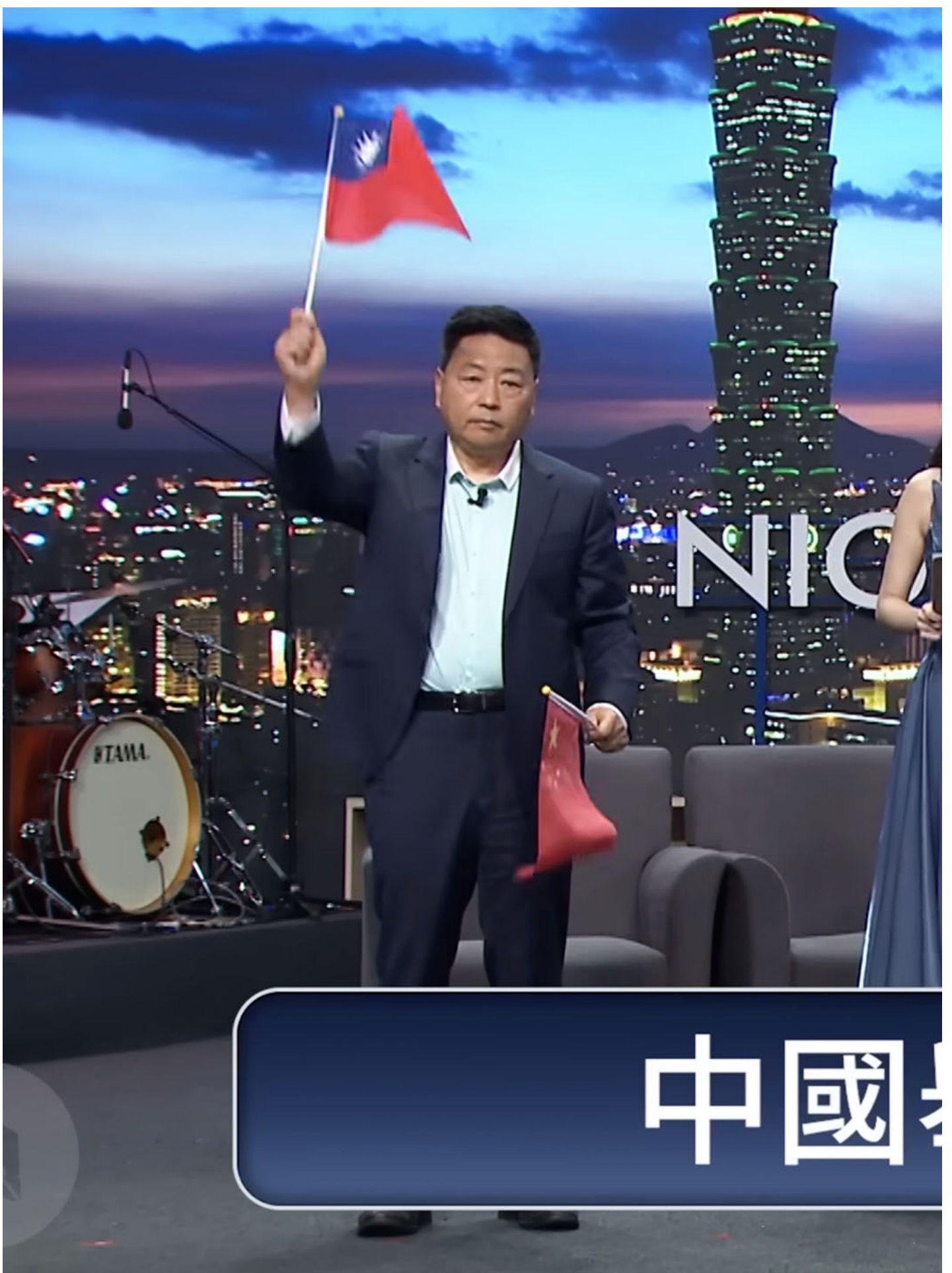
2024年1月22日，台湾网路脱口秀节目“贺珑夜夜秀”。