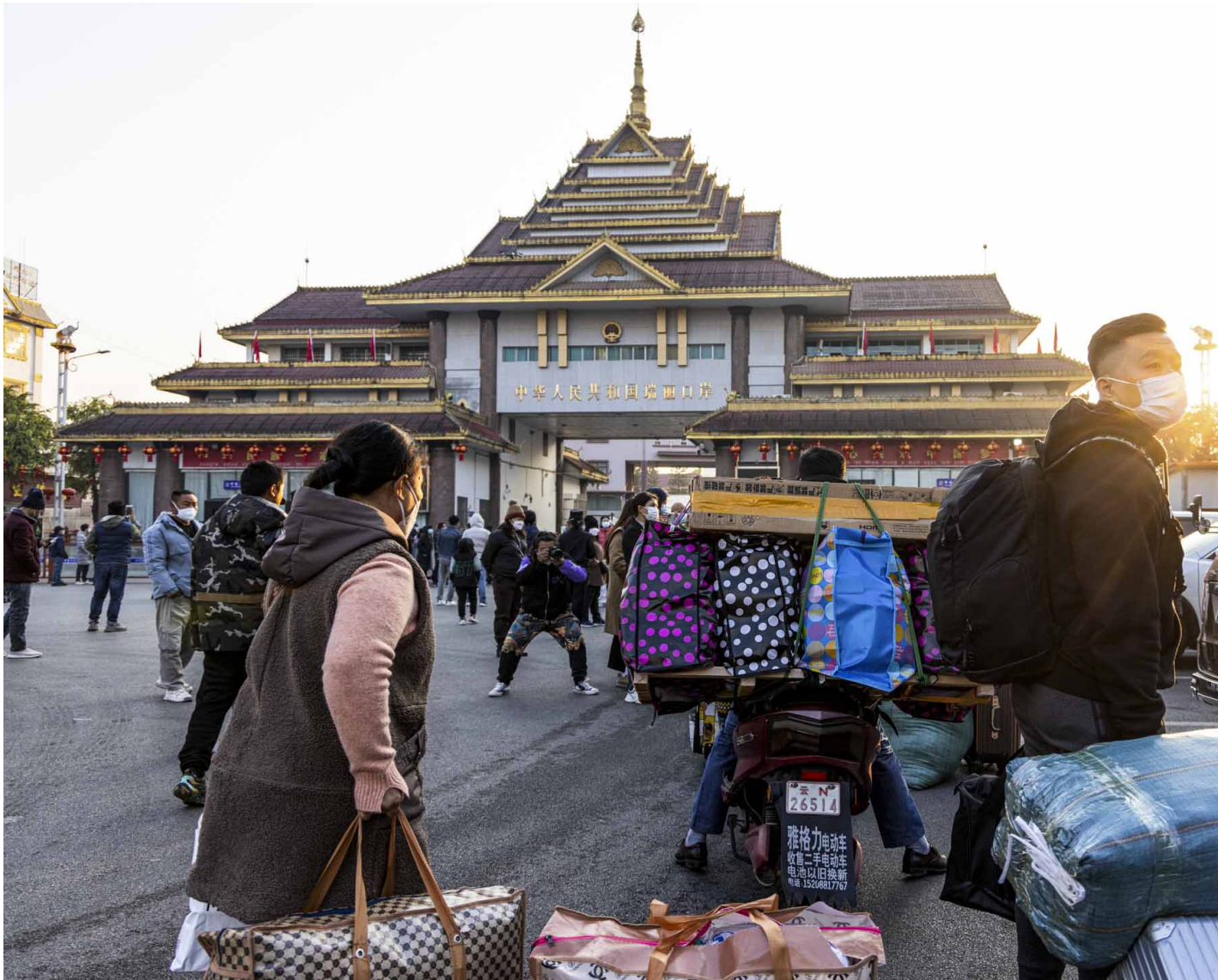
2023年1月8日，中国云南瑞丽市取消对国际入境旅客的检疫要求，旅客们带着行李在中国和缅甸之间的瑞丽口岸行走。

对缅甸人来说，内战正在走向转折点，而边境商人的生意经是：和平有和平的玩法，战争有独属于战争的规则。