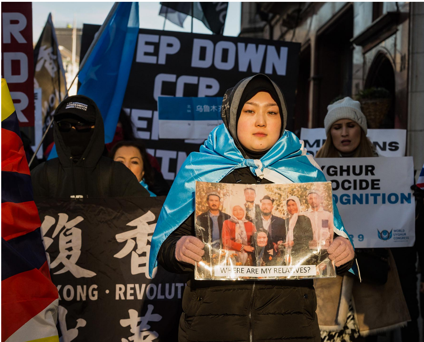
2022年12月10日，英国伦敦，香港人、藏人、维吾尔穆斯林及其支持者在市中心游行反对中国政府，一名示威者手持维吾尔亲属的照片。

会前中方被指大量游说发展中国家对其表达赞扬；中国代表强调人权“非政治化”，走“符合中国国情的人权道路”。