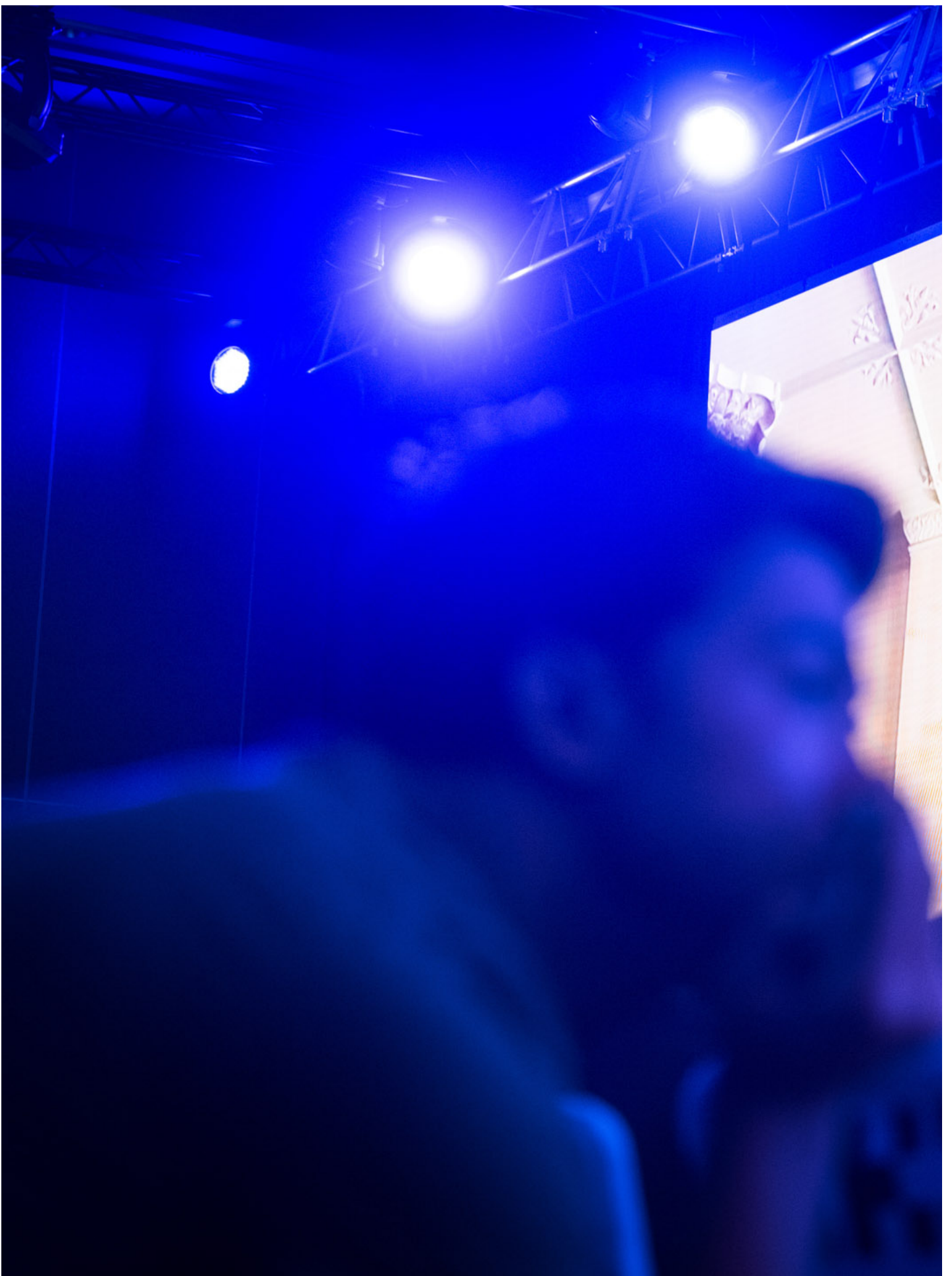
2023年9月14日，新加坡，OpenAI 执行长 Sam Altman 在 Token2049 会议上发表演讲。