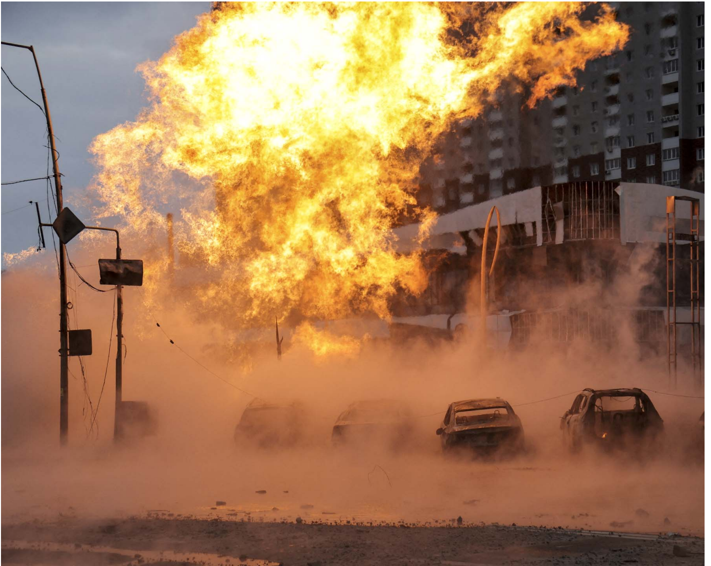
2024年1月2日，乌克兰基辅被俄罗斯飞弹袭击后发生火灾。

俄罗斯很可能改变了空袭战术：从去年冬季破坏乌克兰的能源基础设施到如今主要瞄准军工企业。