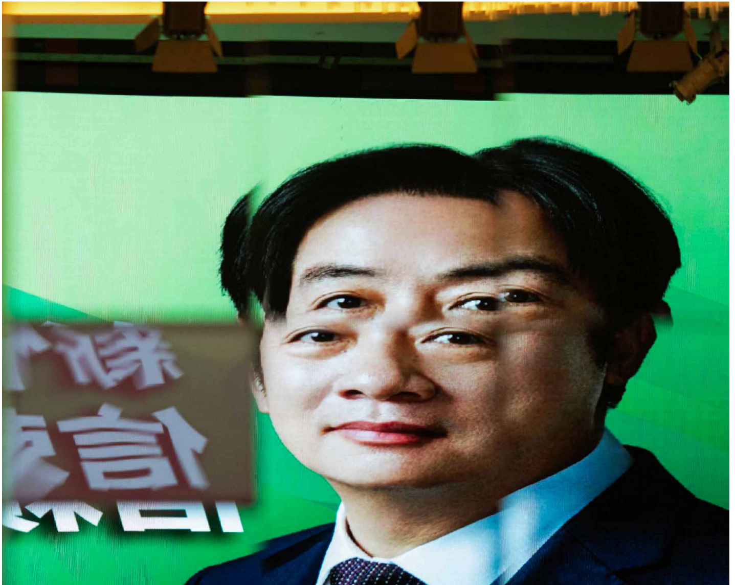
2023年5月27日，新竹，民进党2024总统大选参选人赖清德出席新竹市信赖台湾之友会成立大会。