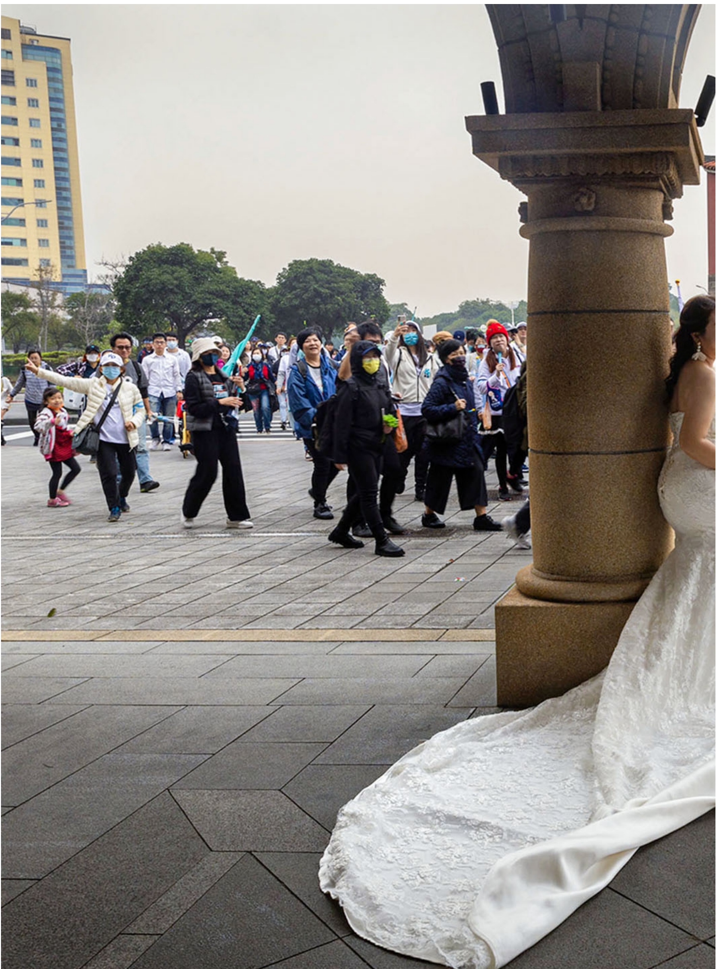
2023年12月31日，台北，民众党的造势游行期间，一名女生在拍婚纱照。