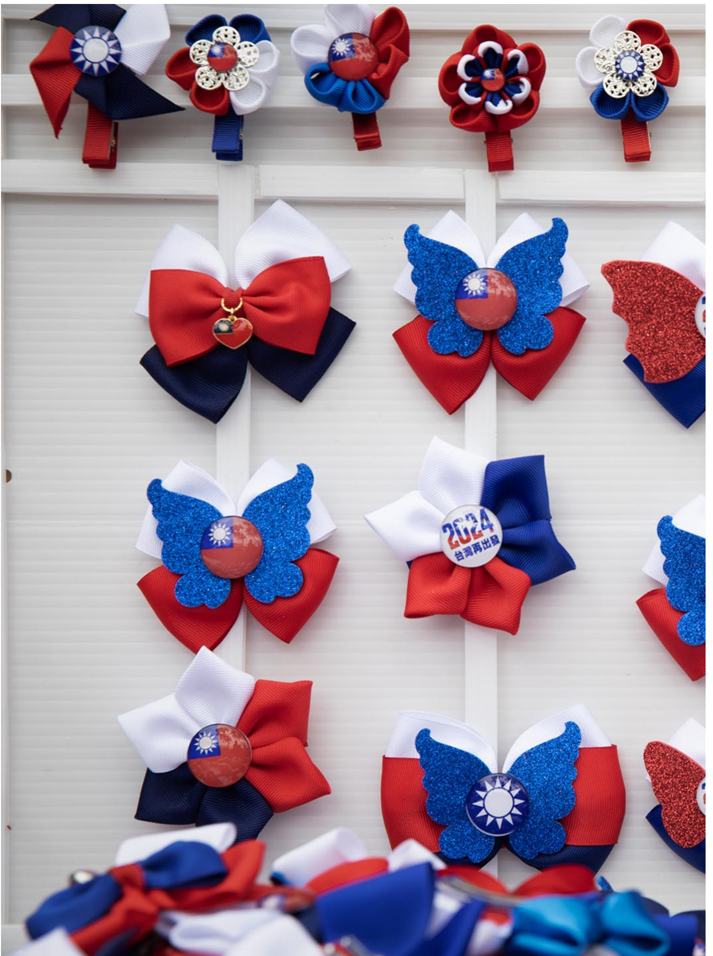
2023年11月12日，新竹，国民党总统参选人侯友宜出席党籍新竹市立委参选人郑正铃竞选成立大会，摊贩出售国民党的纪念品。