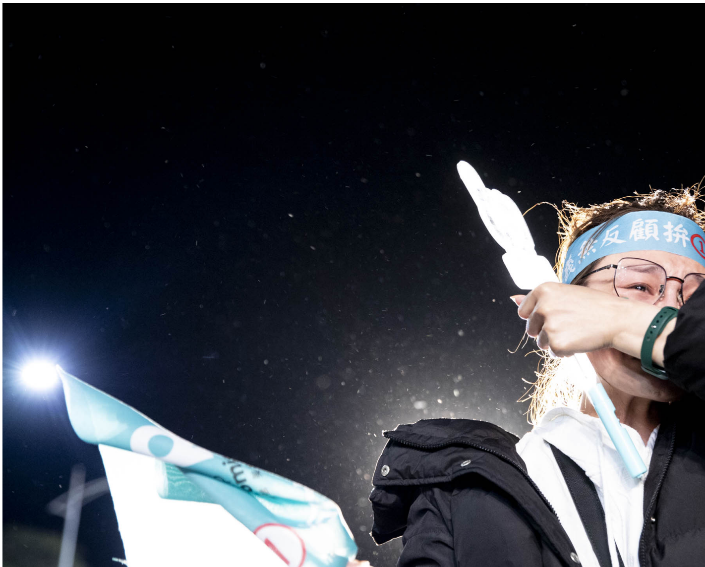
2024年1月13日，台湾大选开票，柯文哲竞选总部开票现场。

端传媒在这晚派出三组记者采访了三处现场和支持民众，记录三处现场不断改变著的气氛和打气语言。