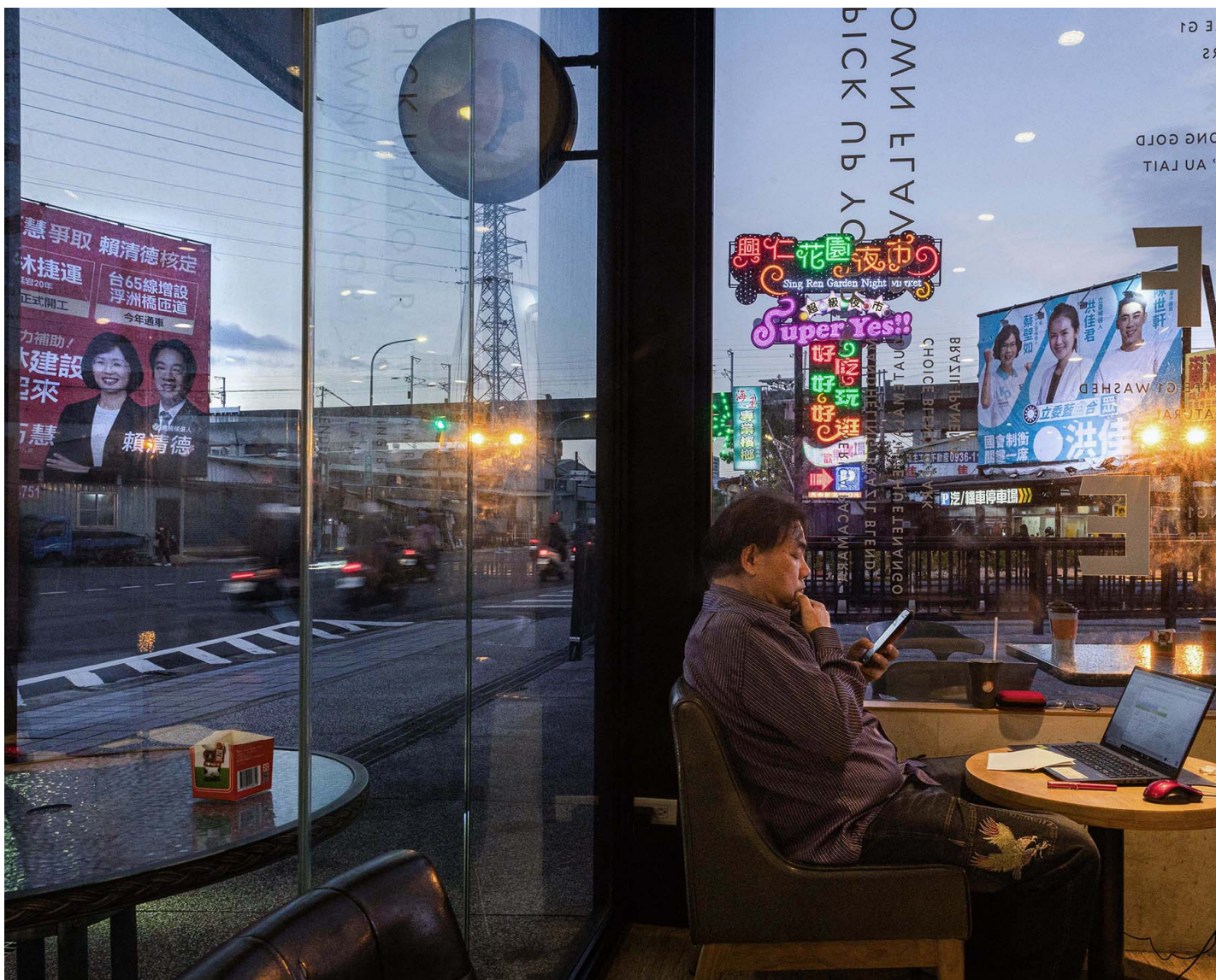
2023年12月16日，树林，一名顾客在咖啡店看手机。