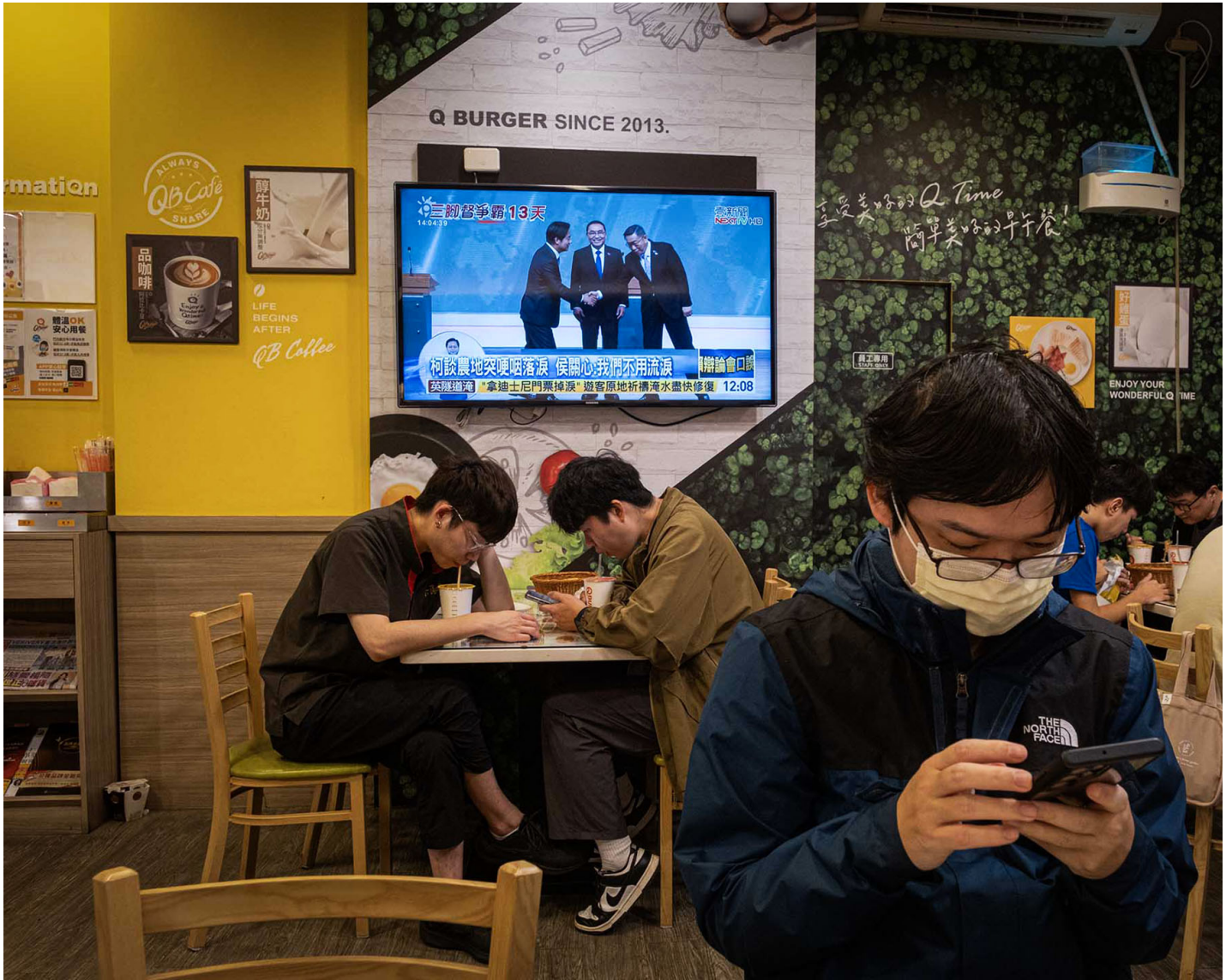
2023年12月31日，板橋，食肆的電視上播放總統候選人電視辯論會的新聞，客人在看手機。