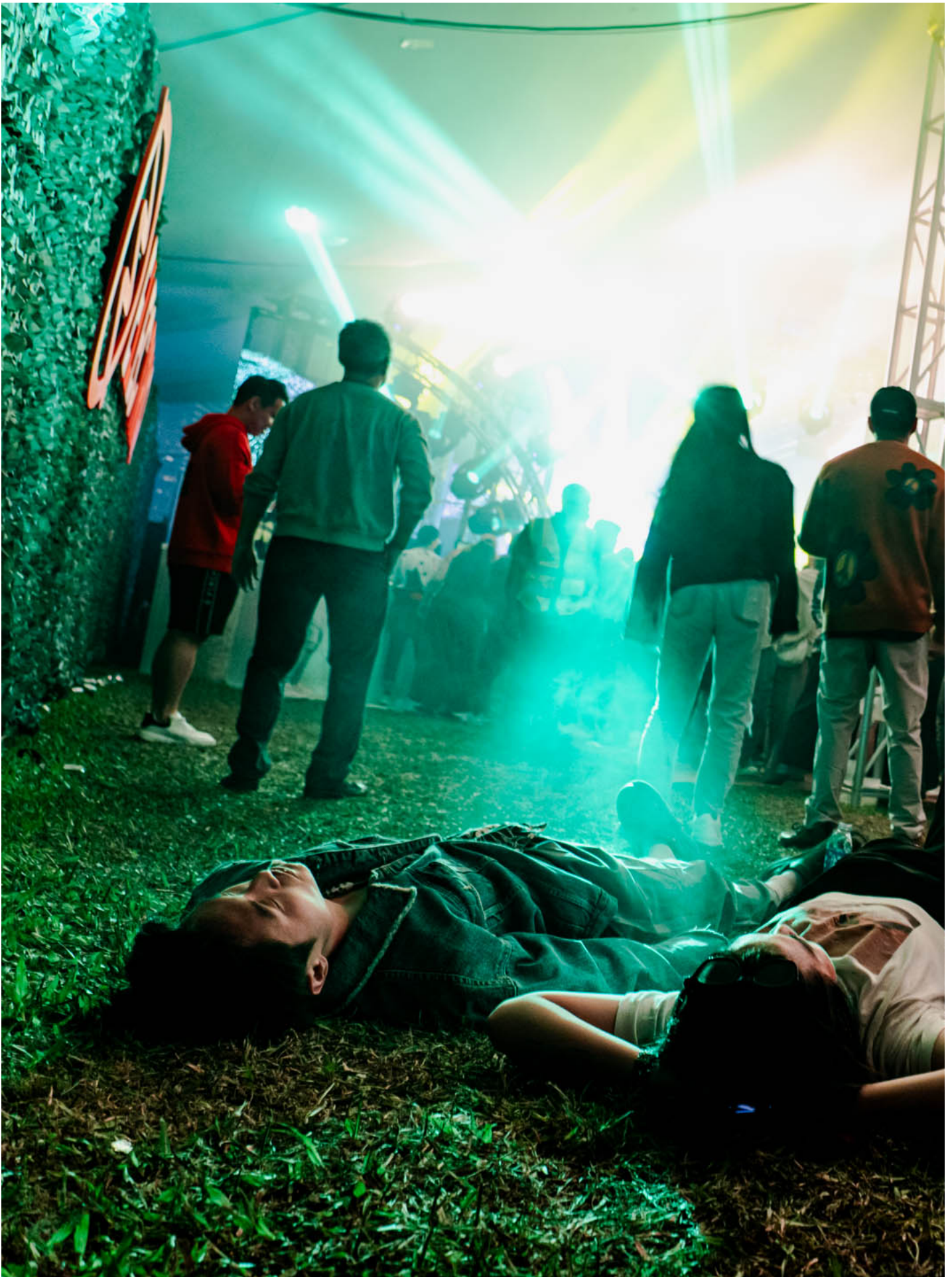
2023年12月3日，香港，觀眾在Clockenflap音樂節躺在草地上享受音樂。

但反觀在多方面被視為香港競爭對手的新加坡，沒錯過去曾有過來自澳洲的Laneway Festival以及Neon Lights Festival這兩個國際性音樂節，但兩者皆已停辦多年，即使疫情結束也未見復辦。