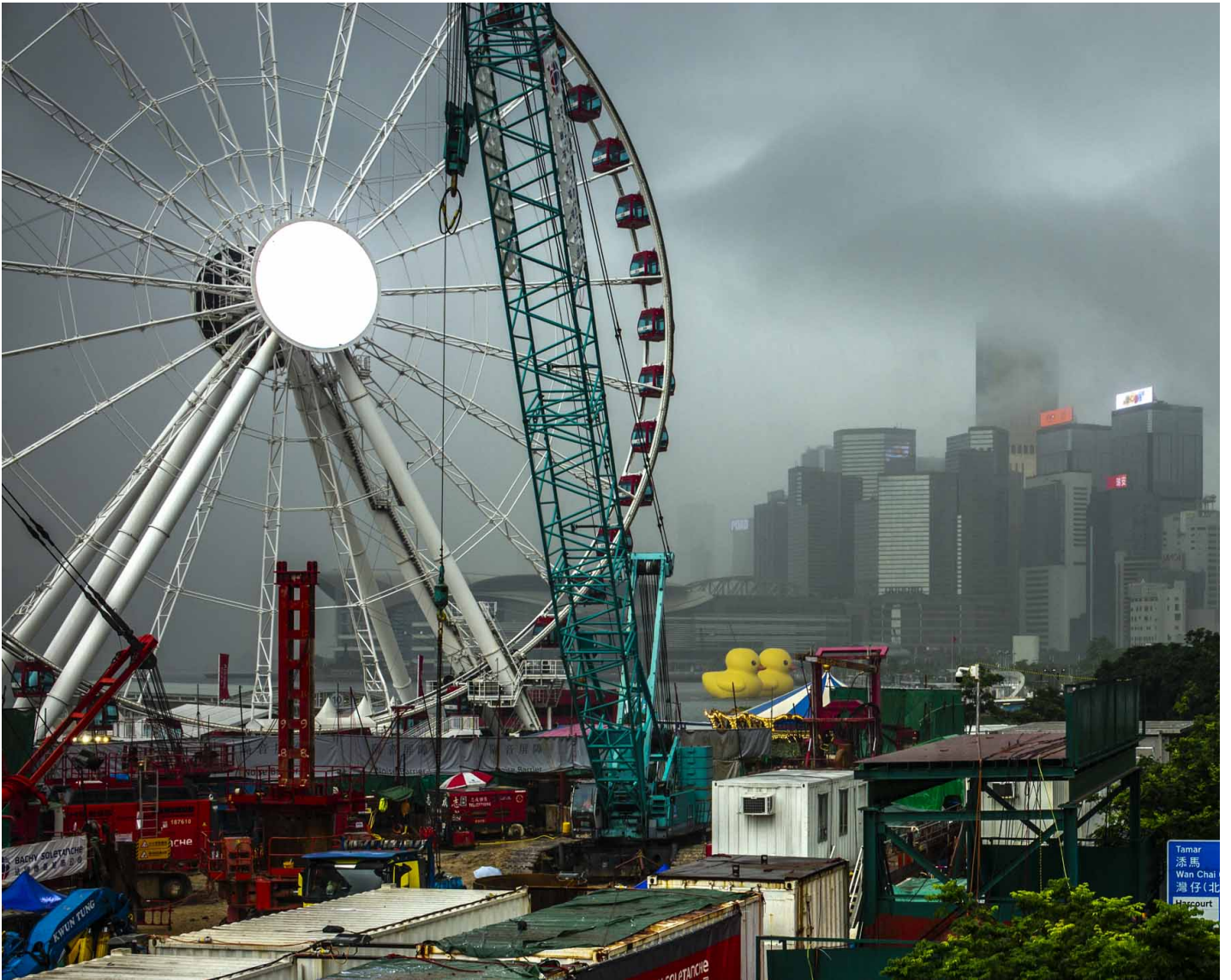
2023年6月16日，维港天色昏暗，两只巨型吹气黄鸭在金钟。