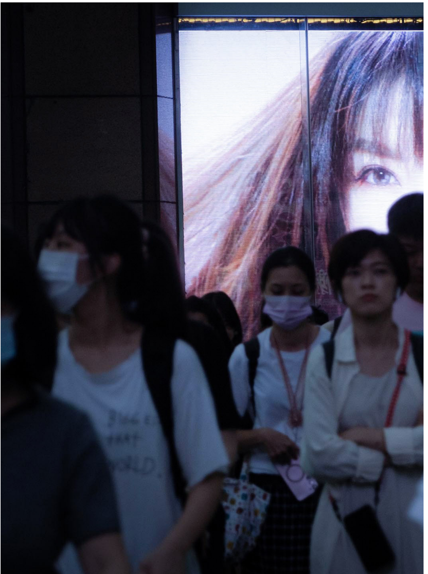
2023年6月9日，台北，行人在广告萤幕前走过马路。

或许没人想过，2023年台湾一部结合选举和#MeToo题材的电视剧《人选之人》，播出不久便在现实中刮起飓风——今年的六四纪念，台湾政圈、文化圈、传媒圈、娱乐圈、中国民运圈等相继爆发#MeToo，光是曝光事件，就用了接近一个月。罪恶从不见光的角落涌出，控诉者也从女性扩大到男性和LGBTQ群体，台湾司法机构在7月底紧急修改“性平三法”，但法律修补不到的文化改造，是台湾公民社会不愿放弃的动能。