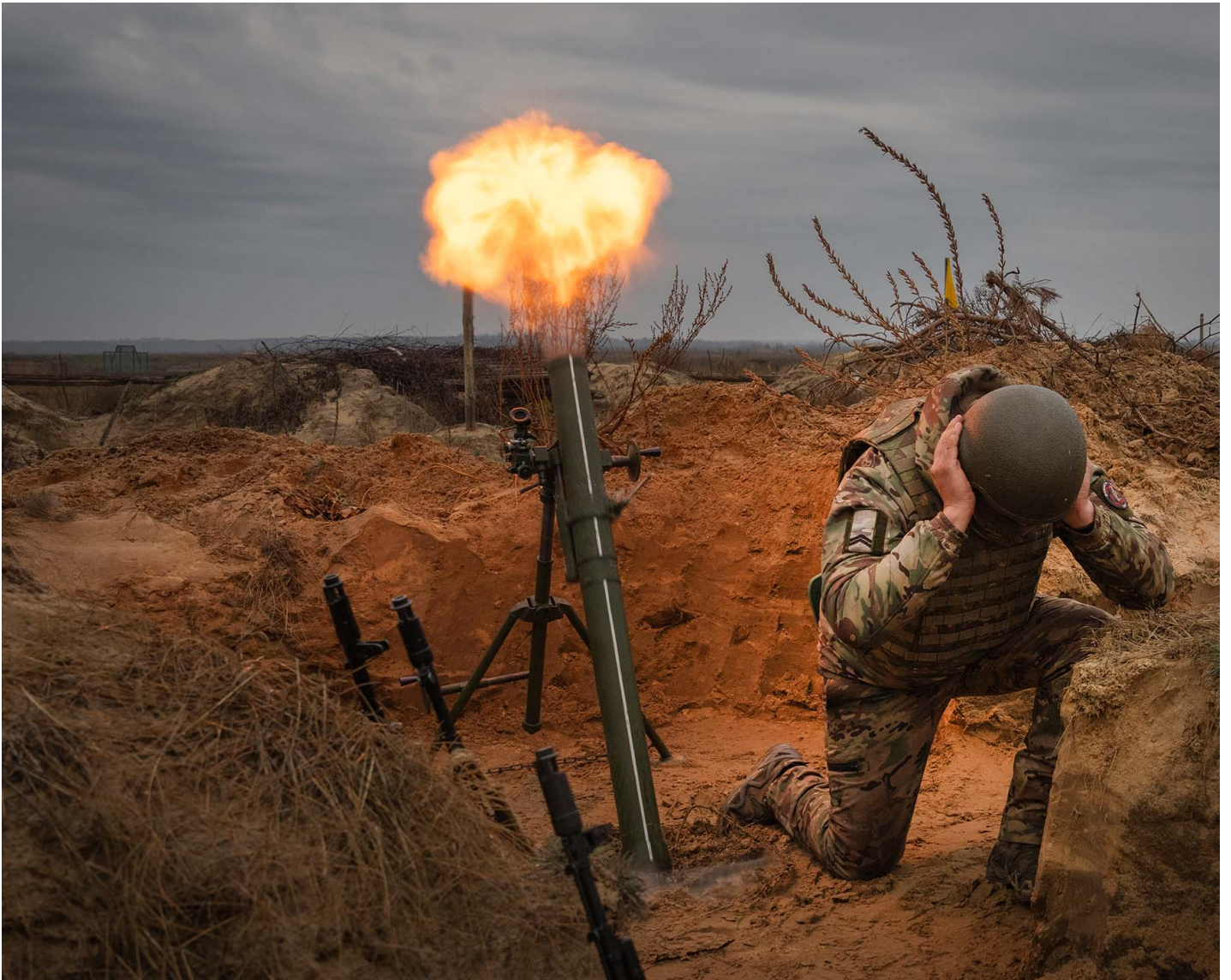
2023年11月8日，乌克兰士兵正在进行军事训练。

有美国官员警告称在最坏情况下乌军会在夏天前溃败。一旦类似情况发生，将会引发一系列灾难性的连锁反应。