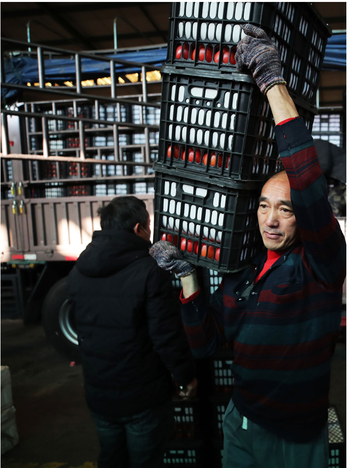
2023年12月20日，中国上海，工人在蔬菜批发市场运送货物。

正是因为害怕这样充满压力又没有安全感的境况，准备进入劳动市场的打工人对稳定的工作越发执着起来，很多大学生把就业目标转向“铁饭碗”，考上编制才算解脱，因此参加中国国家公务员考试的人数每年都在攀升，2024年更是首次突破300万，平均约77人竞争一个岗位。如此激烈的竞争让人饱受压力，因为太害怕失去了。即使闯过独木桥考上编制，也不一定能匹配到跟自己的兴趣、能力相一致的岗位，这样下去只会枯燥无味但稳定的工作中蹉跎。而且，有编制的稳定工作本身往往是不创造价值的，随着财政危机的蔓延，这类所谓的好工作往往随着经济状况的恶化而变得鸡肋。