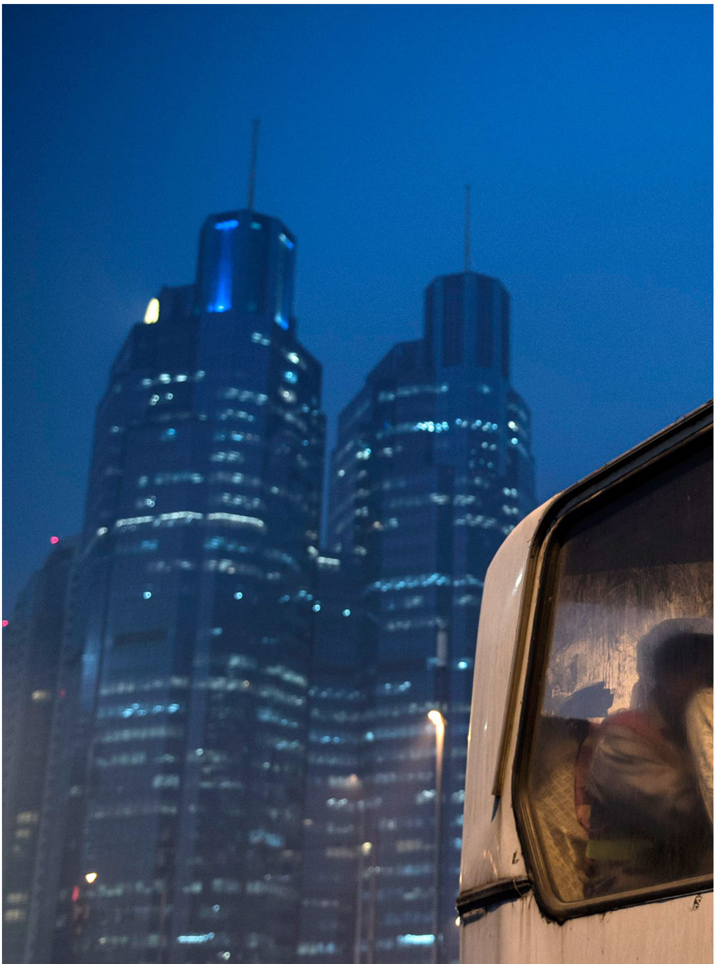
2014年12月9日，中国北京，建筑工人下班后乘坐公车离开。