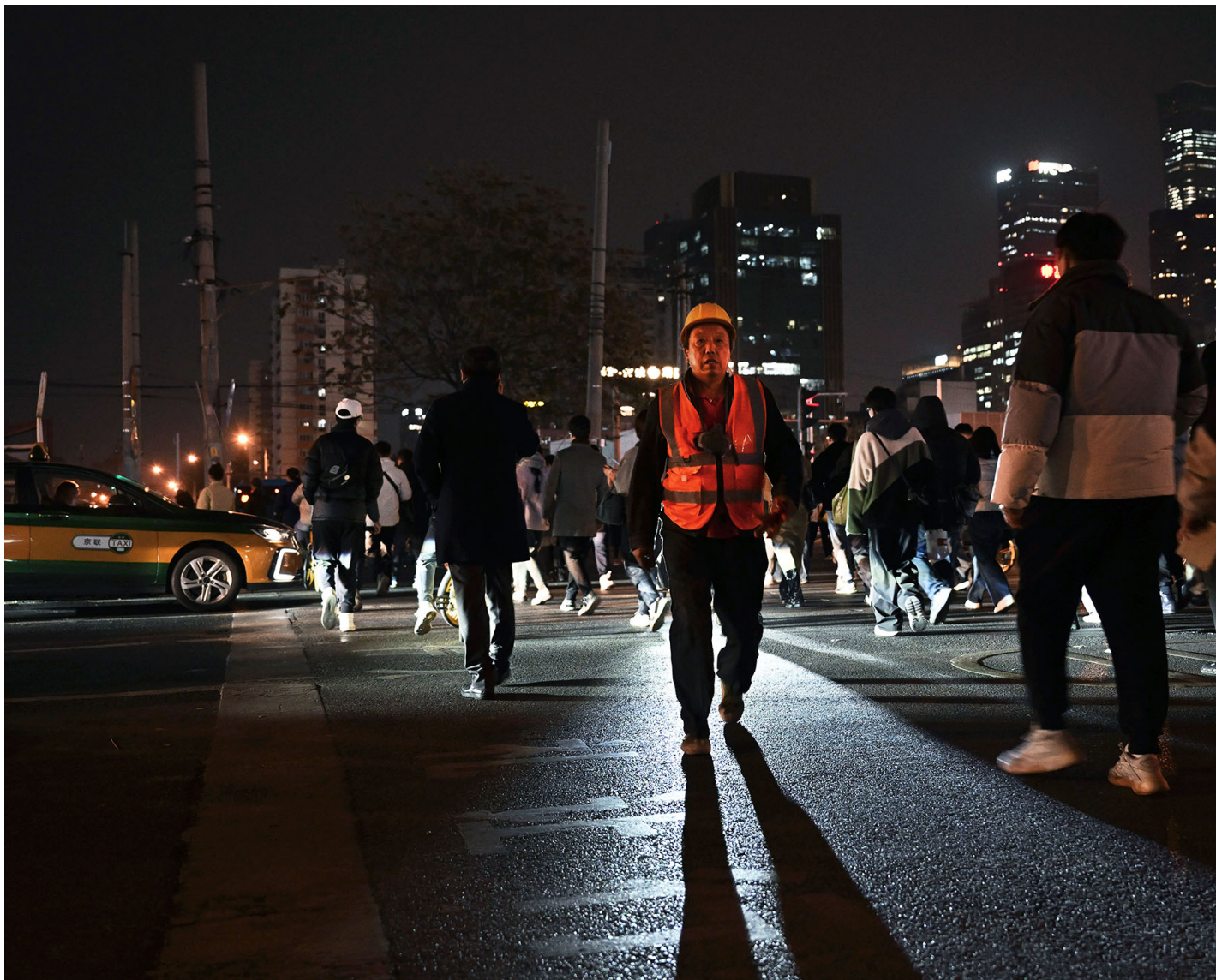
2023年11月15日，中国北京，一名建筑工人经过十字路口。

极致的不稳定性让经济发展陷入某种成瘾状态，企业变得更想“轻装前行”，而劳工则背负更多压力、恐惧和不安全感。