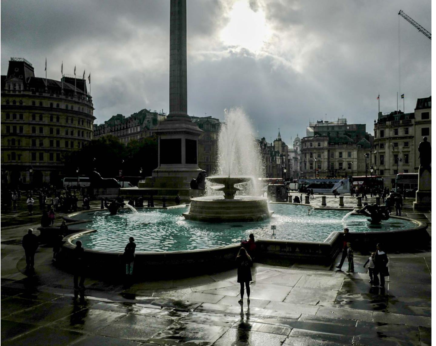
2023年10月24日，人们在英国伦敦特拉法加广场散步。

三年间我移居了11处地方，横跨10个区份。和其他伦敦人一样，永恒处于过渡的情态，没有真正投身任何社区。