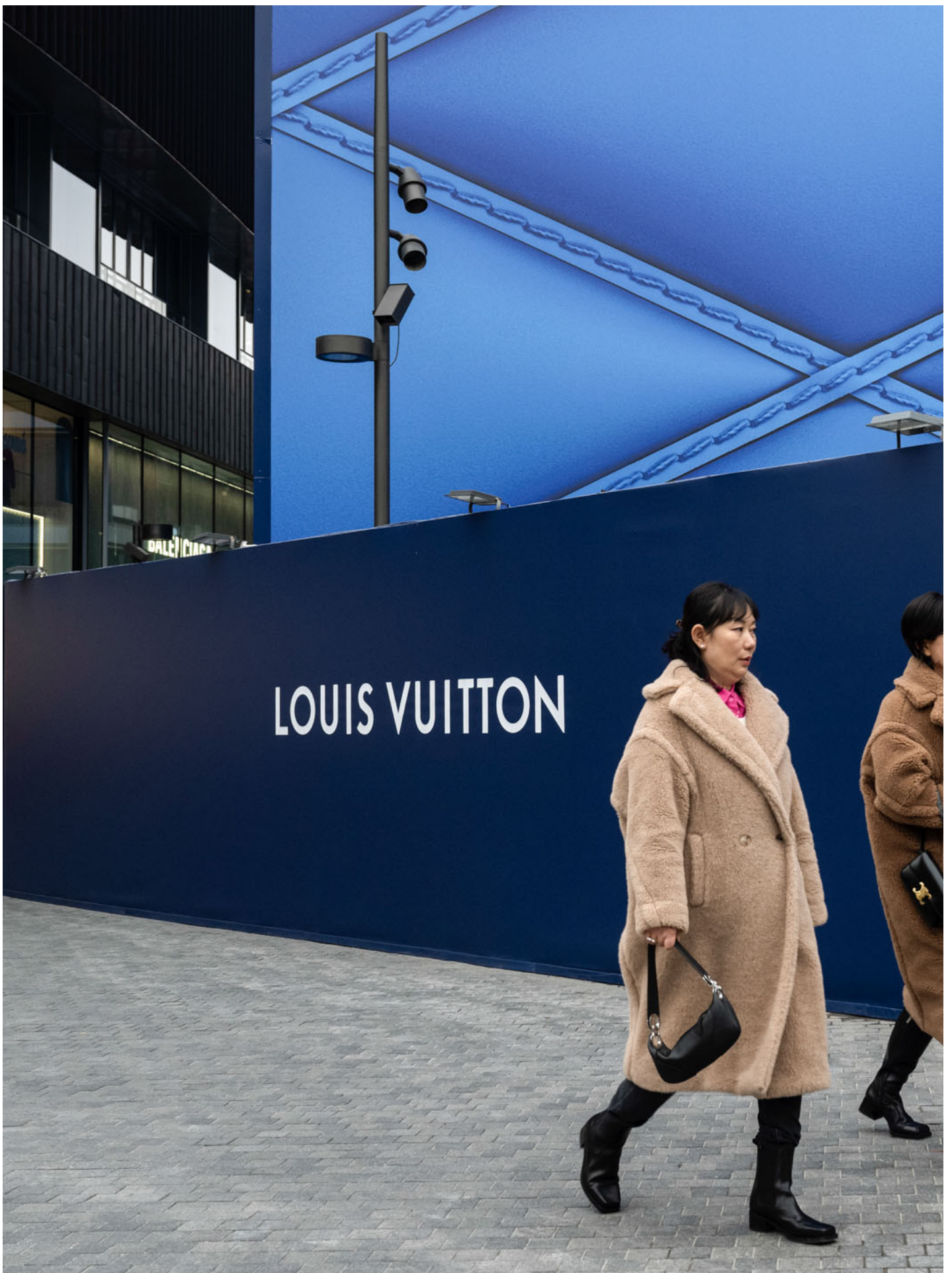
2023年11月15日，中国北京，市民经过奢侈品牌Louis Vuitton的零售店。