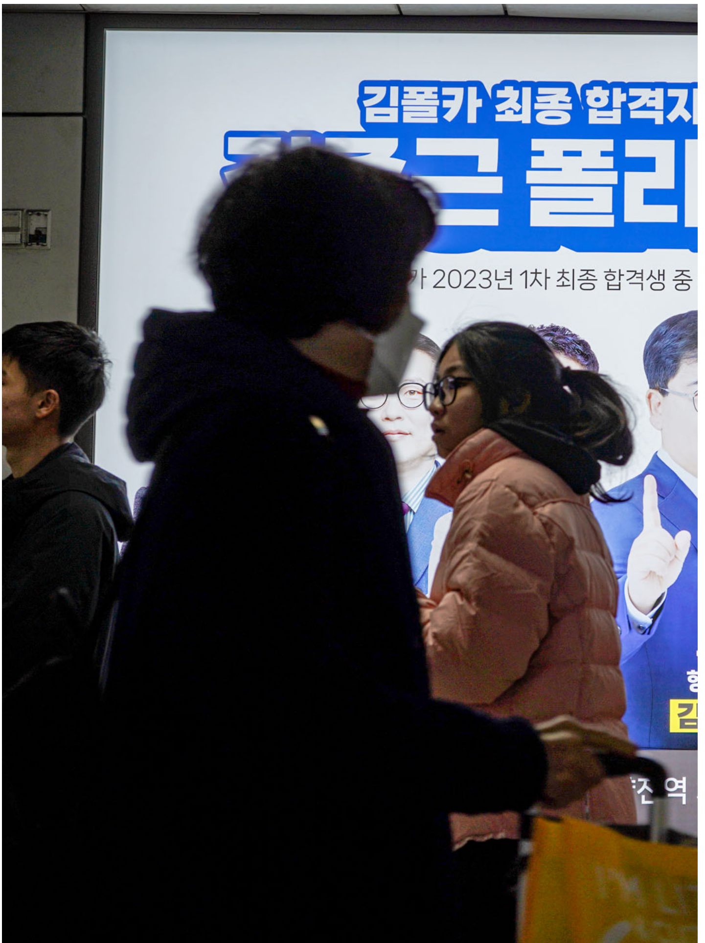
鹭梁津地铁站内的灯箱几乎都是补习班和考试院，基层警察和消防员考试是最热门的。

韩国公务员一共分9级：第9级为最初阶的基层人员，其中又区分为国家职和地方职，一般在街道办事处、市政府等地方工作，最热门的警察和消防员也属此等级，但警消公务员除了笔试，还要通过体能测验；而5级以上则为行政管理阶级，可在行政部门、外交部工作。