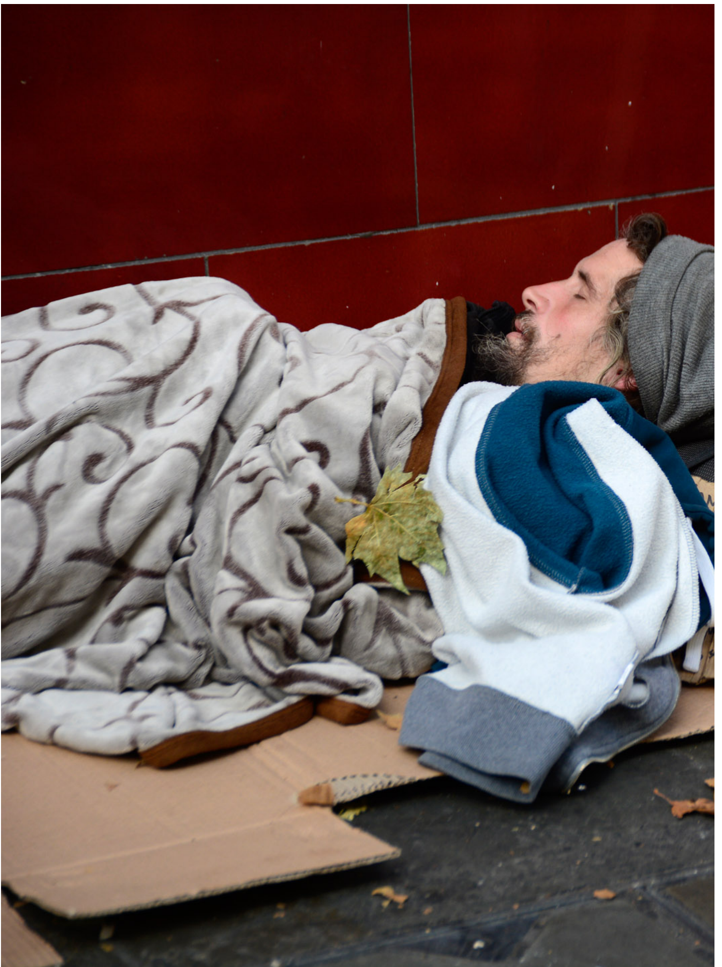
2017年10月2日，英国伦敦，一名无家者在行人道上露宿。

“早晨！”面对我们两位新面孔接待员，有些无家者礼貌地打招呼。有些则表现得很冷漠、冷眼观察著我俩，满满的戒心。我抄下了他们的名字，递上早餐的筹号。身后身形高大、带著一头长曲发、较年长的经理细声说著：“你们要赶快记起他们的名字啊！中心大多的访客（clients）都是常常见面的熟客。你若叫不出名字，他们会很暴躁呢。要知道，无家者在社会上就是无名地存在著。中心以外，未必有人惦记他们的名字。”