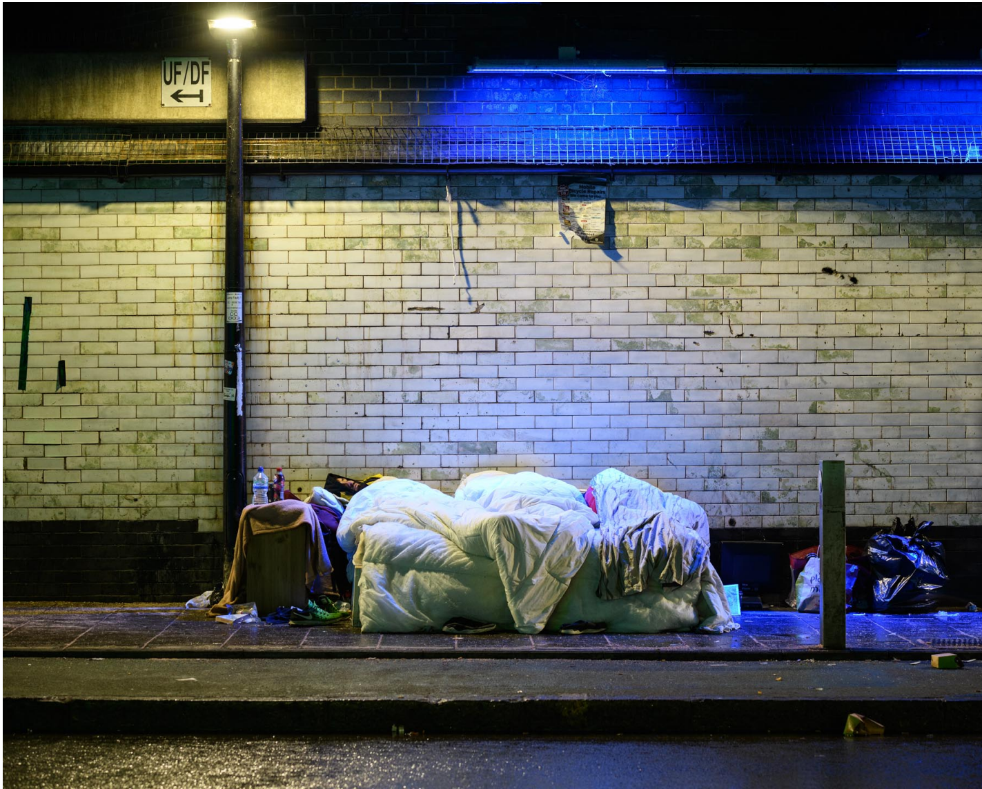
2019年2月1日，英国伦敦，无家者在铁路轨露宿。