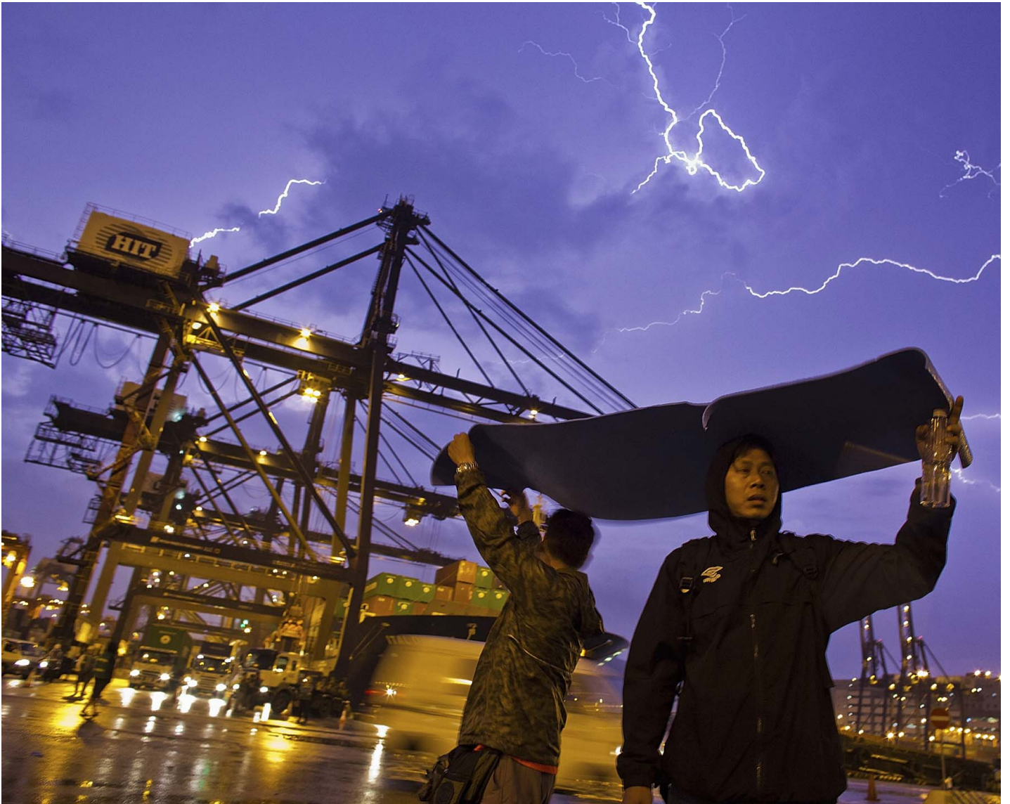
2013年3月28日，香港葵涌货柜码头，码头工人在雷电交加之下在码头罢工。