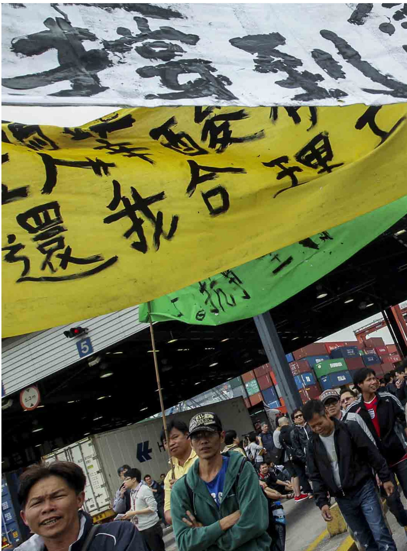
2013年4月1日，葵涌货柜码头，码头工人罢工进入第五天，工人在码头内游行。

几乎所有参加罢工的工人都会说，罢工的最大推手是无良老雇，要不是逼不得已，打工仔女都不会站出来反抗。工潮爆发前夕，码头工人工资被越压越低，工时越来越长，尤其在船期旺季，外判商不增加人手，只一味催逼工人加班。2013年，有些工人工作“直踩”72小时，但日薪只有1315元，比18年前，1995年的1456元更低！平均时薪只有约55元！各外判公司也不重视工业安全，码头内工业伤亡频生，不少工人患职业病。工人的其他工作待遇亦十分恶劣，没有规定的用餐和休息时间，连如厕的地方也缺乏。