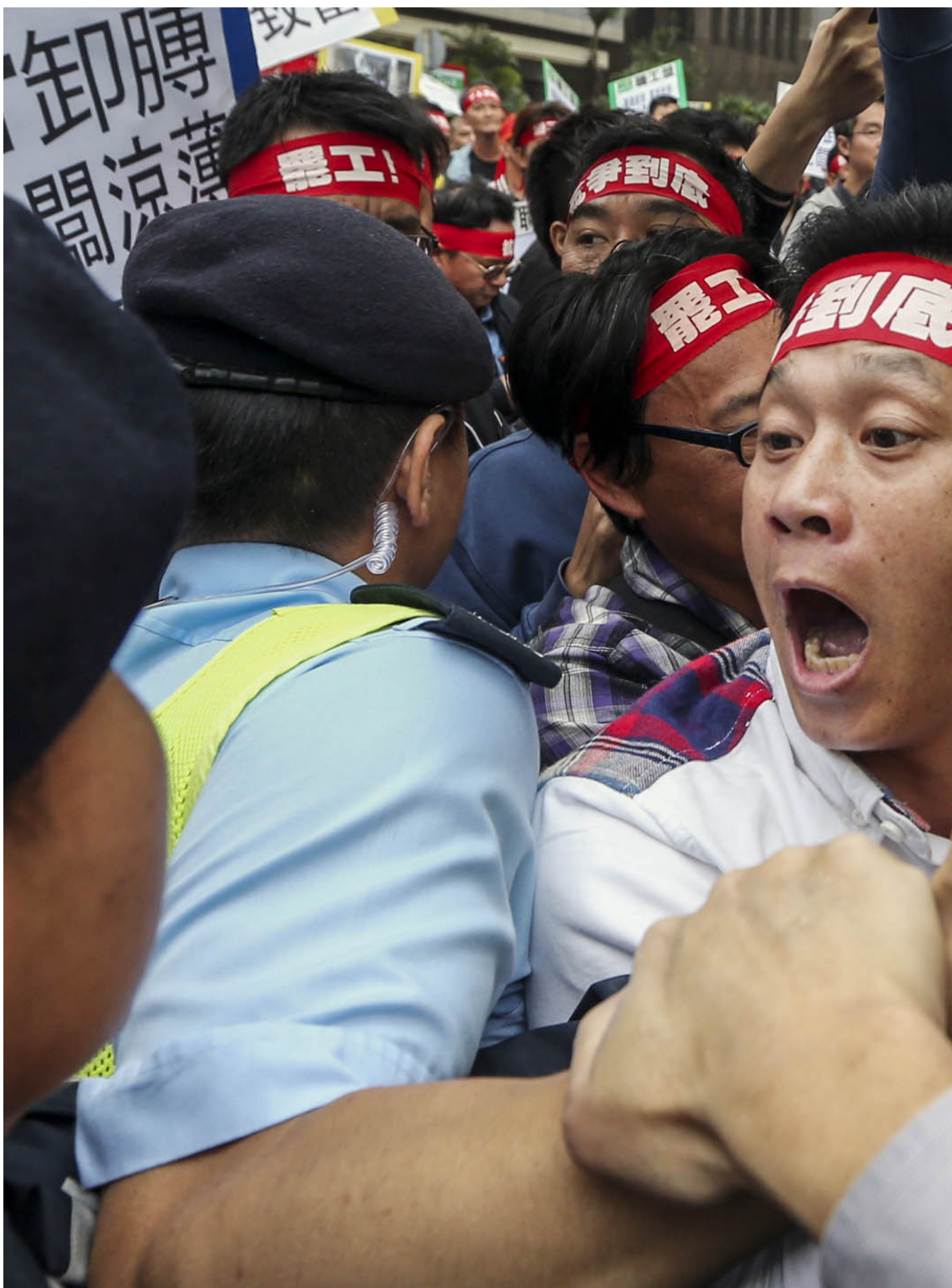
2013年4月22日，码头工人从中环长江中心游行至政府总部，要求见劳工及福利局局长张建宗。