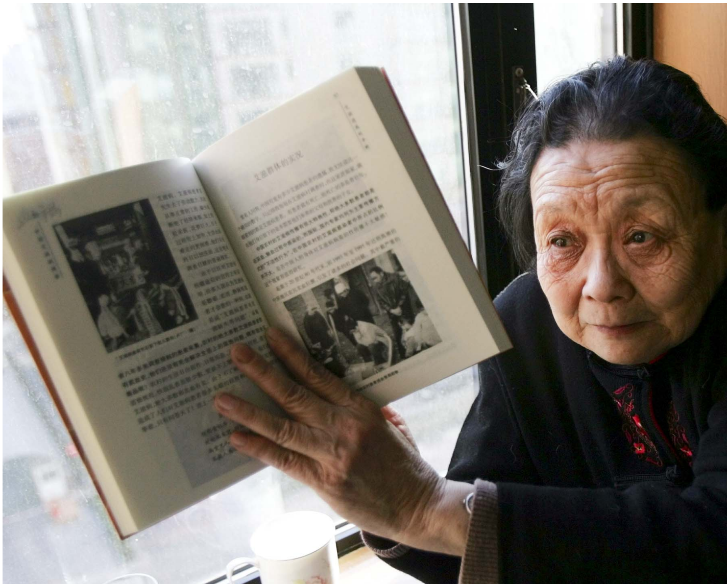
2007年2月22日，高耀洁在北京接受访问时展示她写的一本有关中国艾滋病的著作。

1996年，高耀洁因接触到河南民间艾滋病蔓延问题而自行展开调查，从此走上倡导防治艾滋的社会活动道路。