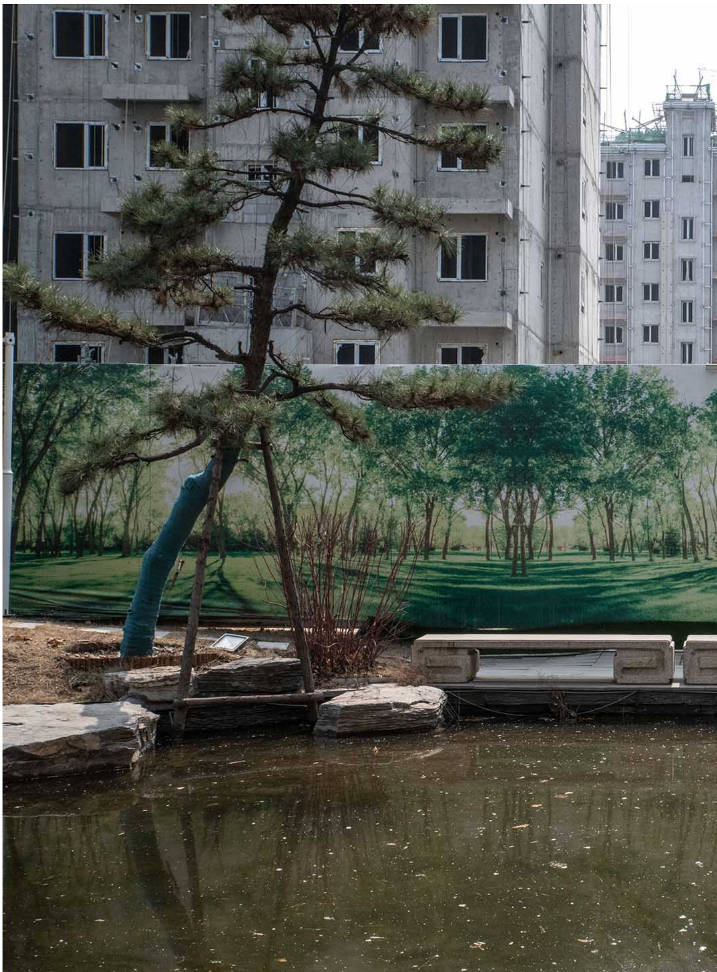
2023年3月19日，北京，恒大集团开发的住宅项目施工现场。

去年两会期间，在业主群里，张娜和其他业主相互鼓励时，说了一句“咱们不能坐以待毙，我们得行动起来”。“行动”二字被警察告知是敏感言论。当晚夜里11点，两名北京来的警察敲响张娜家门，警告她“这句话被境外势力利用了，你要负法律责任”。警察走后，张娜在微信群聊里发现，群里另一名业主也刚刚送走“帽子叔叔”。