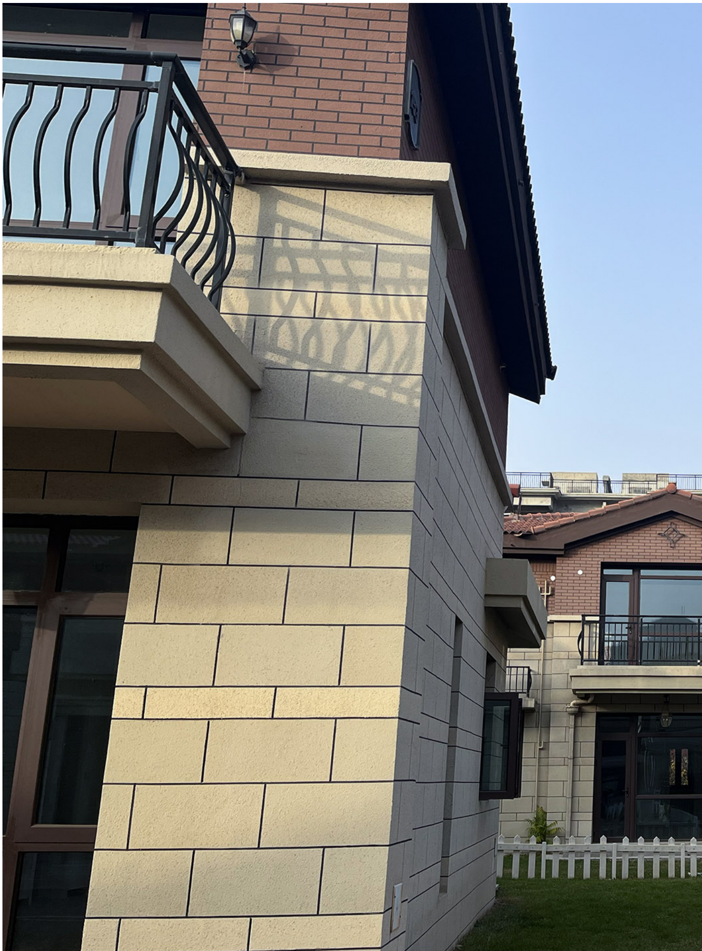
在碧桂园长城河谷二期别墅区，清晰可见不远处烂尾的居民房。

碧桂园也停在了三年前。因为项目开发比长城小镇早两年，建成区域更大。其中一片别墅区已有几十户入住。得知有人来看房，物业小李报出了一个优惠价，150万元就可以买下一套近两百平米的别墅。言语间他又似乎在委婉提醒要慎重考虑，“这里还是个村，按现在这个节奏，未来七八年我觉得（不太有希望）把周边设施发展起来”。