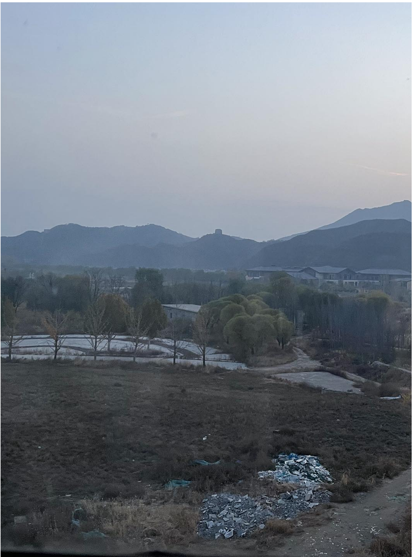
站在长城小镇的一栋楼房的五楼，可看到潮河与长城景观。