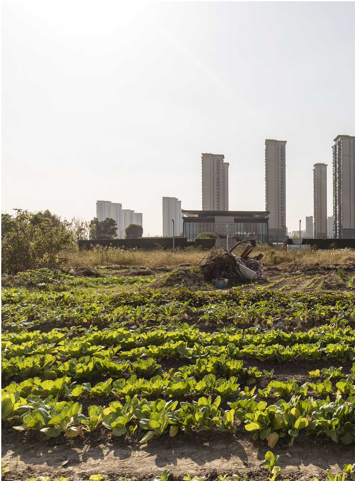
2023年11月2日，江苏省苏州市，中国恒大集团正在兴建的住宅大楼。

2005年开始，滦平九年义务教育阶段和高中阶段的学杂费、书本费全由“政府埋单”。这次收费时，学校和家长解释，因为政府没钱了。“说政府欠了外面钱，让学校自筹资金。”他说，“你给报道报道，这是咋回事？”