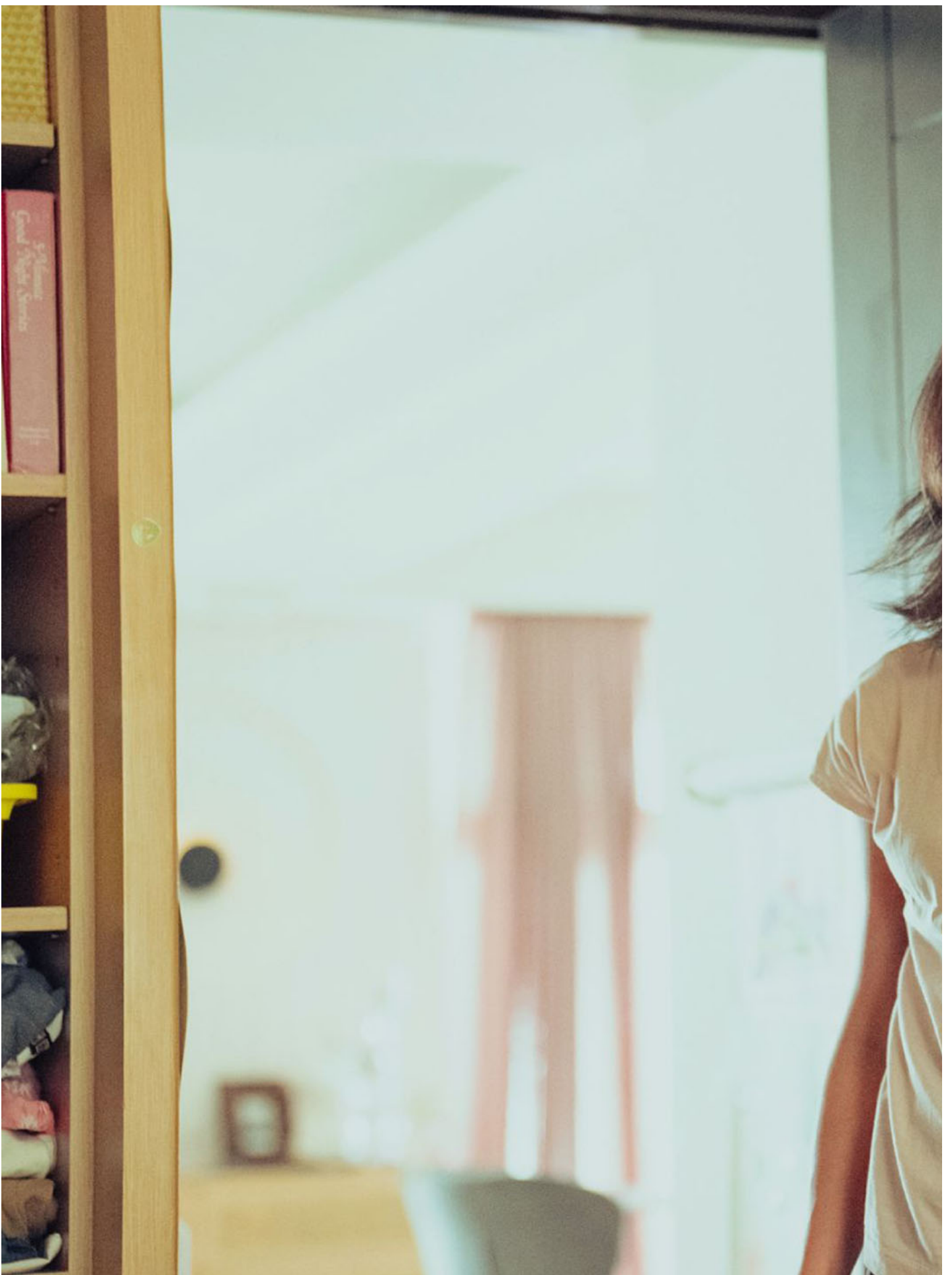
《小晓》剧照。