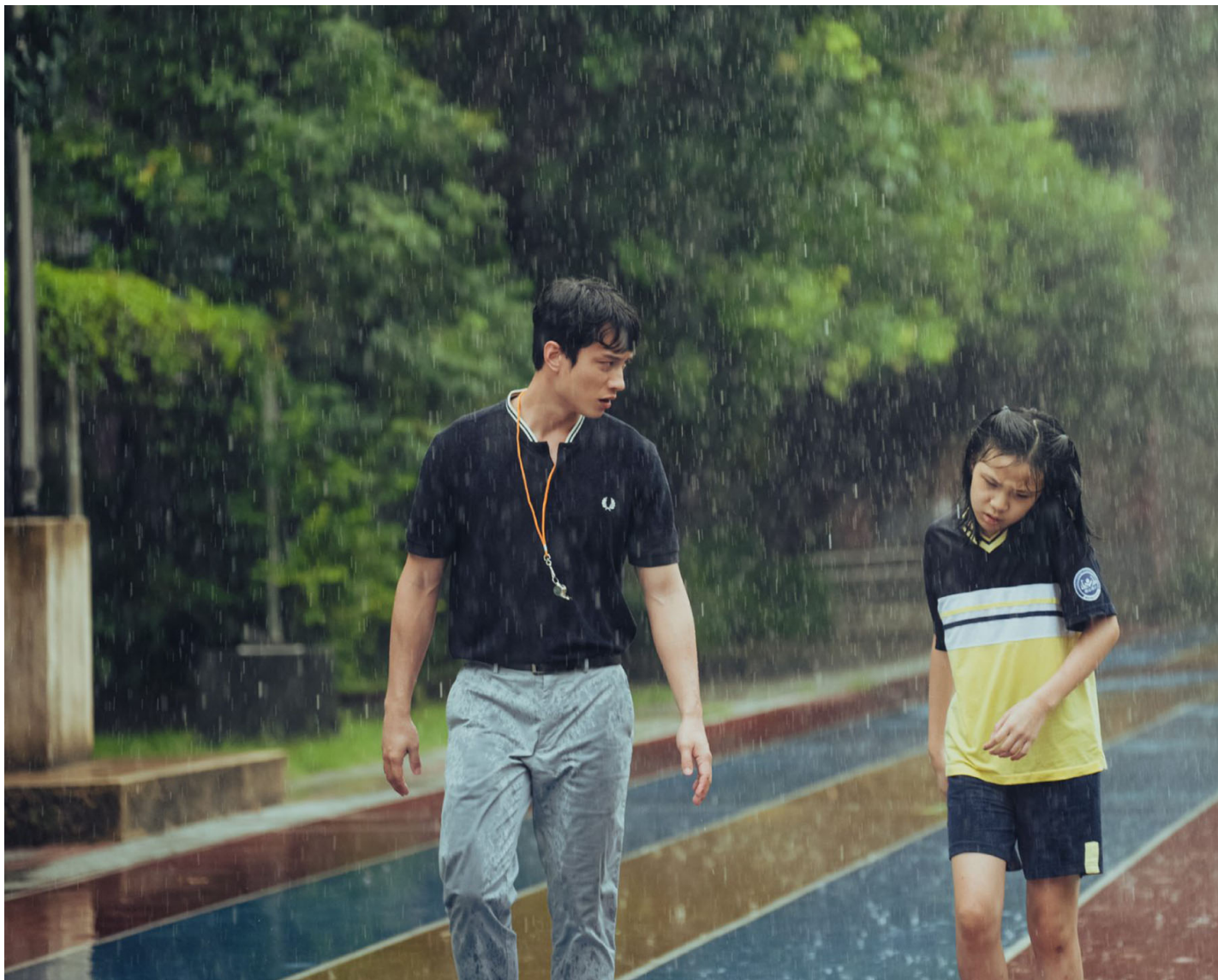
《小晓》剧照。

“当身历其境才真正发现，只有把能量花在学习理解不一样的人的时候，才能与世界和解，不至崩溃。”