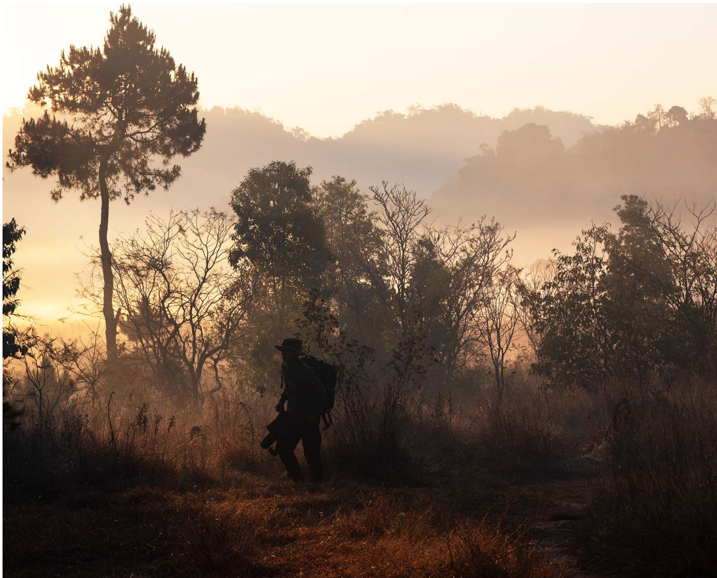
2023年2月14日，缅甸，克伦尼族国防军（KNDF）的一名士兵在田野中行走。

11月的战事意味着反抗武装和军政府的关系出现了逆转，前者转入大规模进攻，而后者开始进入防御。