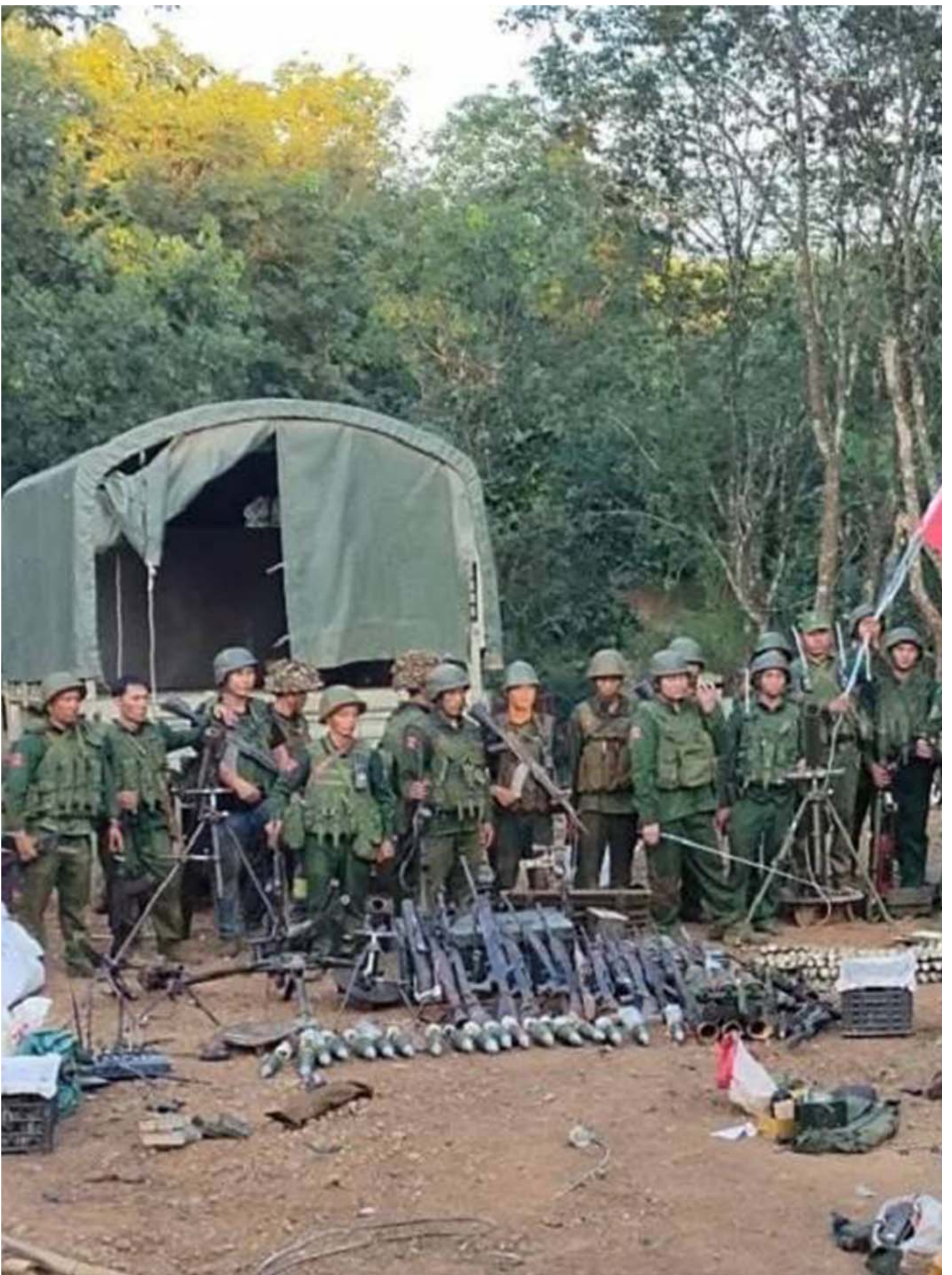
缅甸民族民主同盟军。

时值三支地方武装：德昂族的德昂民族解放军（TNLA）、若开族的若开军（AA）和华人的缅甸（果敢）民族民主同盟军（MNDAA）组成的“三兄弟联盟”发起“1027”攻势整整一个月。在这一个月中，缅甸各地反军政府武装呈现出前所未有的同步攻击和互相支援的态势。使已经政变掌权近三年的军政府面临严峻挑战。若这一态势持续，则2021年开始的缅甸内战转折点已经出现。 （延伸阅读：《缅甸政变两年：在台缅人经历的动荡、选择和“最后一搏”的希望》）