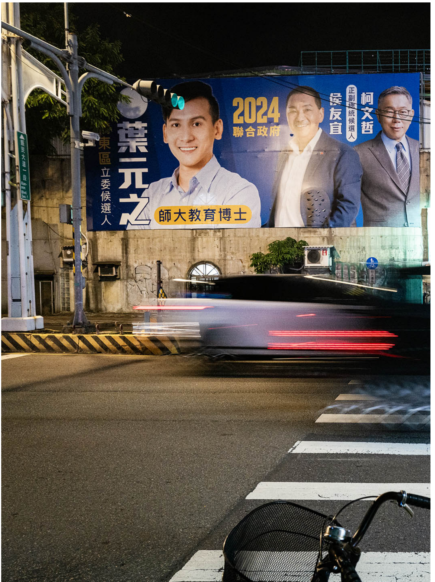
2023年10月25日，板橋，一名国民党立委候选人在广告板上印上柯文哲和侯友宜的肖像。