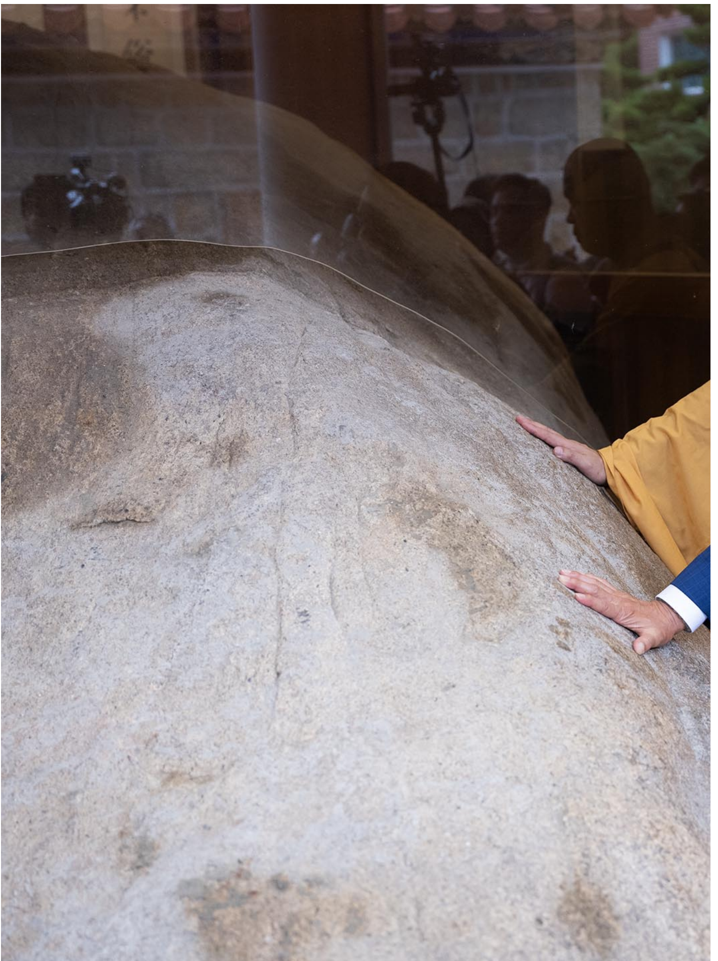
2023年8月23日，郭台铭于金门的寺庙参访。