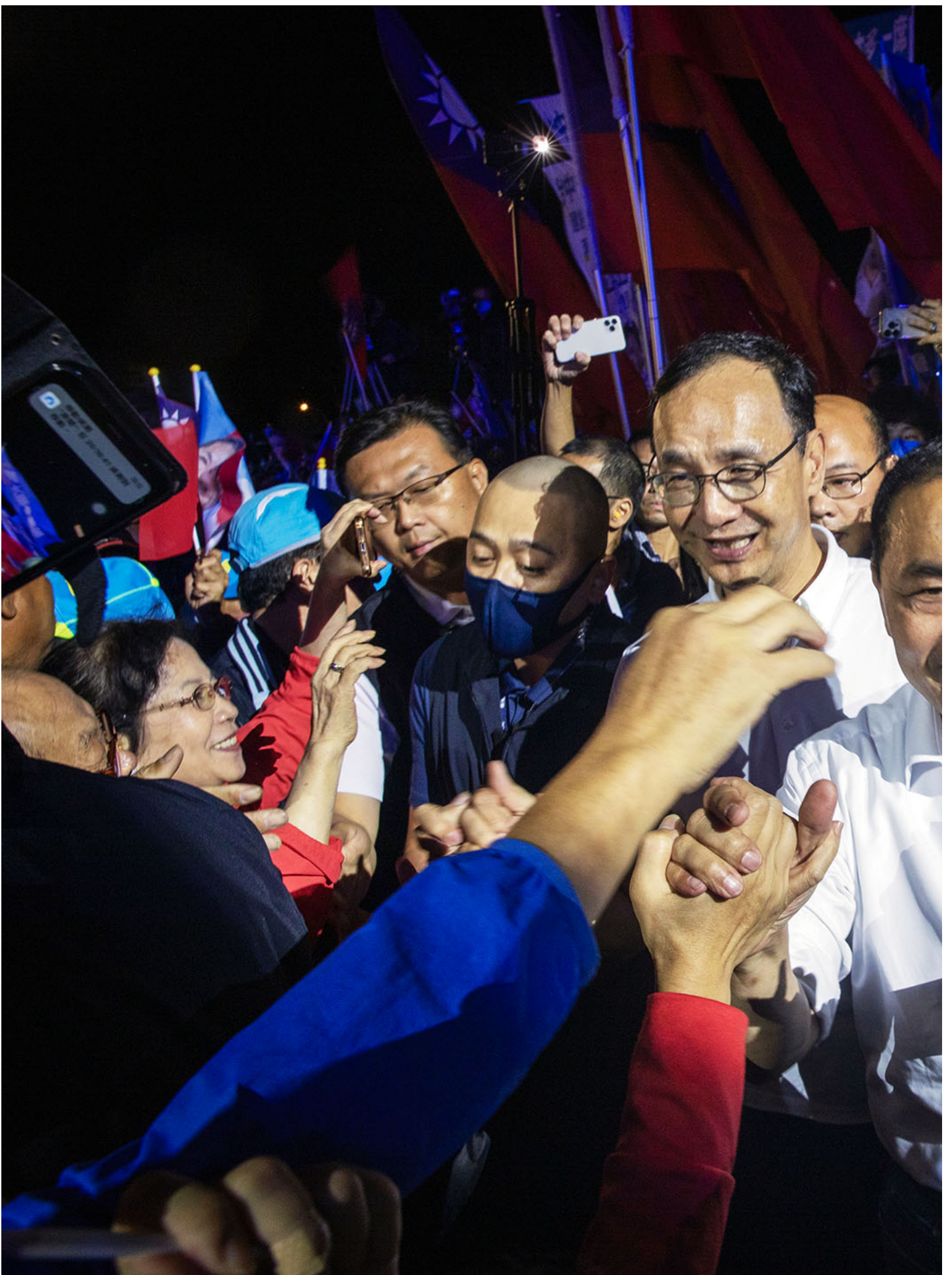
2023年10月20日，国民党总统参选人侯友宜在台中市举行造势大会。