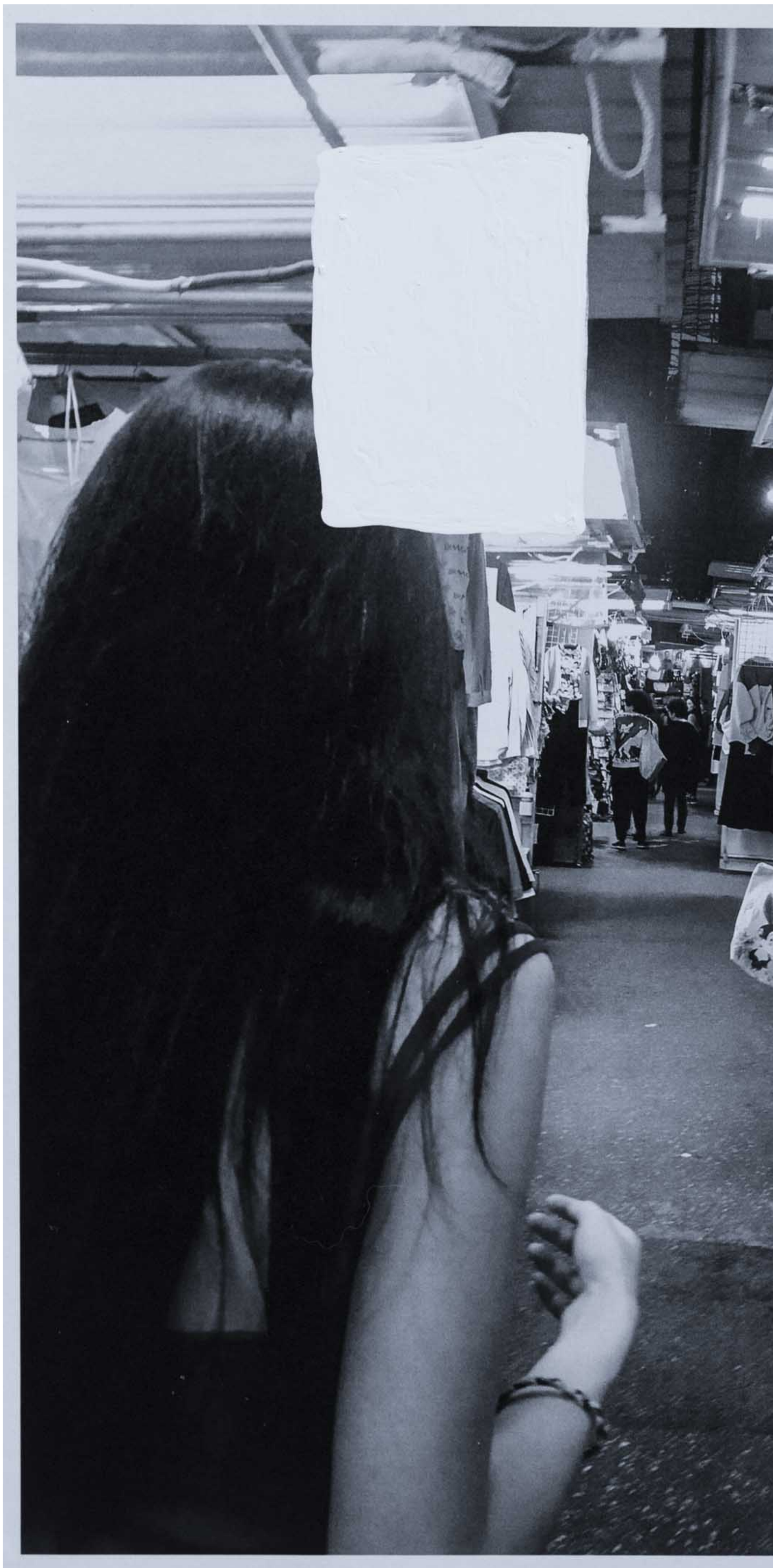
11月初，宝荣在香港中环。