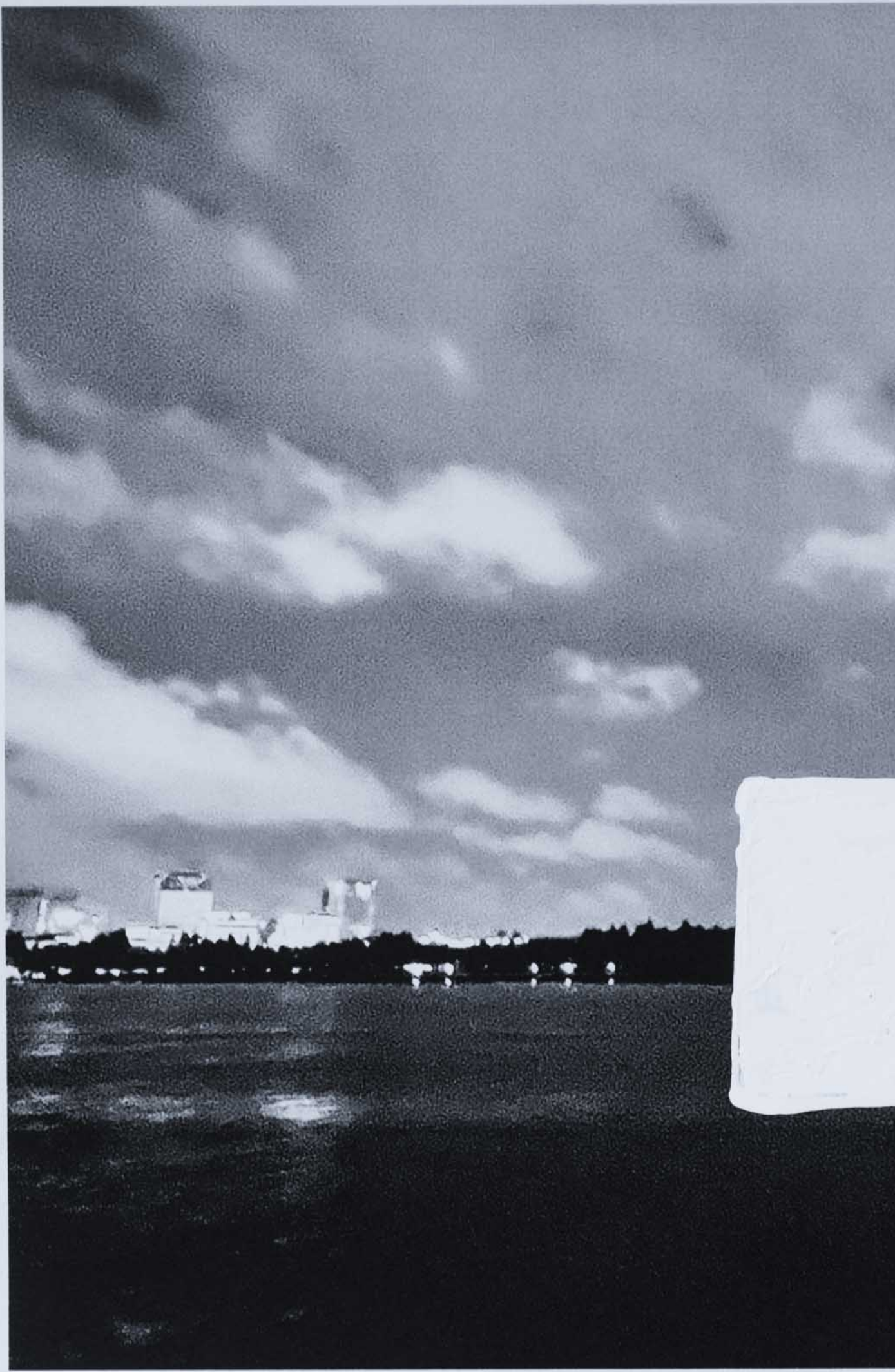
2023年夏末立秋前的黄浦江边。

获释者们深知不能在微信里联系以前的任何一个朋友；被警察没收又归还的手机、电脑似乎随时在搜集新的“罪证”；人们辗转得知其他人的近况，知道他被释放——这样就够了，不必再说什么。很多人就此断联。